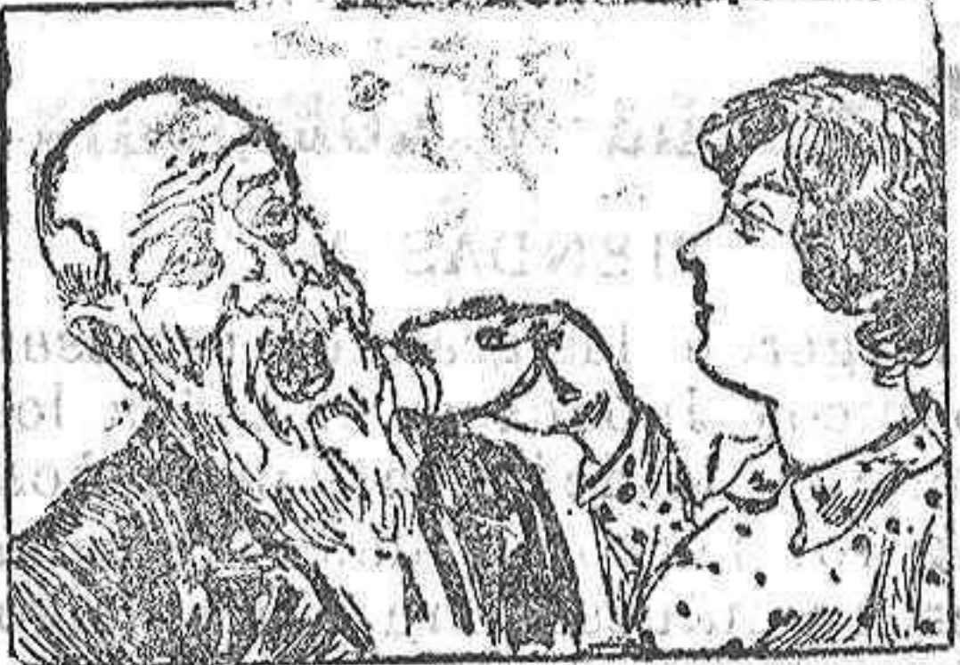
(La solución mañana.)