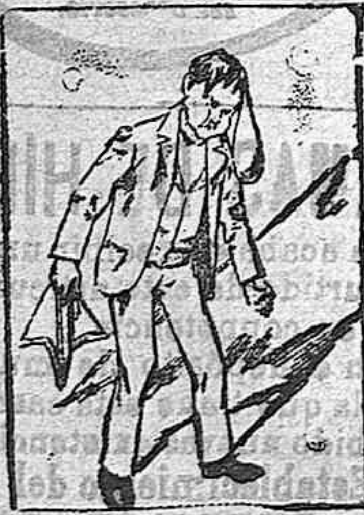
(La solución mañana.)

Solución a la charada de ayer: Pantalón. FRASE HECHA.