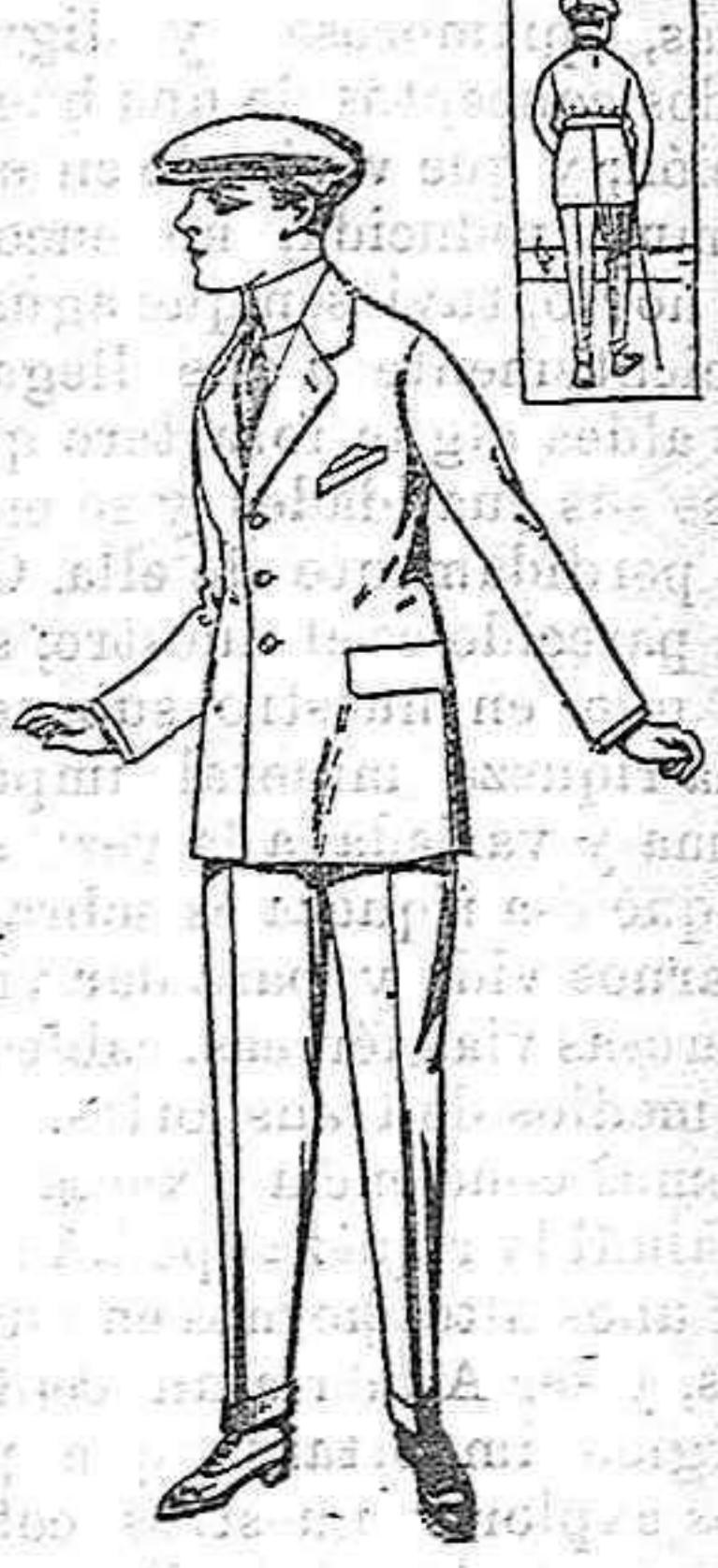
Trajes modelo sport, de lanilla, melton, etc. para jovencitos de 10 a 16 años. De pesetas 25 a 58.

celebrado en New-York una reunión, asistiendo 2.000 delegados. Estos protestaron contra las deportaciones de los sinnifiners. Los oradores hicieron manifestaciones amenazando con que votarán a los elementos demócratas con oposición en las elecciones de Noviembre.