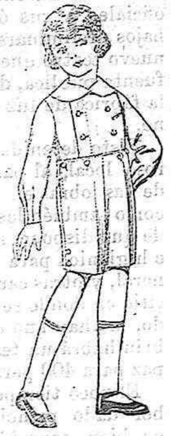
Trajes de vicuña o estambre azul, para niños de 3 a 7 años. De pesetas 6 a 13.