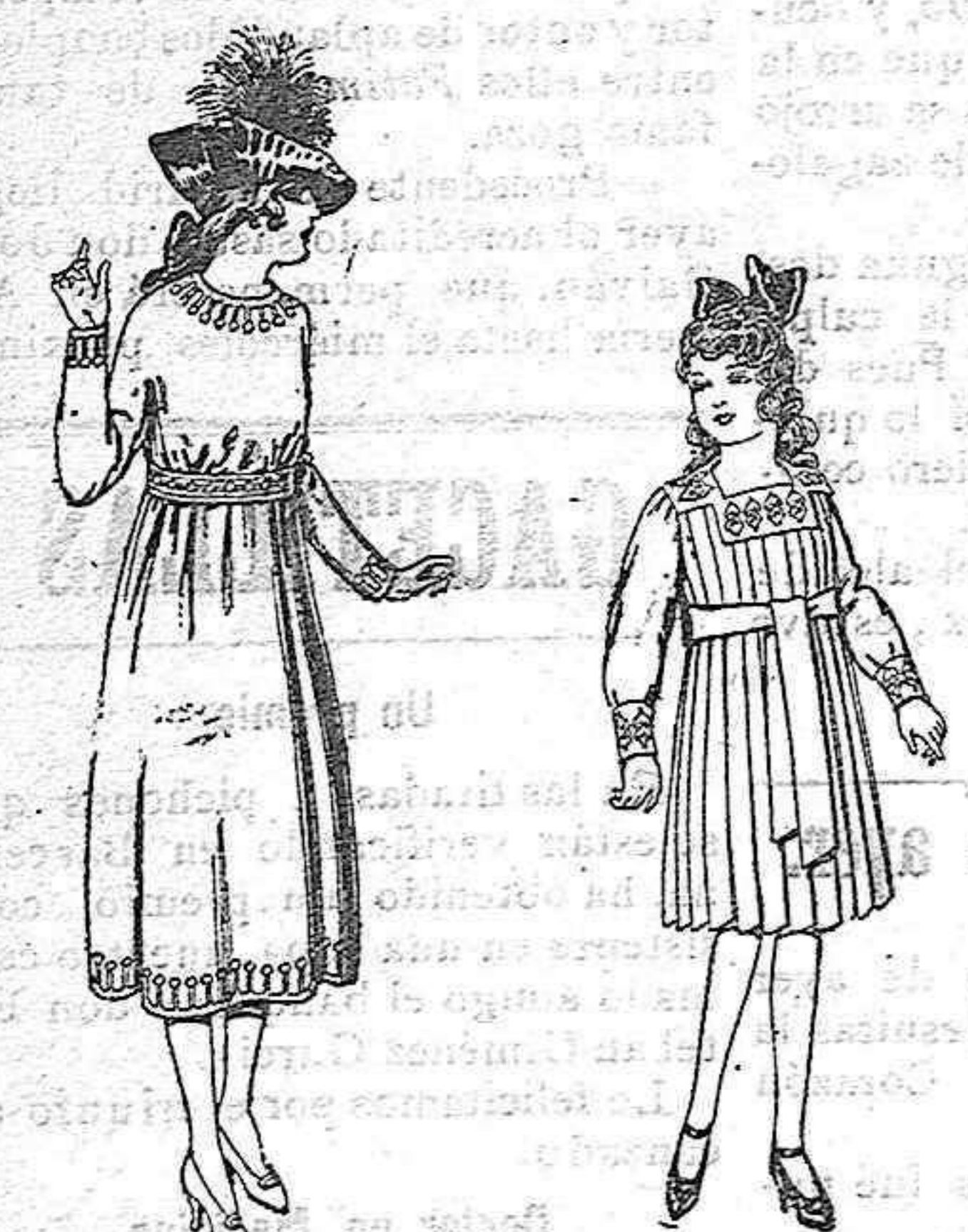
Vestidos de sarga inglesa, estambre, etc. en azul y colores adornos bordados. De pesetas 40 a 55.