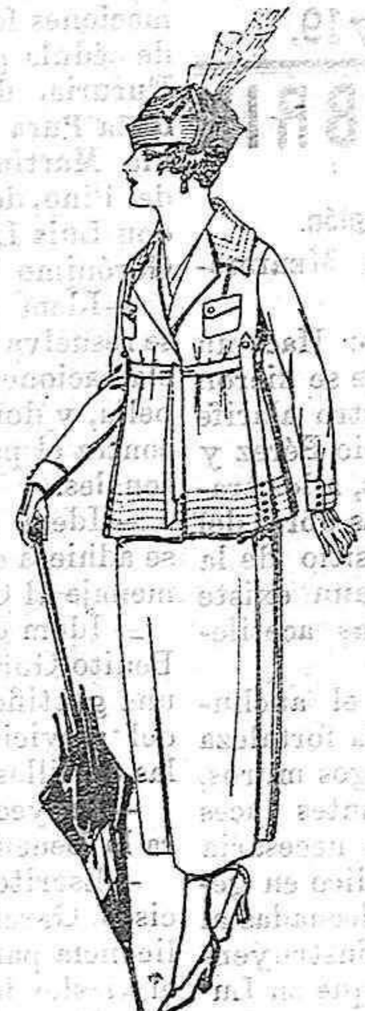
Trajes de gabardina, estambre, lanilla, etc. en negro, azul y color, adorno bordados. De pesetas 77 a 85.