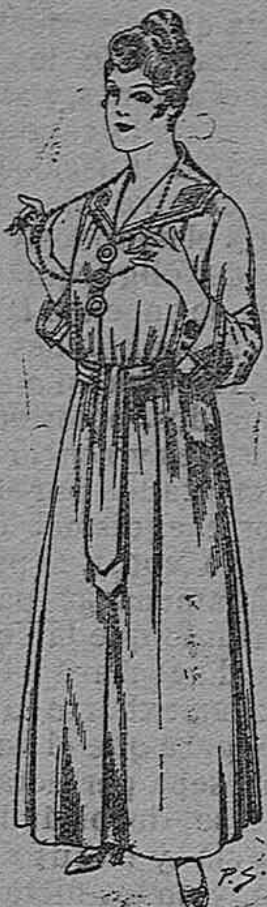
Bata de crepón color, cuello bordado De pesetas 6 á 11