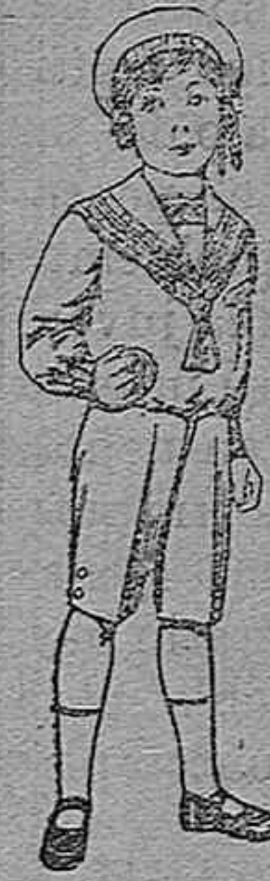
Trajes marinera de vicuña azul, para niños de 4 á 9 años. Pt. 6 á 20