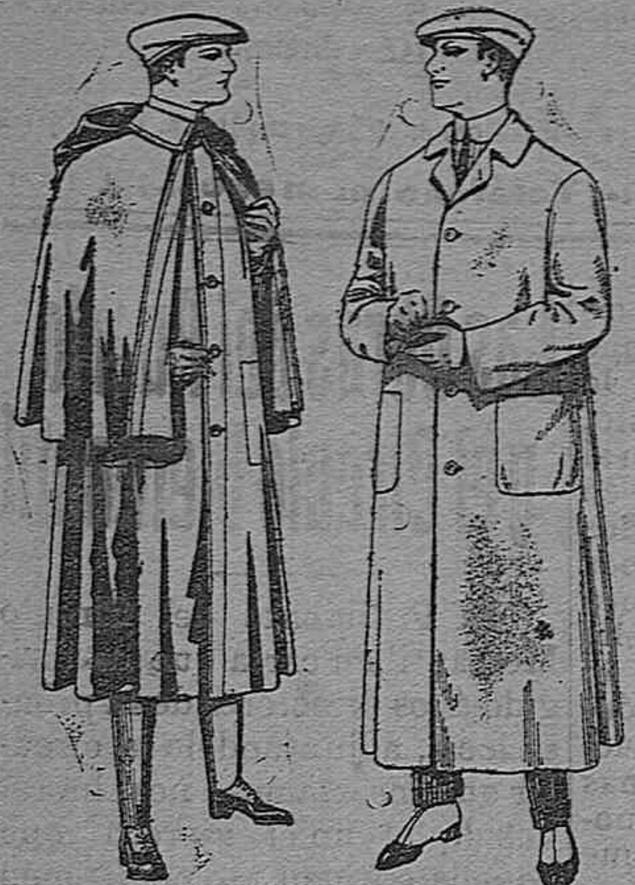
Impermeables forma Guardapolvos de dril mackfarland en negro y azul De pesetas 55 á 100 De pesetas 6 á 11

Gran exposición de artículos para la temporada