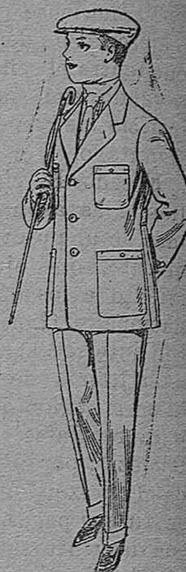
Trajes modelo Sport de dril listado para jovencitos de 10 á 16 años. De pesetas 11 á 17