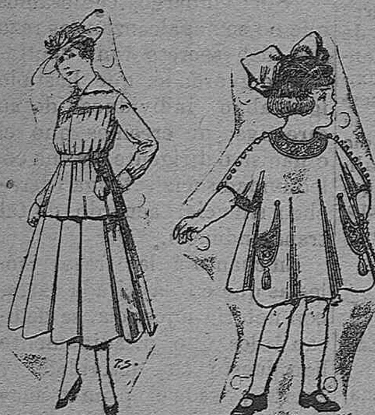
Trajes de lanilla Vestidos de lanilla para jovencitas de niñas de 4 á 9 años De pesetas 13 á 19. Pt. 50 á 55 De pesetas 30 á 38