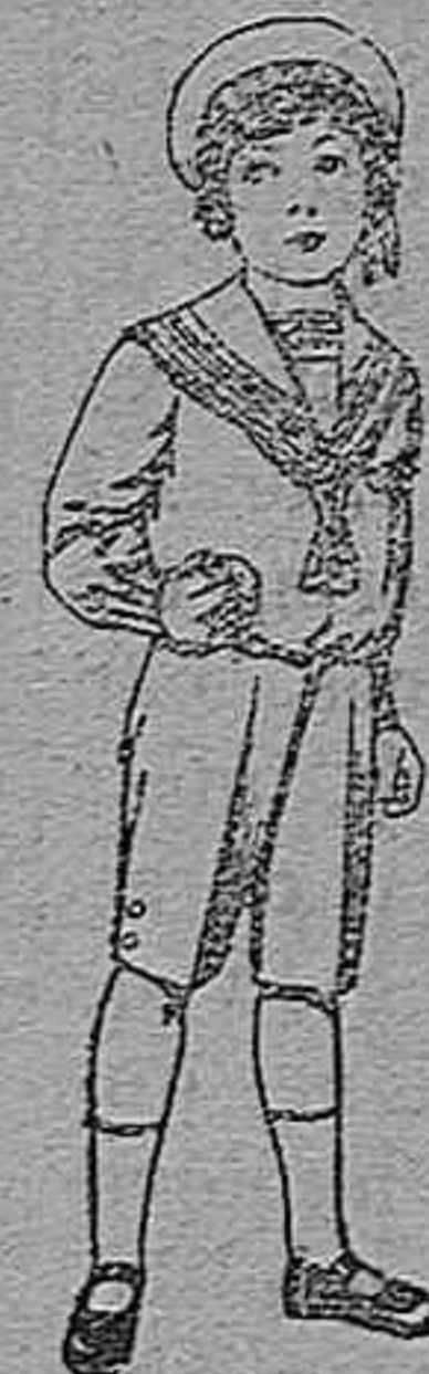
Trajes marineros de azul, para niños de 4 á 9 años. Pt. 6 á 20