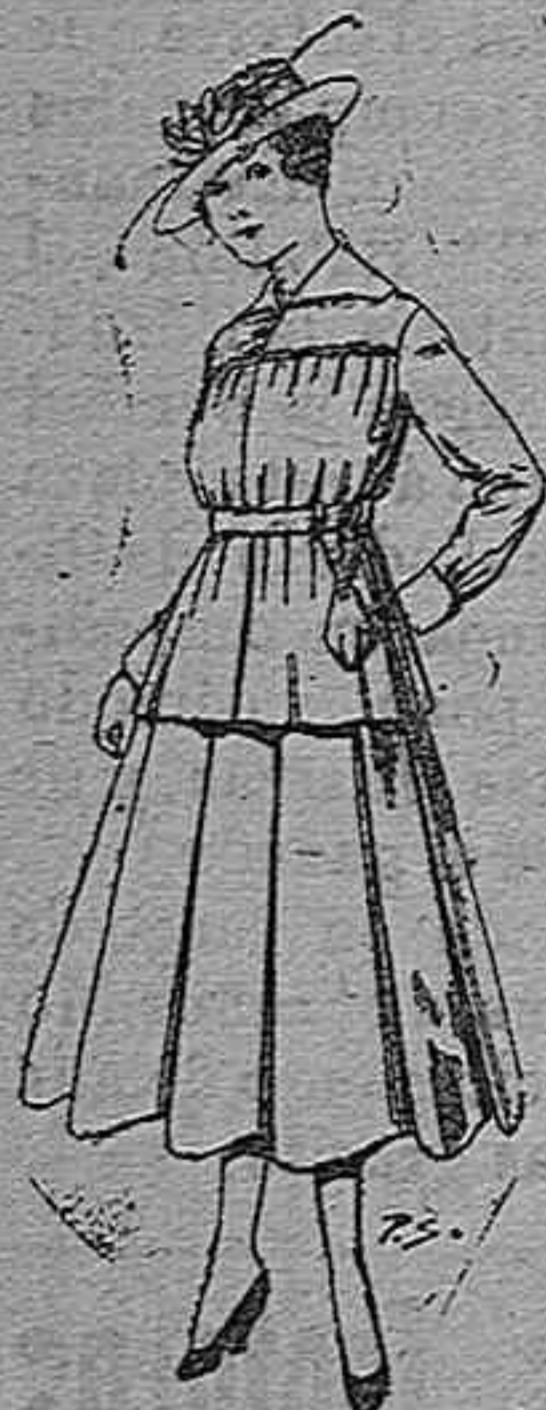
Trajes de lanilla para jovencitas de 13 á 19. Pt. 50 á 55