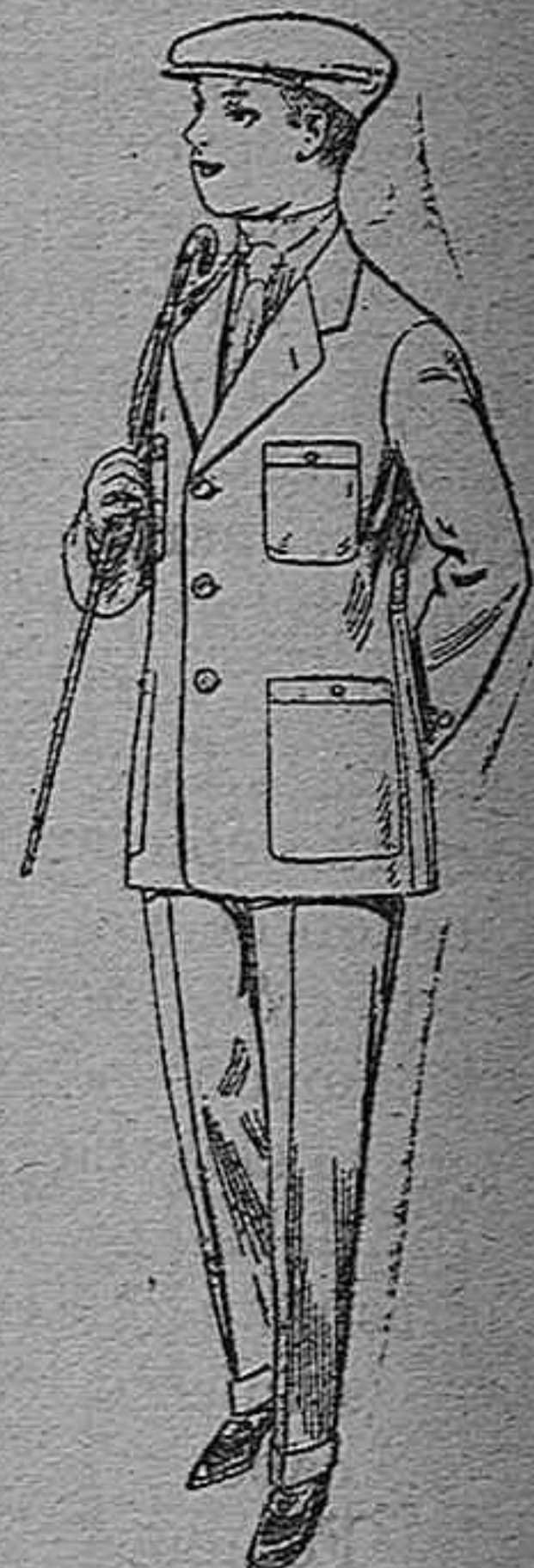
Trajes modelo Sport de dril listado para jovencitos de 10 á 16 años. De pesetas 11 á 17