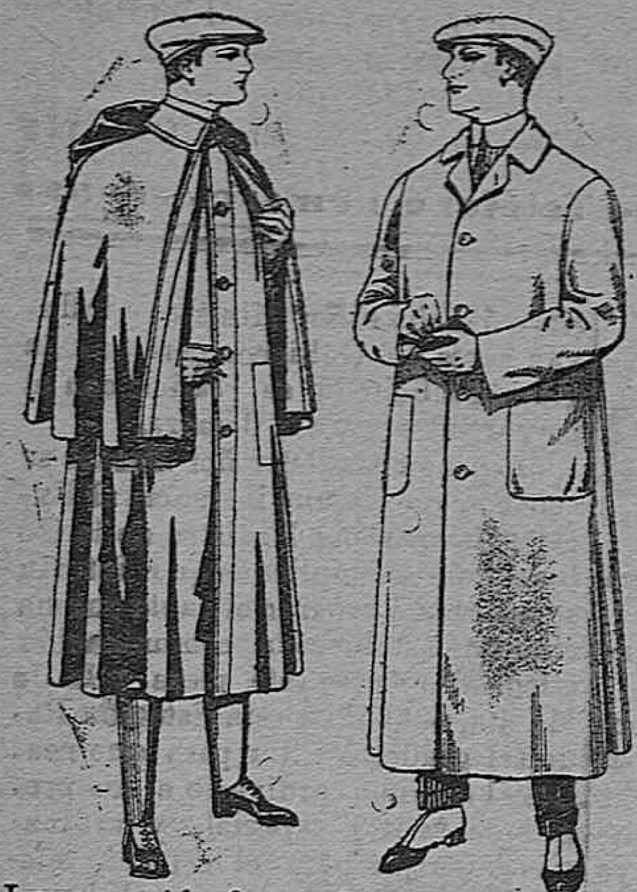
Impermeables forma Guardapolvos a dril mackfarland en negro y azul De pesetas 55 á 100

Gran exposición de artículos para la temporada