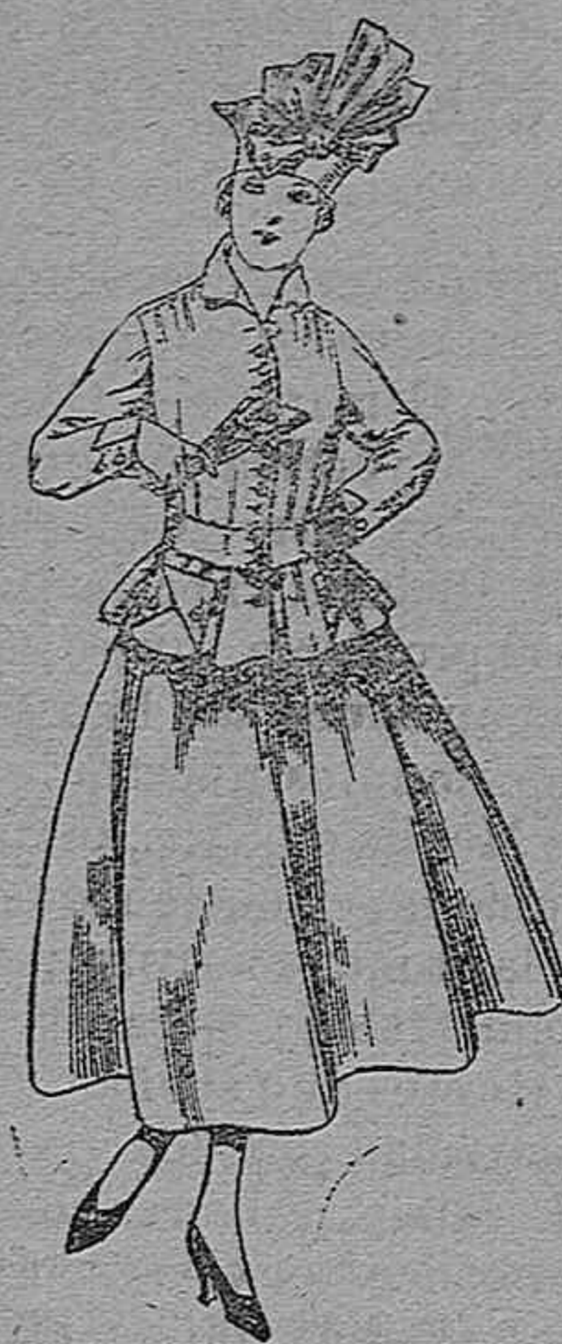
Trajes de lanilla negra, azul y color A pesetas 70