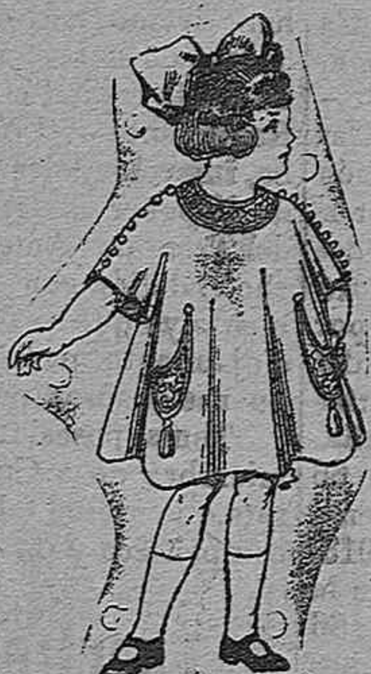
Vestidos de lanilla para niñas de 4 á 9 años De pesetas 30 á 38.