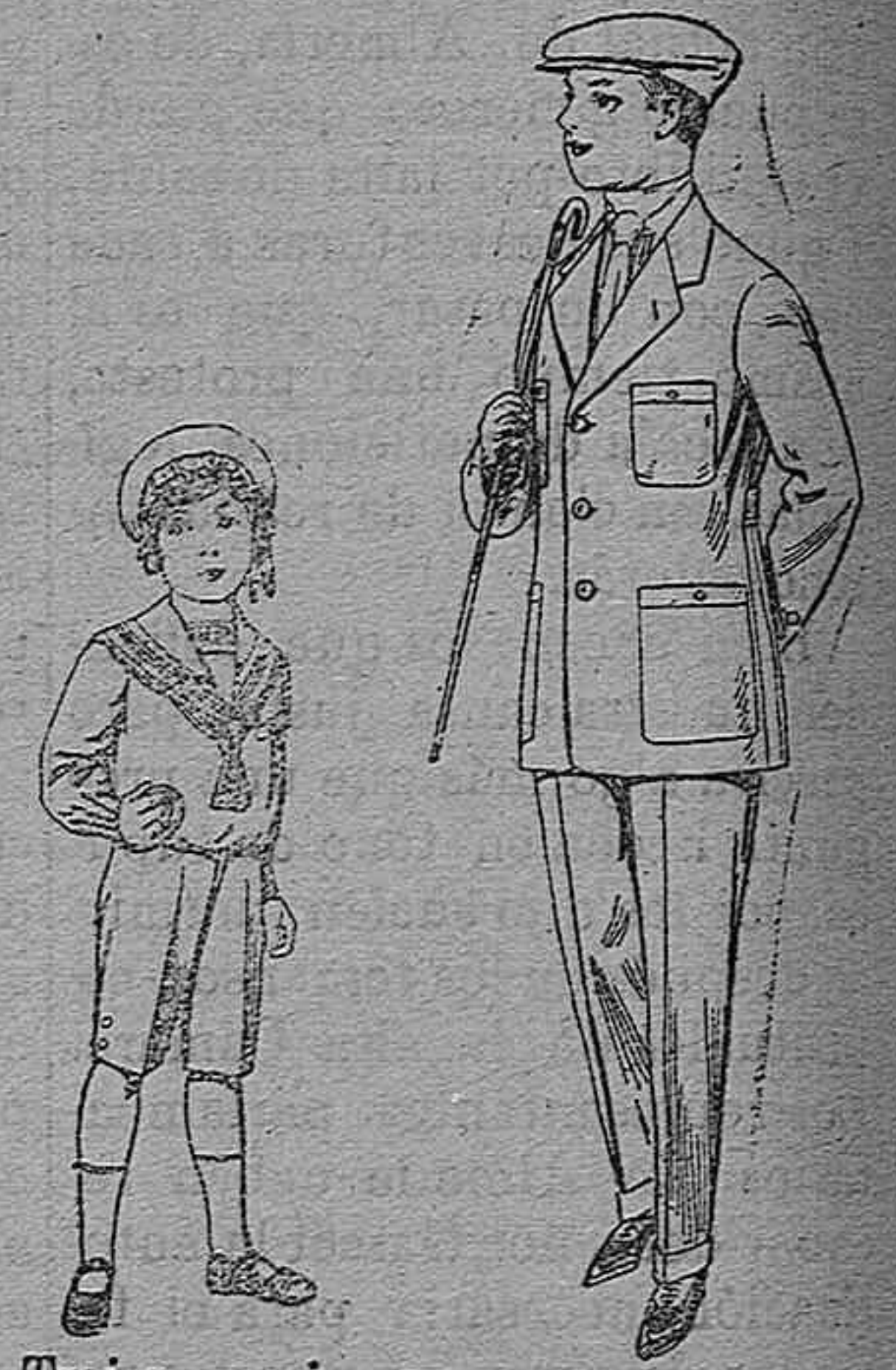
Trajes marinera deviciana azul, para niños de 4 á 9 años. Pt. 6 á 20 Trajes modelo Sport de dril listado para jovencitos de 10 á 16 años. De pesetas 11 á 17

Gran exposición de artículos para la temporada