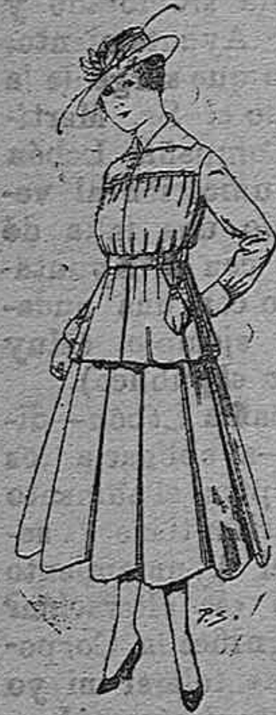
Trajes de lanilla para jovencitas de 13 á 19. Pt. 50 á 55