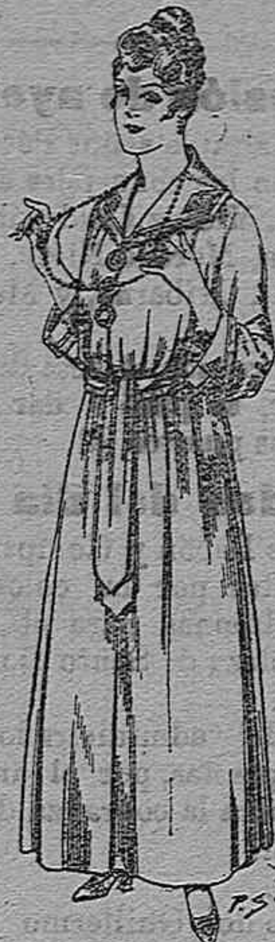
Bata de crepón color, cuello bordado De pesetas 6 á 11