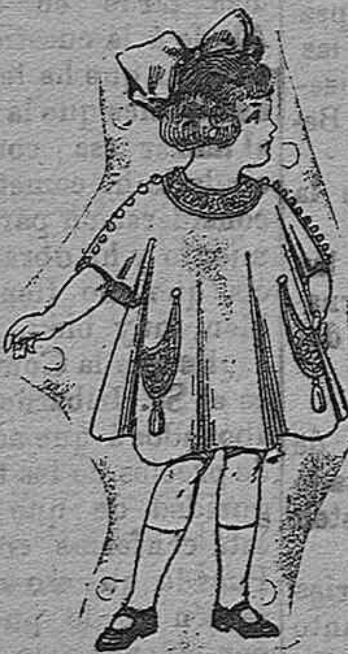
Vestidos de lanilla para niñas de 4 á 9 años De pesetas 30 á 38