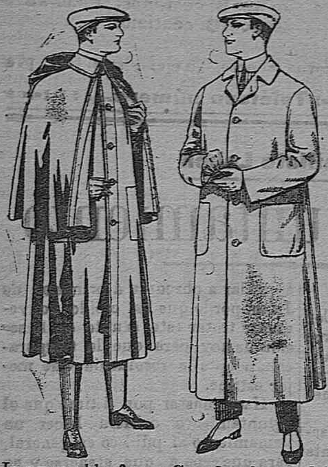
Impermeables forma Guardapolvos de dril mackferland en negro y azul De pesetas 55 á 100 De pesetas 6 á 11