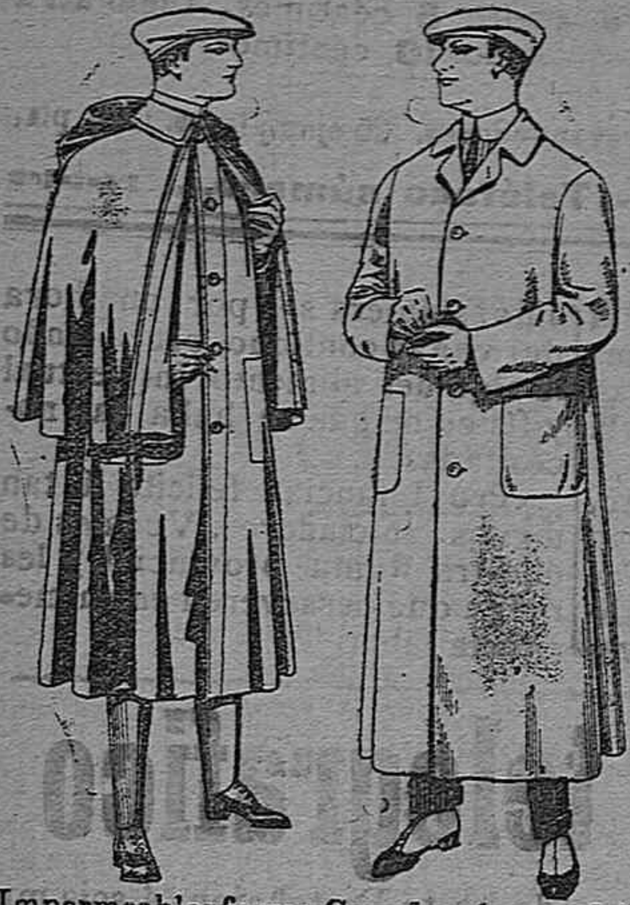
Impermeables forma Guardapolvos de dril mackfarland en negro y azul De pesetas 55 á 100