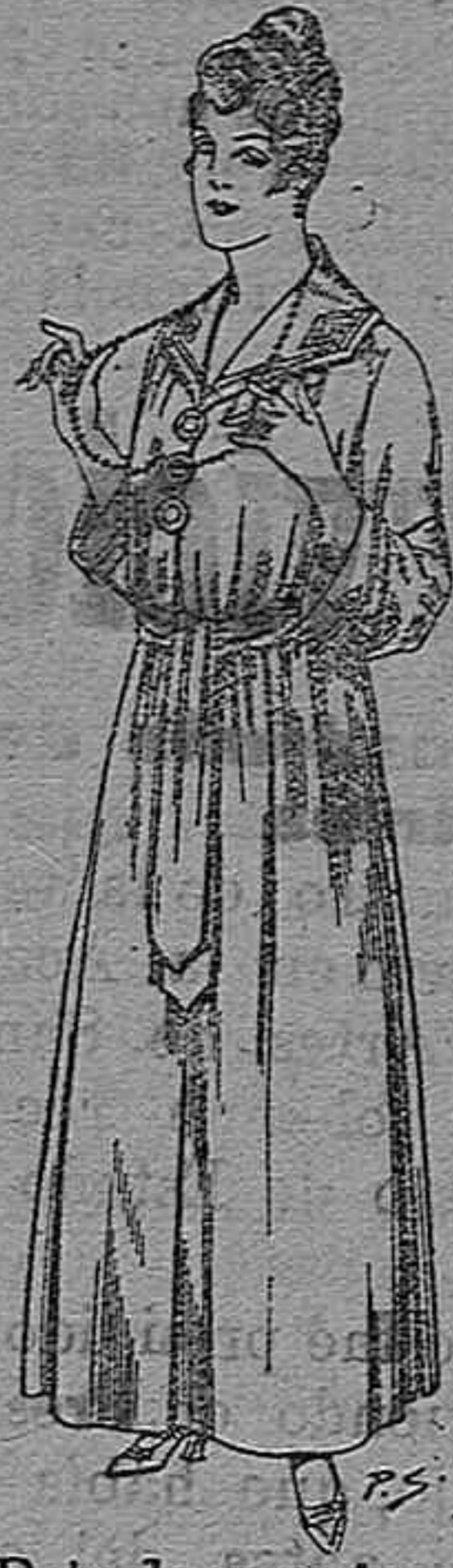
Bata de crepón color, cuello bordado De pesetas 6 á 11