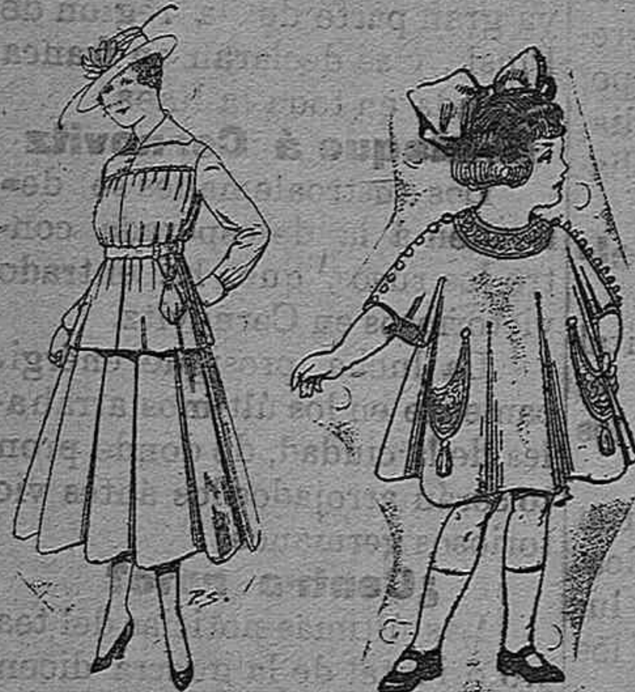
Trajes de lanilla Vestidos de lanilla para niñas de 4 á 9 años De pesetas 30 á 38