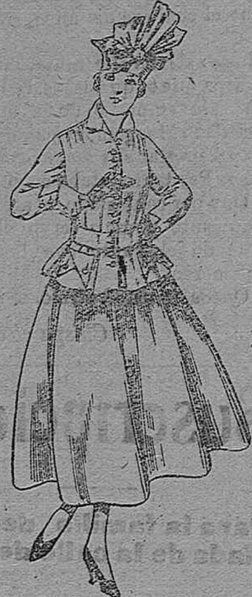
Trajes de lanilla negra, azul y color A pesetas 70