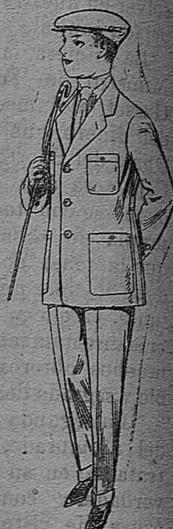
Trajes modelo Sport de dril listado para jovencitos de 10 á 16 años. De pesetas 11 á 17