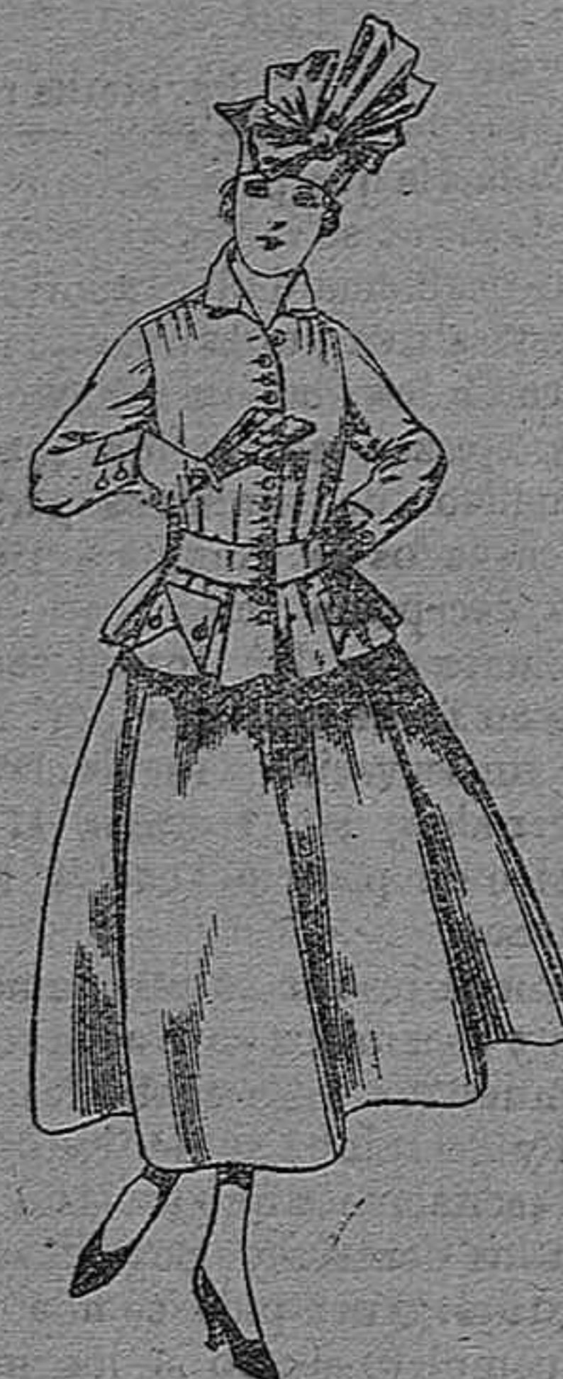
Trajes de lanilla negra, azul y color A pesetas 70