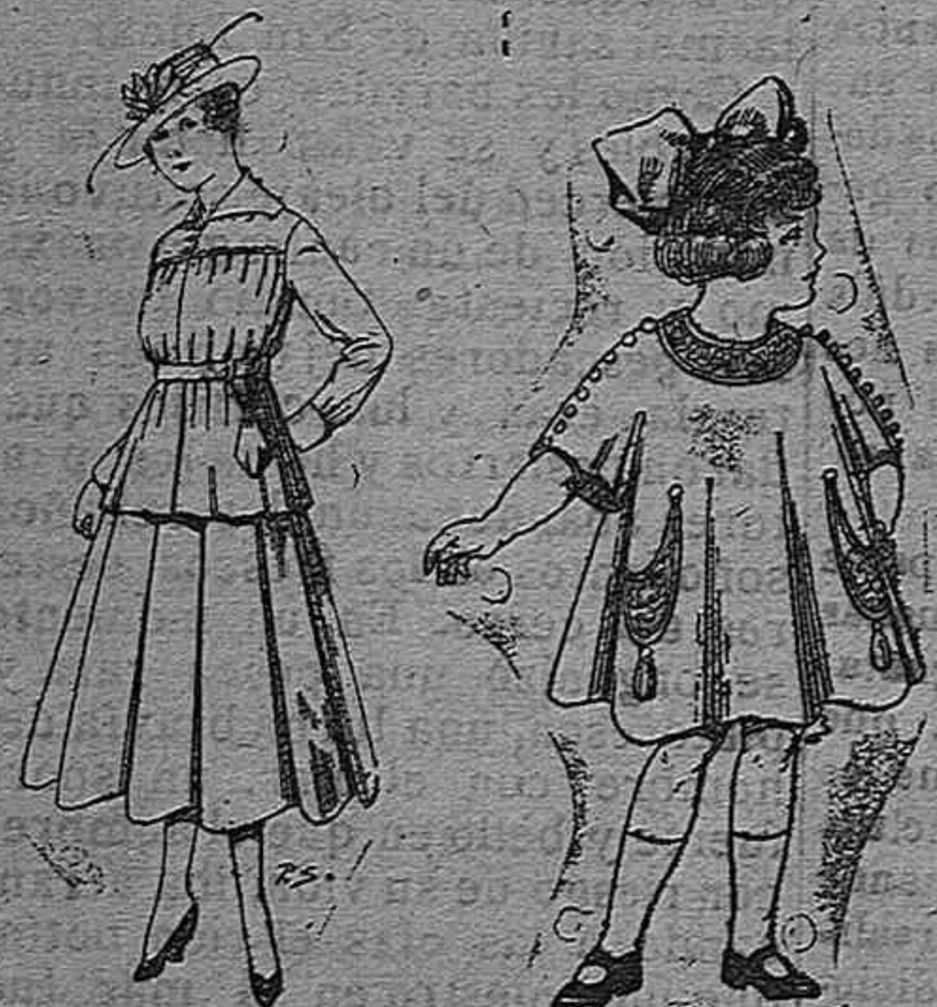
Trajes de lanilla Vestidos de lanilla para para jovencitas de niñas de 4 á 9 años 13 á 19. Pt. 50 á 55 De pesetas 30 á 38