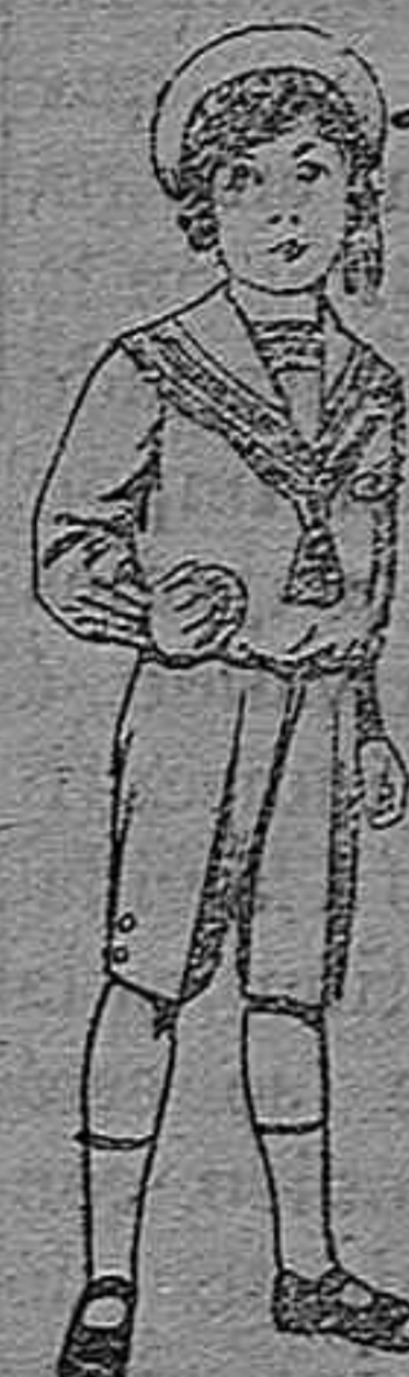
Trajes mari- nera de vicuña azul, para ni- ños de 4 á 9 años, Pt. 6 á 20