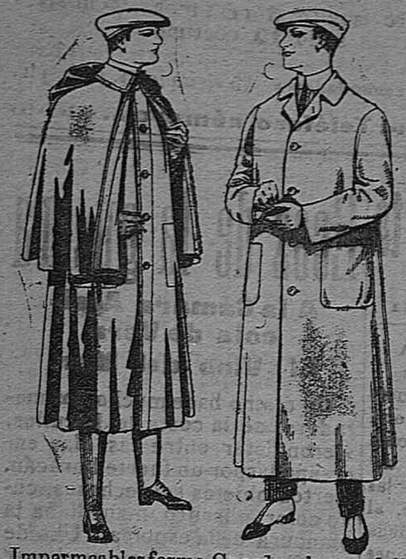
Impermeables forma Guardapolvos de dril mackferland en negro igual al modelo gro y azul De pesetas 55 á 100 De pesetas 6 á 11

Gran exposición de artículos para la temporada