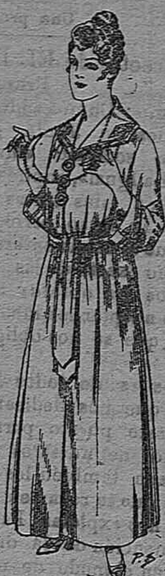
Bata de crepón co- lor, cuello bordado De pesetas 6 á 11