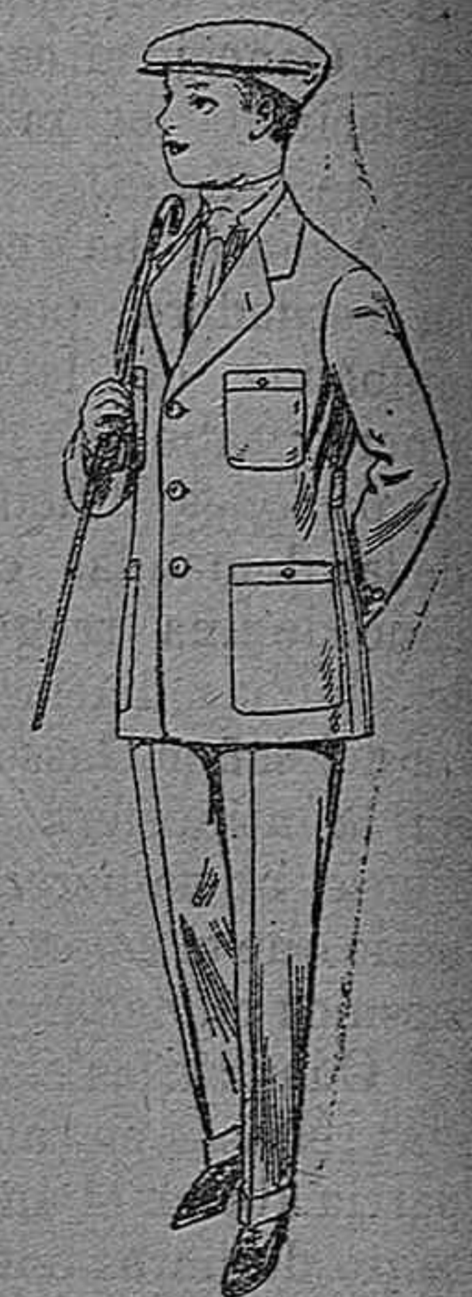
Trajes modelo Sport de dril listado para juvenitos de 10 á 16 años. De pesetas 11 á 17