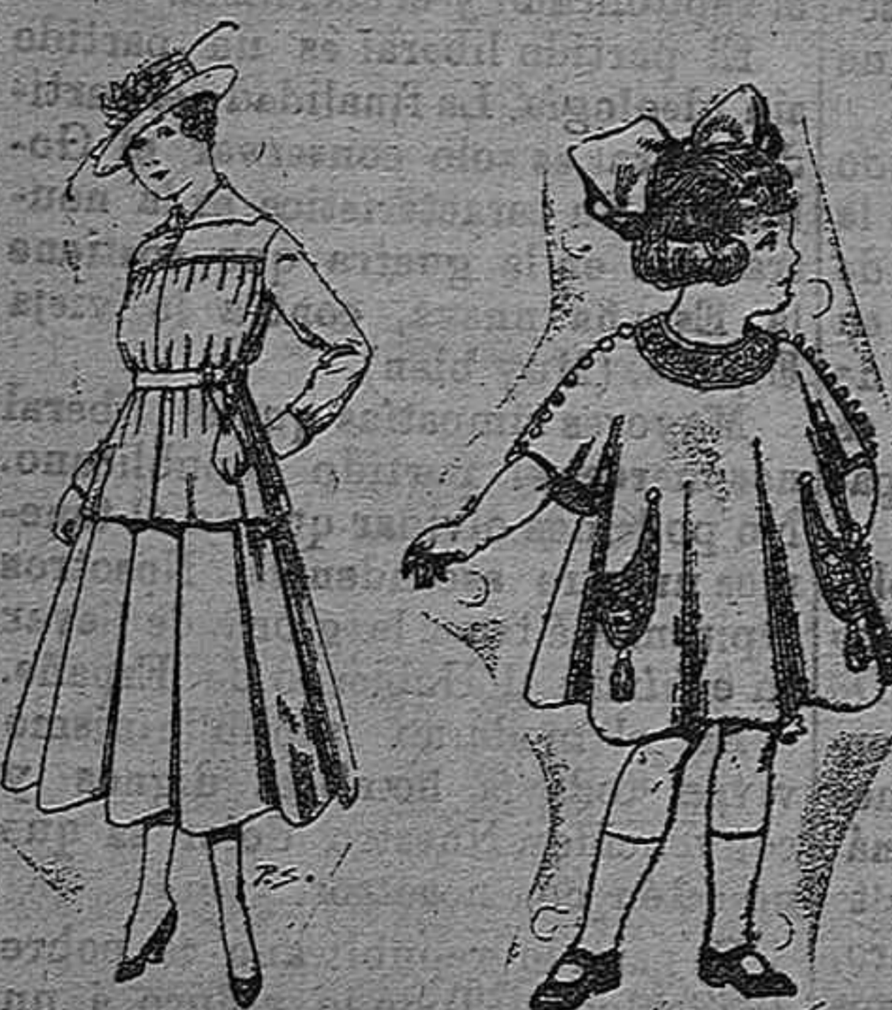
Trajes de lanilla Vestidos de lanilla para para juvenitas de niñas de 4 á 9 años 13 á 19. Pt. 50 á 55 De pesetas 30 á 38