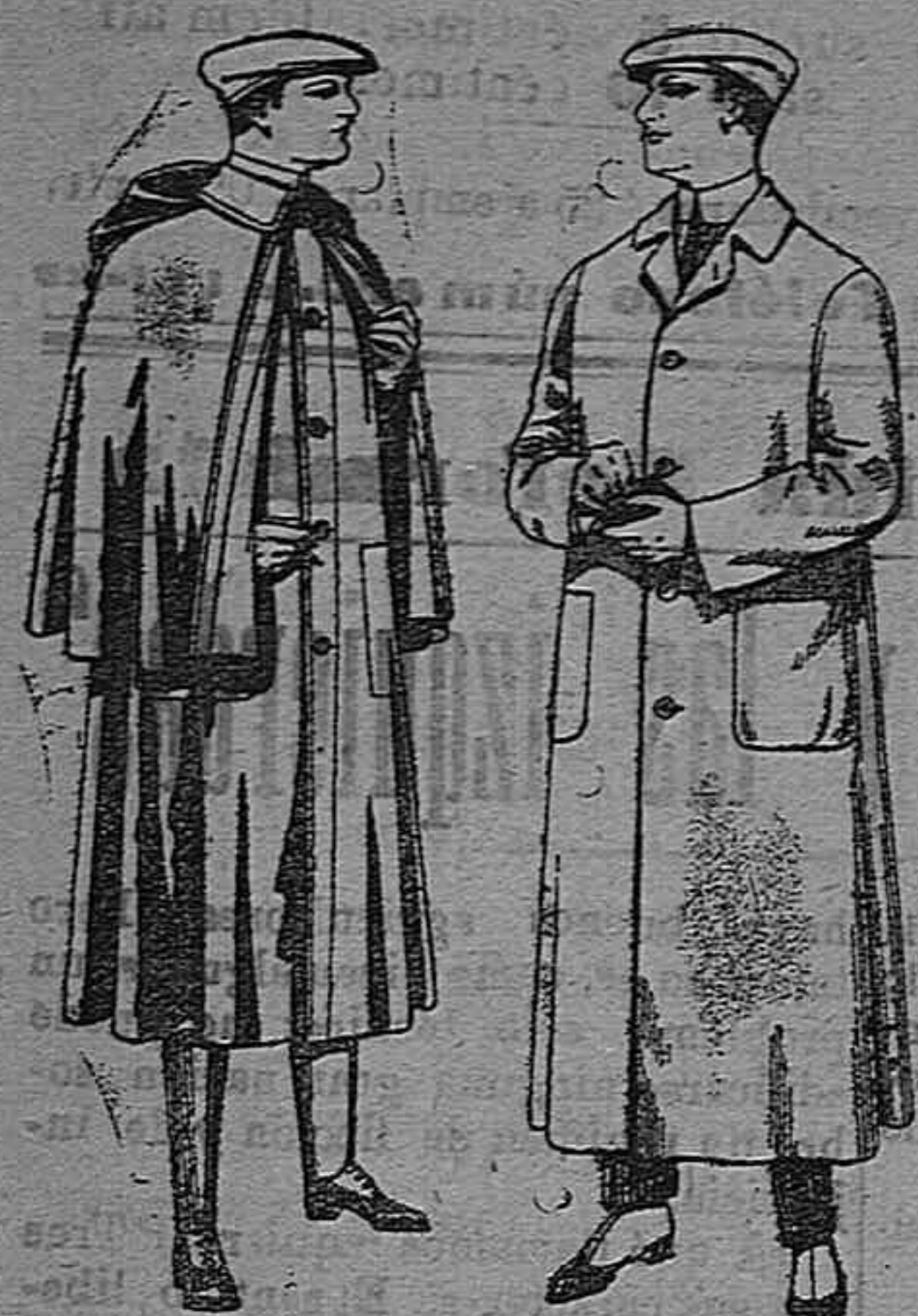
Impermeables forma Guardapolvos de dril mackrand en negro y azul De pesetas 55 á 100 De pesetas 6 á 11

Gran exposición de artículos para la temporada