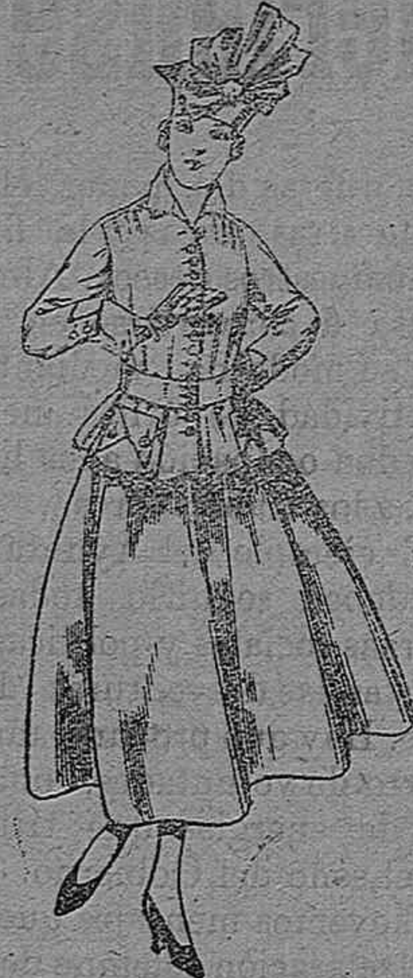
Trajes de lanilla negra, azul y color A pesetas 70