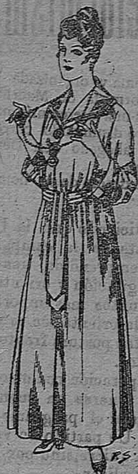
Bata de crepón color, cuello bordado De pesetas 6 á 11