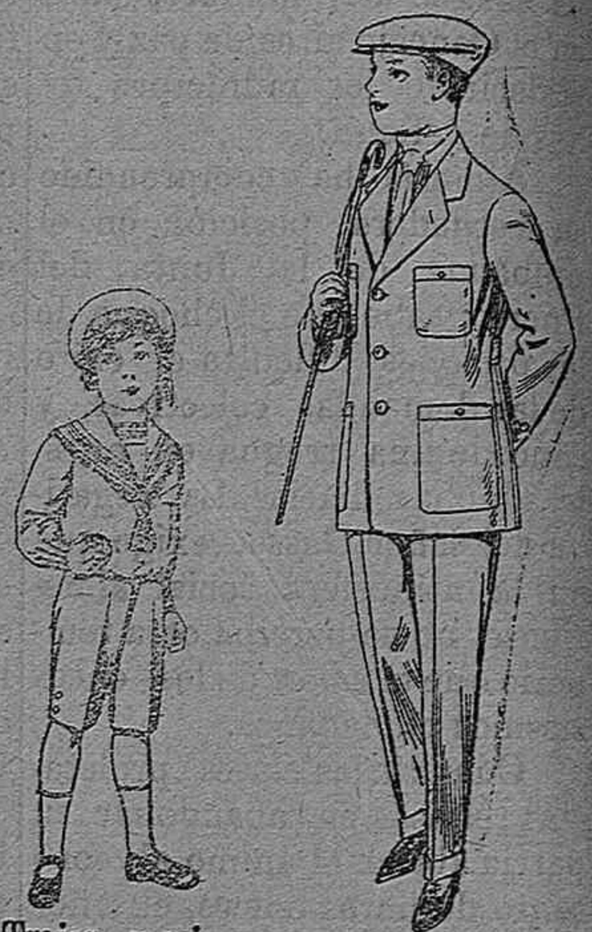
Trajes marinera de vicuña azul, para niños de 4 á 9 años. Pt. 6