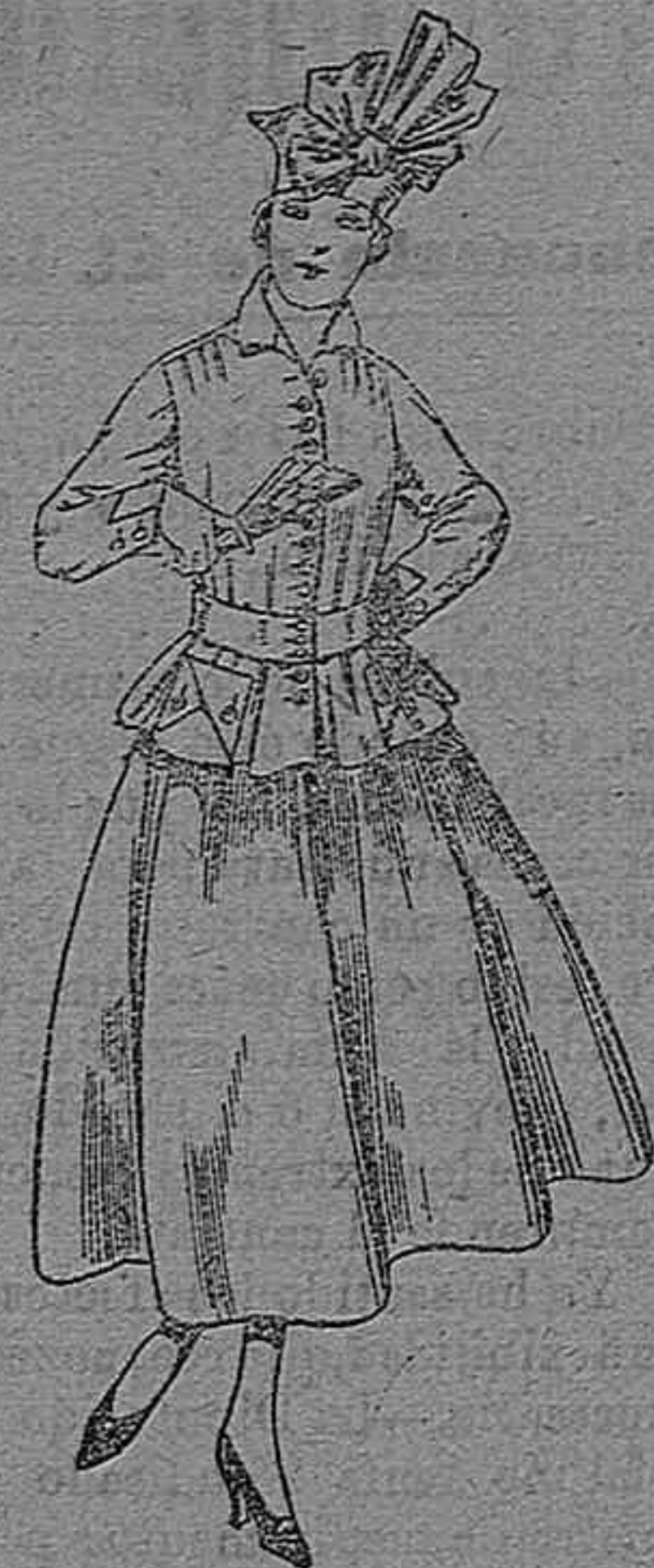
Trajes de lanilla negra, azul y color A pesetas 70