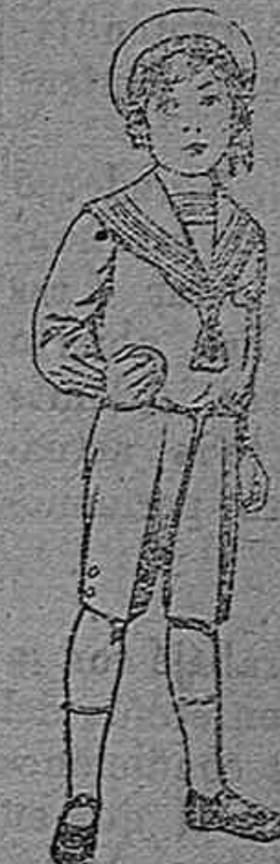
Trajes marinera de vicuña azul, para niños de 4 á 9 años. Pt. 6 á 20