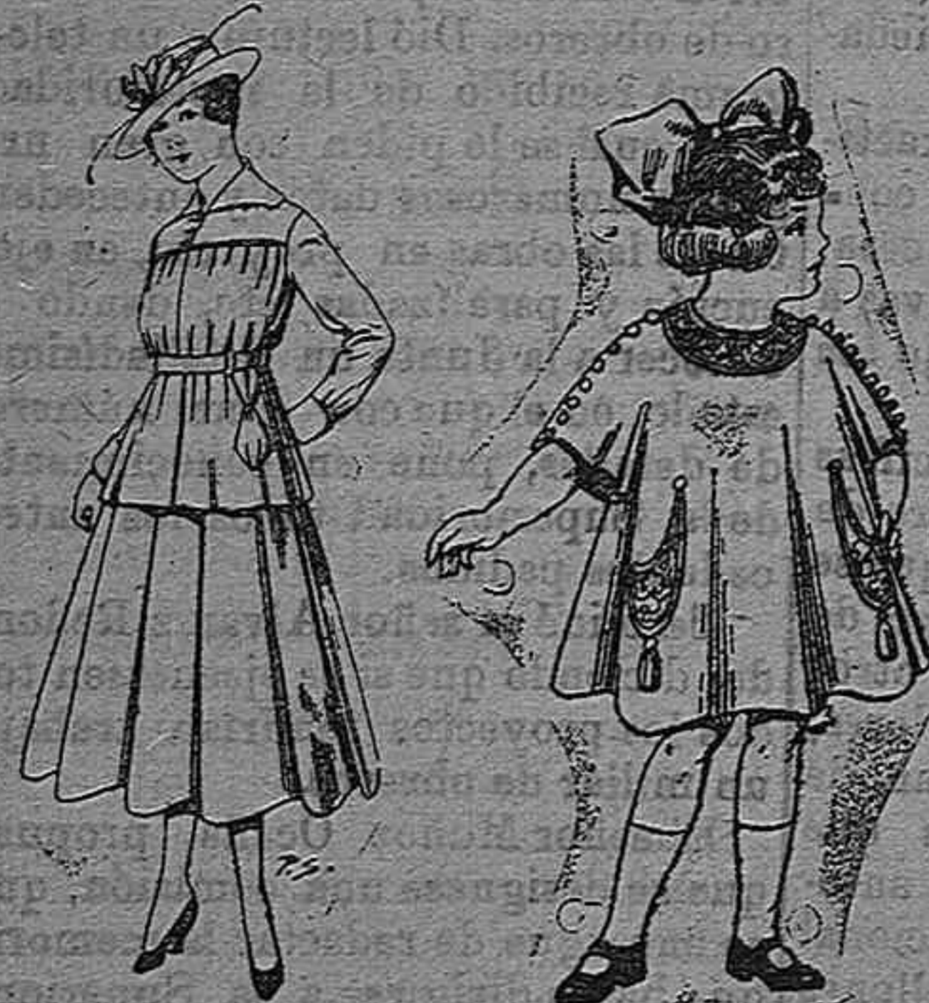
Trajes de lanilla Bestidos de lanilla para niñas de 4 á 9 años De pesetas 30 á 38