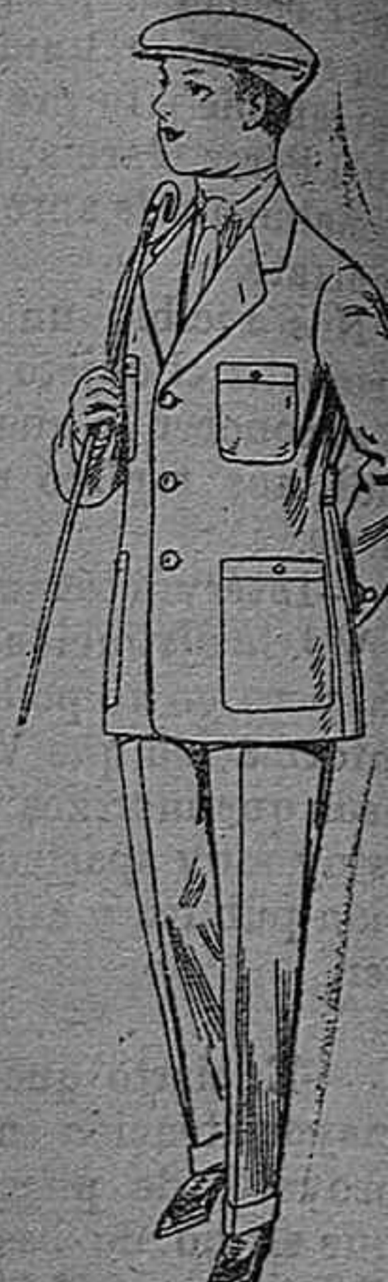
Trajes modelo Sp de dril listado para jovencitos de 10 años. De pesetas 11 á 15

CAMISERIA, GÉNEROS DE PUNTO, CORBATERIA,