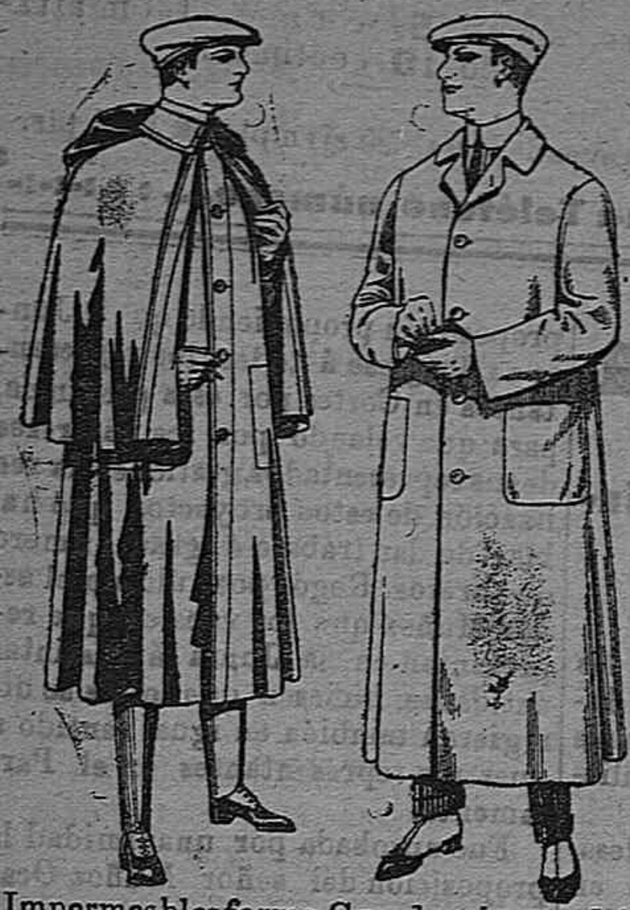
Impermeables forma Guardapolvos de dril mackferland en negro y azul De pesetas 55 á 100