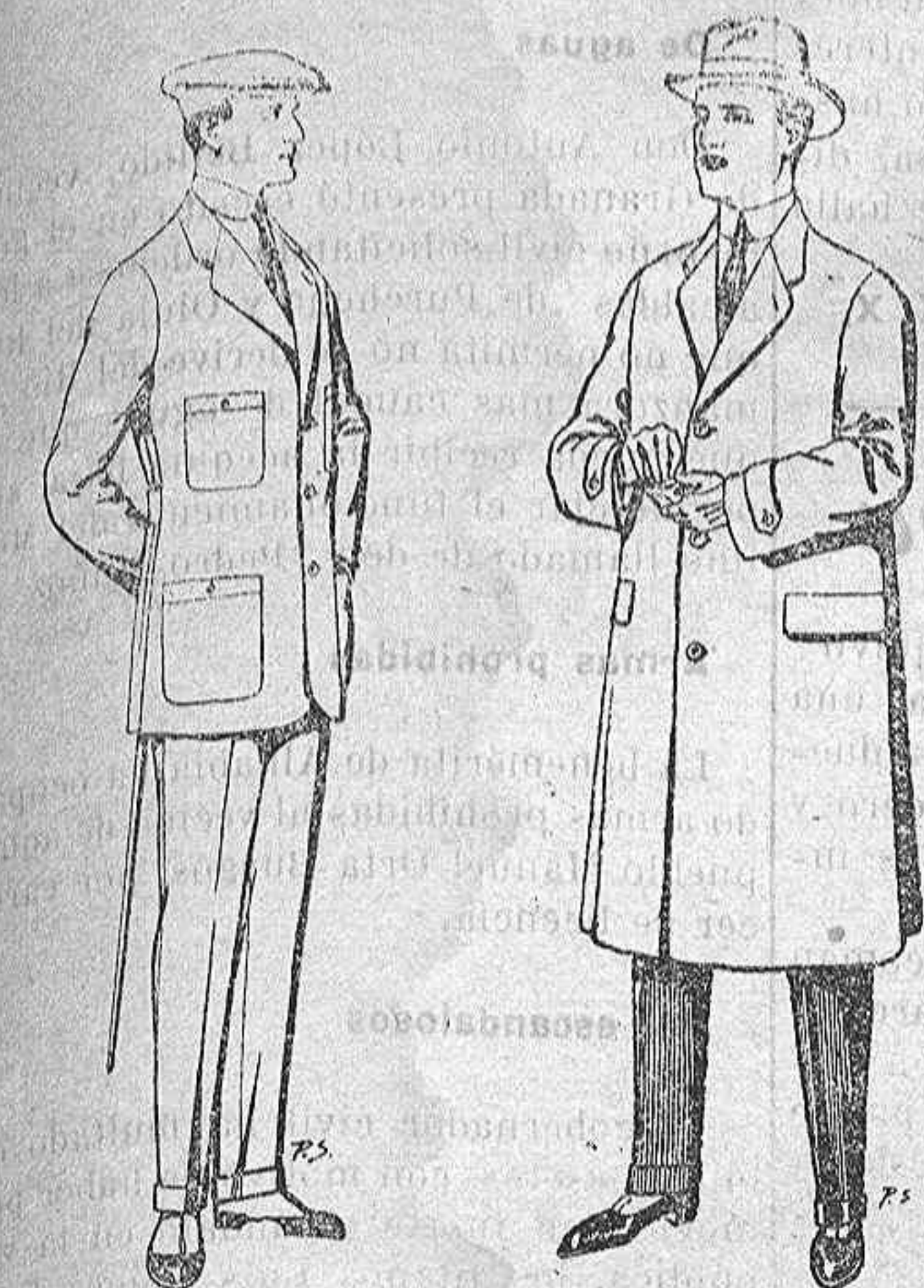
Trajes cheviot corte elegante para «Sport- men». De pts. 45 á 55 Gabanes en tegi- los pluma, ratina, etc. De pts. 30 á 100.

Gran exposición de artículos de la temporada