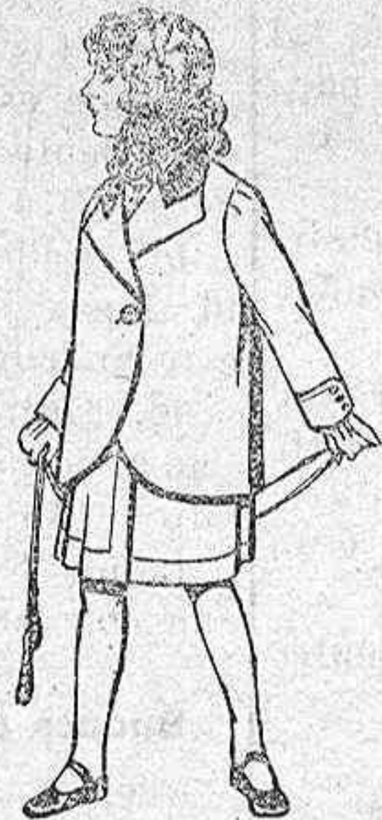
Trajes de lana para jovencitas de 13 á 16 años. De pts. 40 á 45 Trajes de lanilla para niñas de 4 á 12 años. De pts. 14 á 22