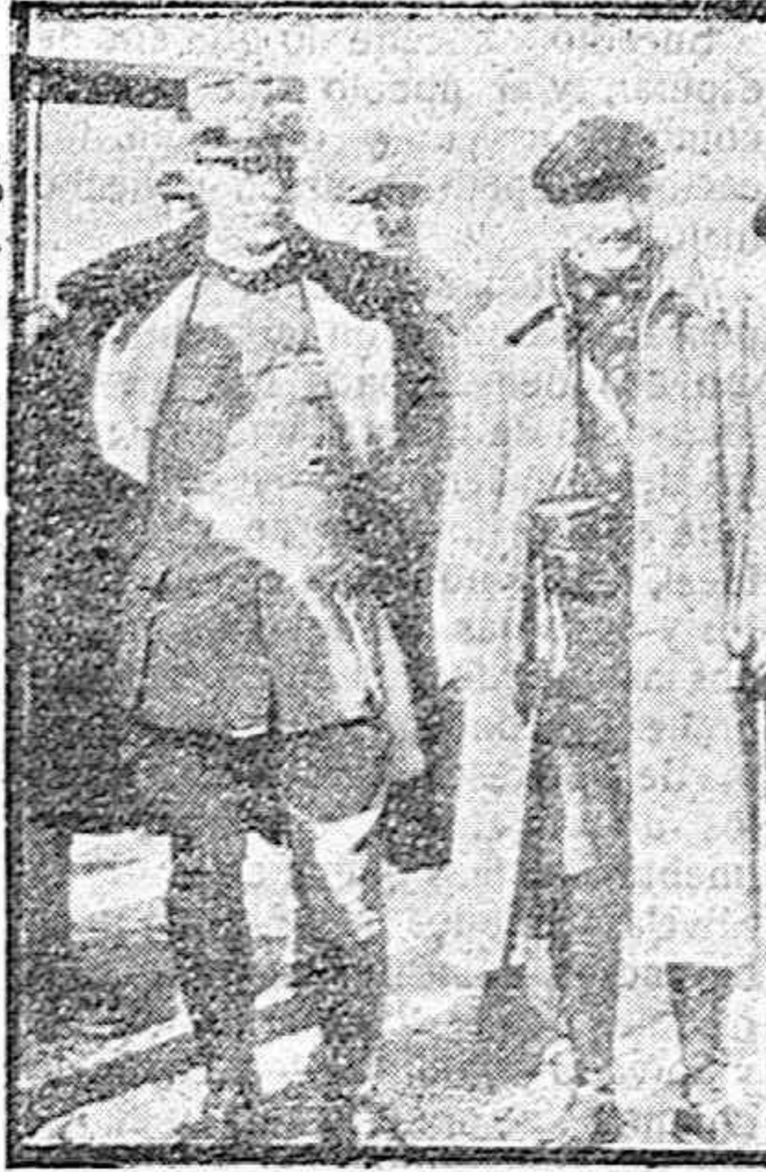
EL GENERAL PEPPINO GARIBALDI

Al Gobernador nos dirigimos para que, como nuestra petición es justa, ordene sean facilitados esos partes; porque de otro modo vamos a creer que hay interés en ocultar, lo que debe estar CLARITO. Esperamos la actuación del Gobernador.