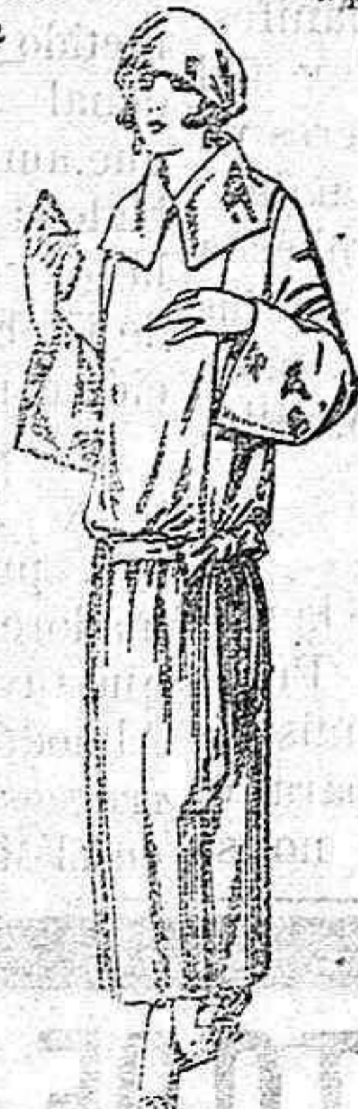
Guardapolvos de dril crudo, gris, beig, etc. de ptas. 18 a 25