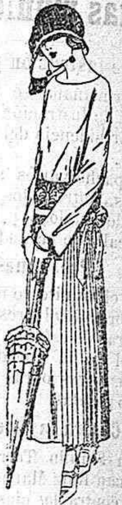
Vestidos de sarga inglesa, popeline, etc., en negro azul y color, adornos bordados a mano a ptas. 110