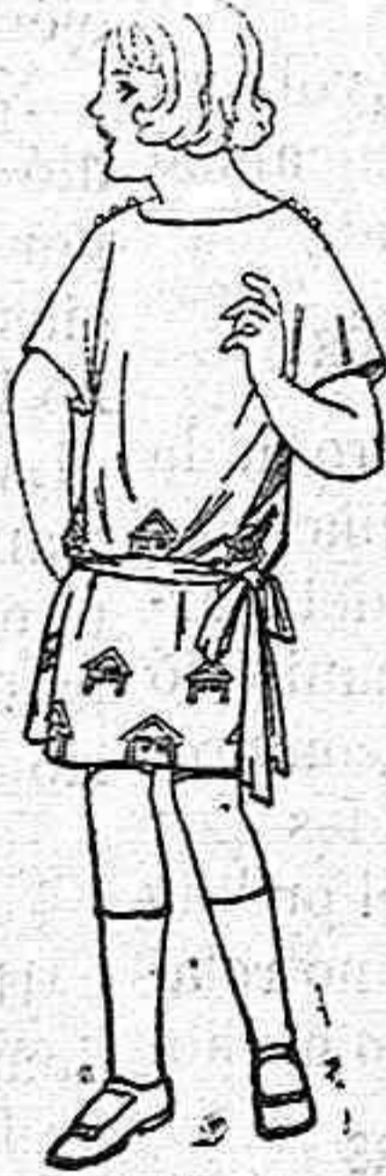
Vestidos popeline, sarga inglesa, etc., adornos bordados para niñas de 4 a 9 años. de ptas. 30 a 35