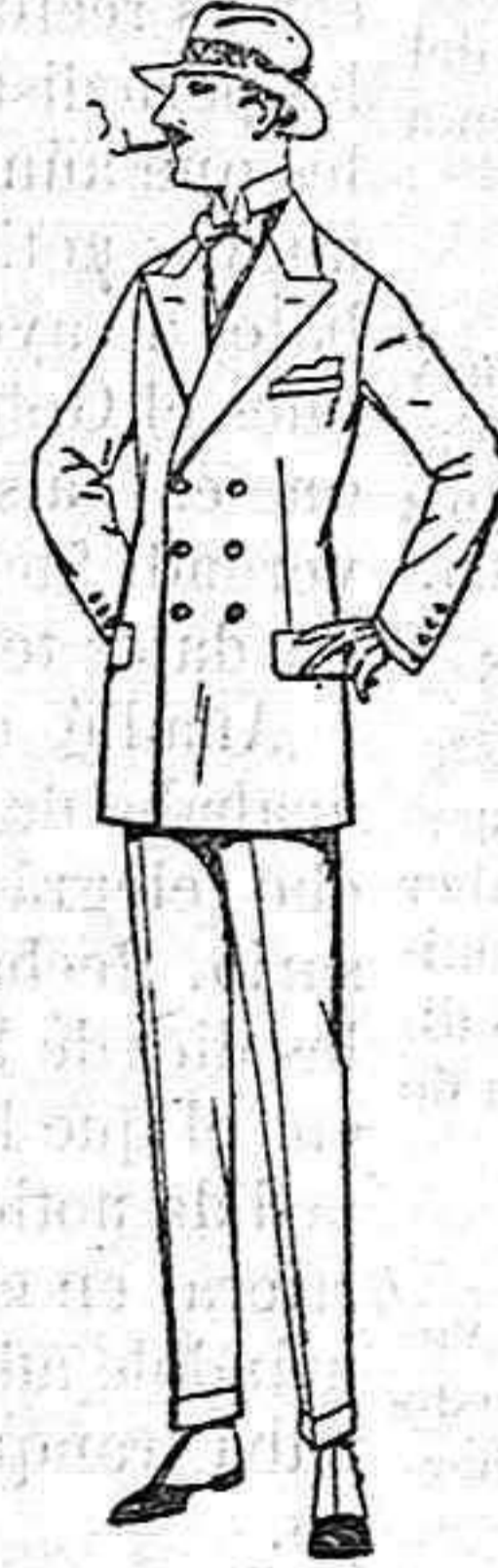
Trajes de lanilla, meltón, estambre, vicuña o jerga de ptas. 40 a 140