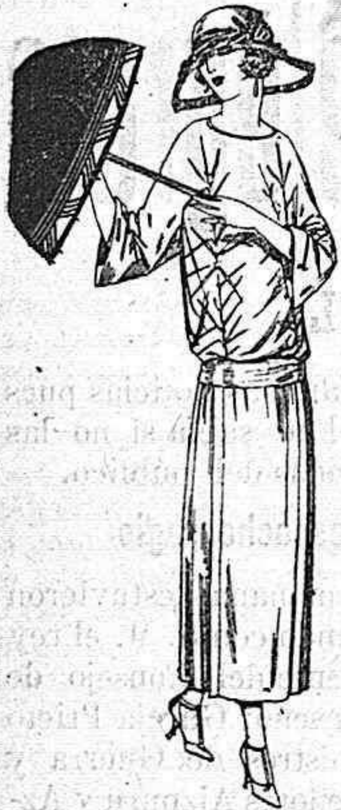
Vestidos de tricot de seda, en negro, azul y colores moda, adornos bordados. a ptas. 115

SUCURSALES: Madrid, Barcelona, Alicante, Bilbao, Cádiz, Cartagena, Gijón, Granada, Málaga, Palma de Mallorca, Santander, Sevilla, Valencia, Valladolid, Zaragoza,