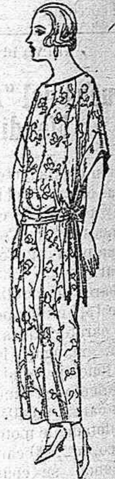
Batas de crespón, en negro colores, adornos bordados de ptas. 32 a 38

Boás, camisería, géneros de punto, corbatería, guantería, sombrerería, zapatería, paraguas, bastones, sombrillas y artículos de viaje