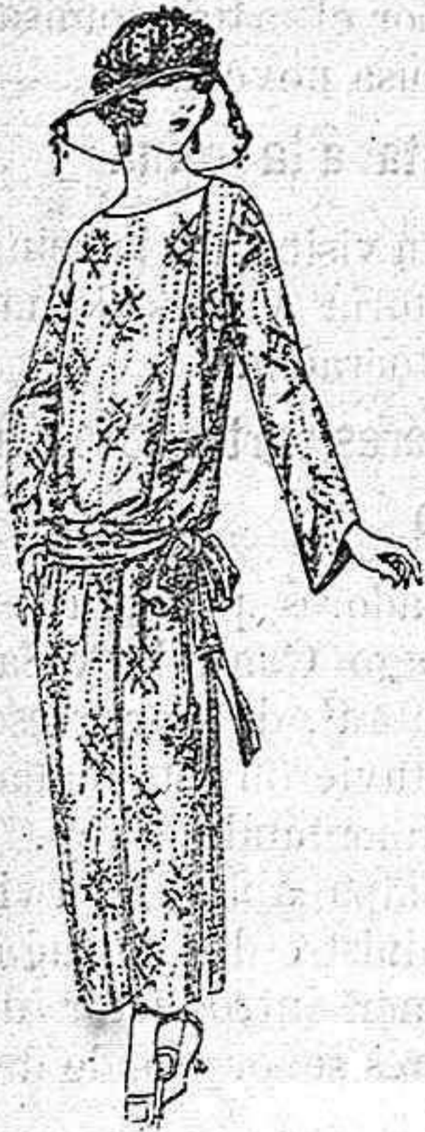
Vestidos de velo de algodón, dibujos novedad a ptas. 50

Ropas confeccionadas para caballero, señora, niño y niña