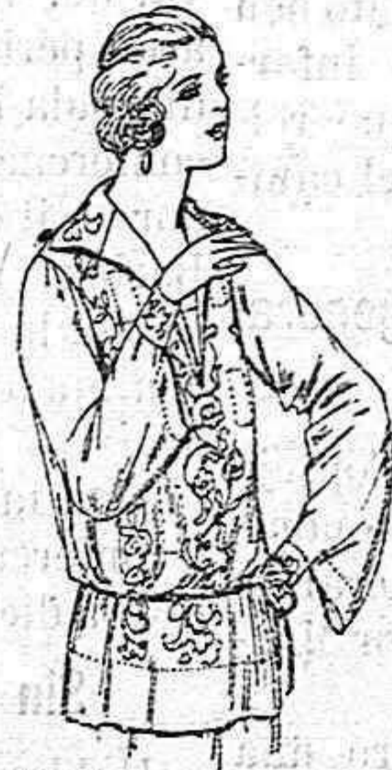
Blusas de voi e de seda, en negro y blanco, adornos bordados. a ptas. 22