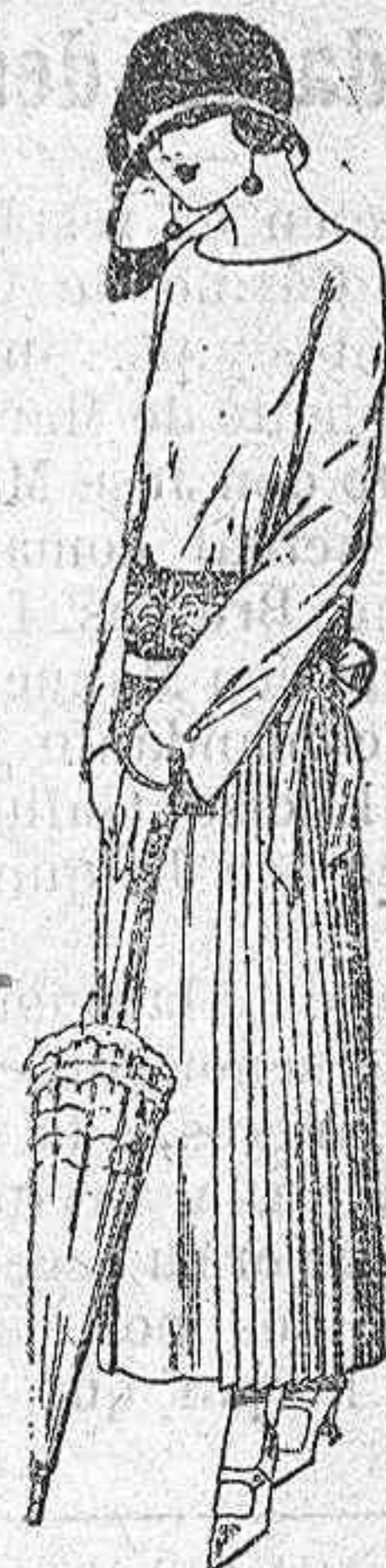
Vestidos de sarga inglesa, popeline, etc., en negro, azul y color, adornos bordados a mano a ptas. 110