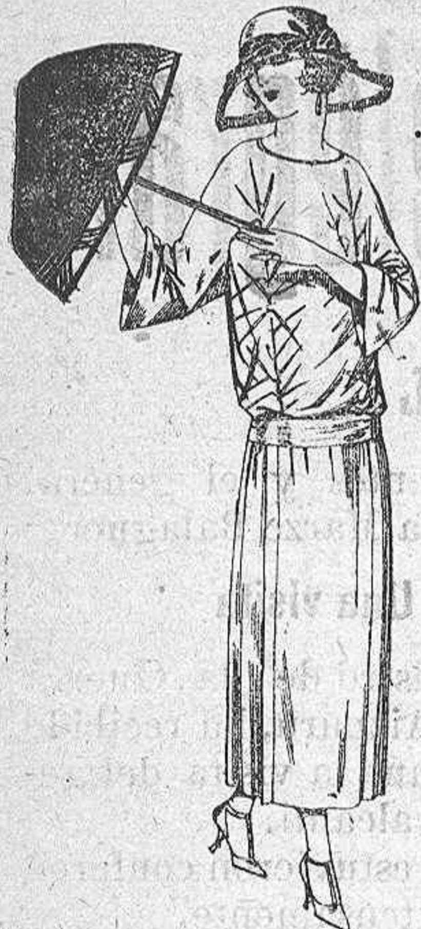
Vestidos de tricot de seda, en negro, azul y colores moda, adornos bordados a ptas. 115

SUCURSALES: Madrid, Barcelona, Alicante, Bilbao, Cádiz, Cartagena, Gijón, Granada, Málaga, Palma de Mallorca, Santander, Sevilla, Valencia, Valladolid, Zaragoza