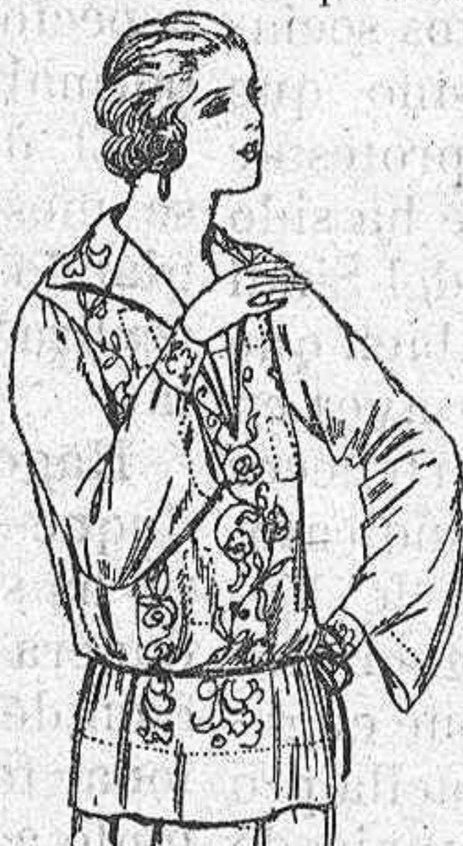
Blusas de voile de seda, en negro y blanco, adornos bordados a ptas. 22