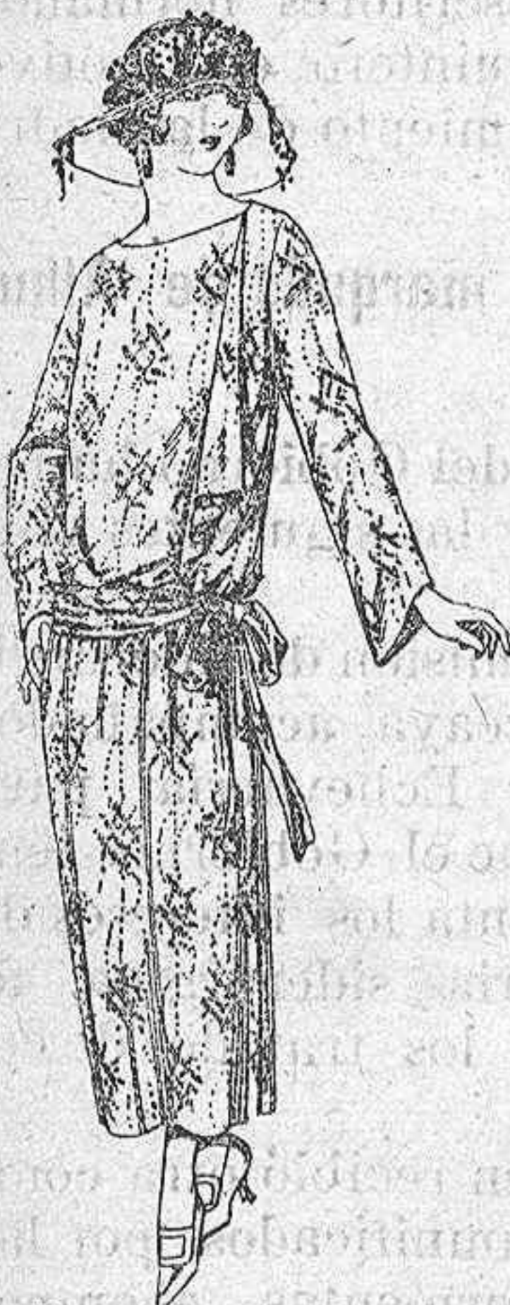
Vestidos de velo de algodón, dibujos novedad a ptas. 50