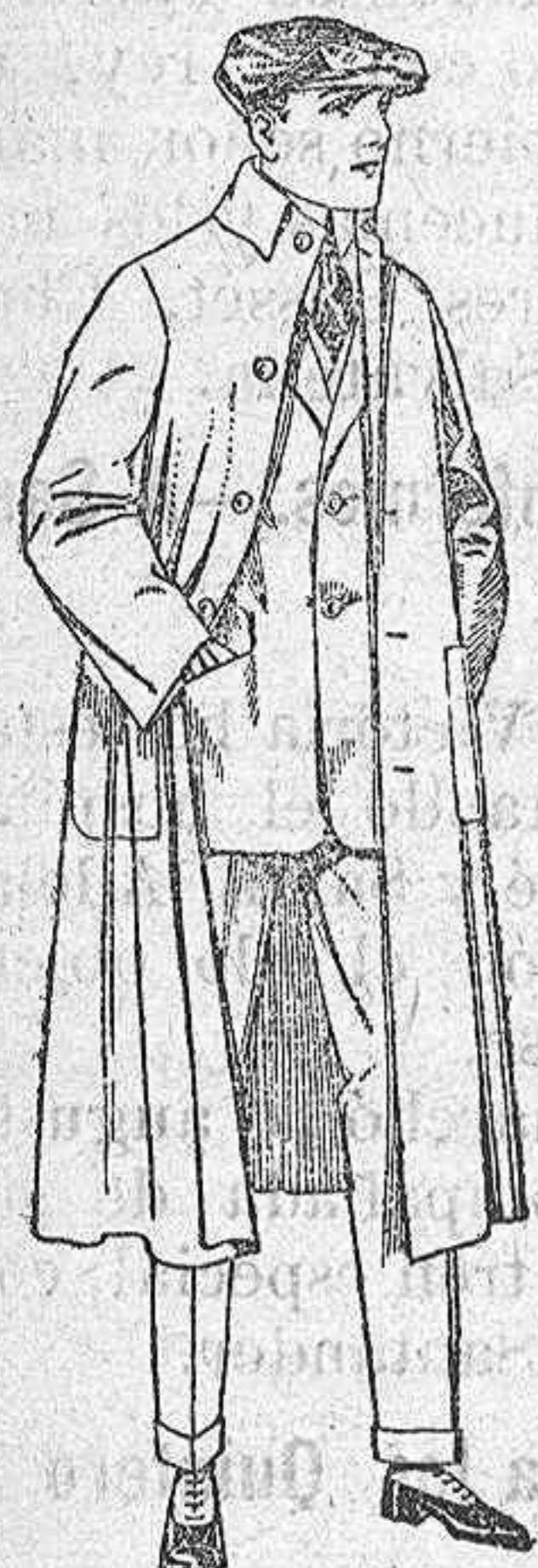
Guardapolvos de dril, igual al modelo de ptas. 12 a 20