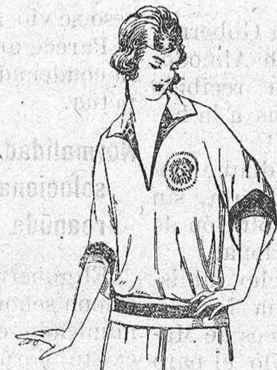
Blusas tricot de seda, en negro y colores moda a ptas. 39