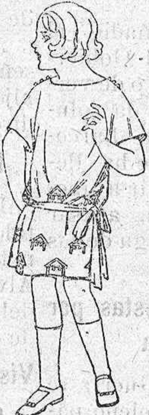
Vestidos popeline, sarga inglesa, etc. adornos bordados, para niñas de 4 a 9 años. de ptas. 30 a 35