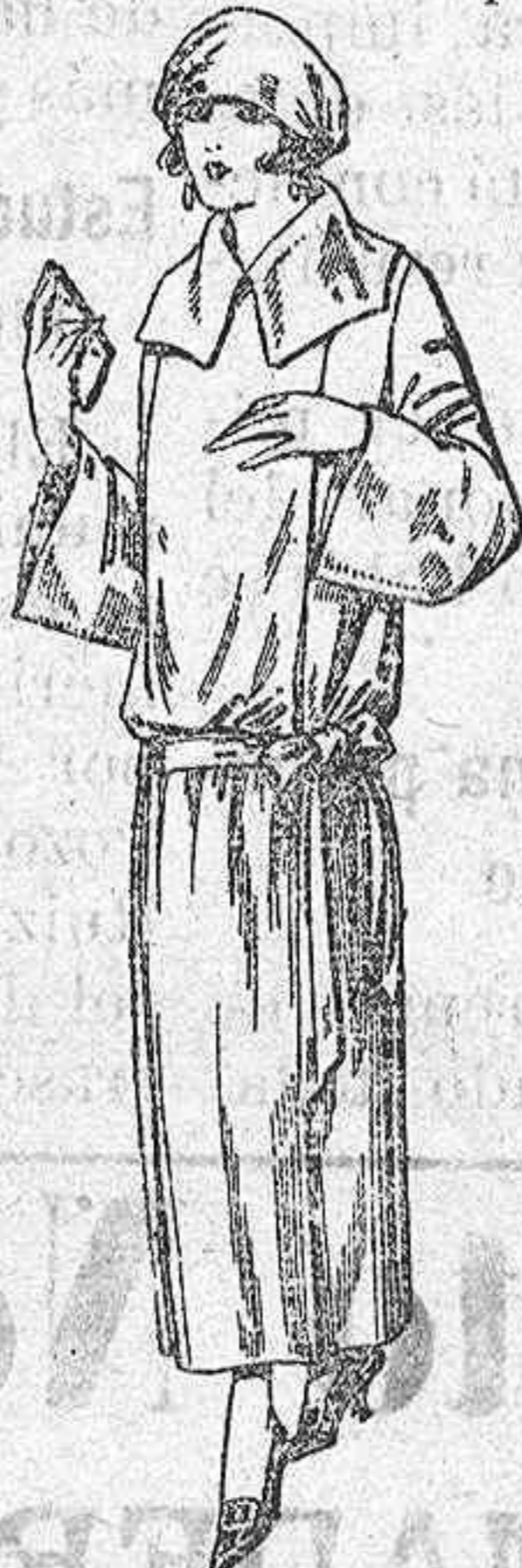
Guardapolvos de dril crudo, gris, beige, etc. de ptas. 18 a 25