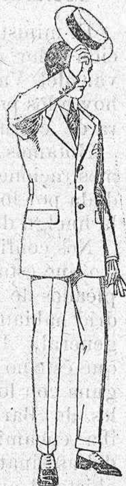
Trajes modelo Sport, de lanilla, meltón, etc. de ptas. 75 a 100