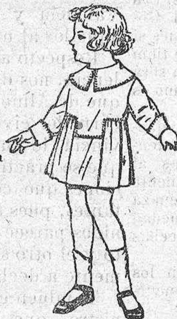
Vestidos batista blanca, pespuntes de adorna para niñas de 3 a 6 años de ptas. 5'50 a 6'50