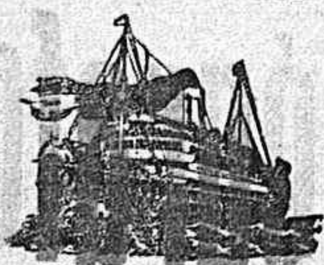
El correobrasat ántico