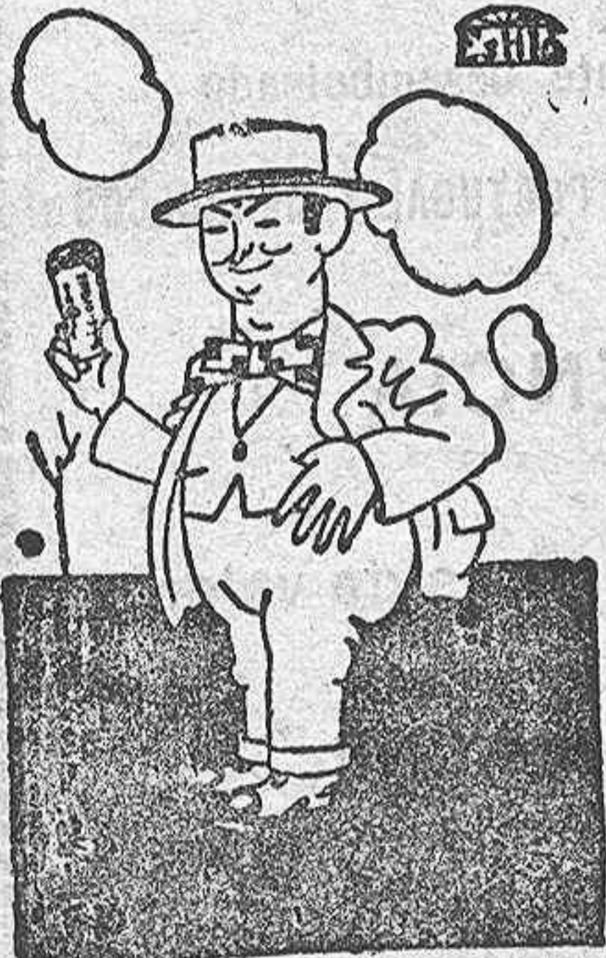
Ya es fama que el INDIO ROSA es hoy el mejor papel donde se halla un fumador va acompañado de él.