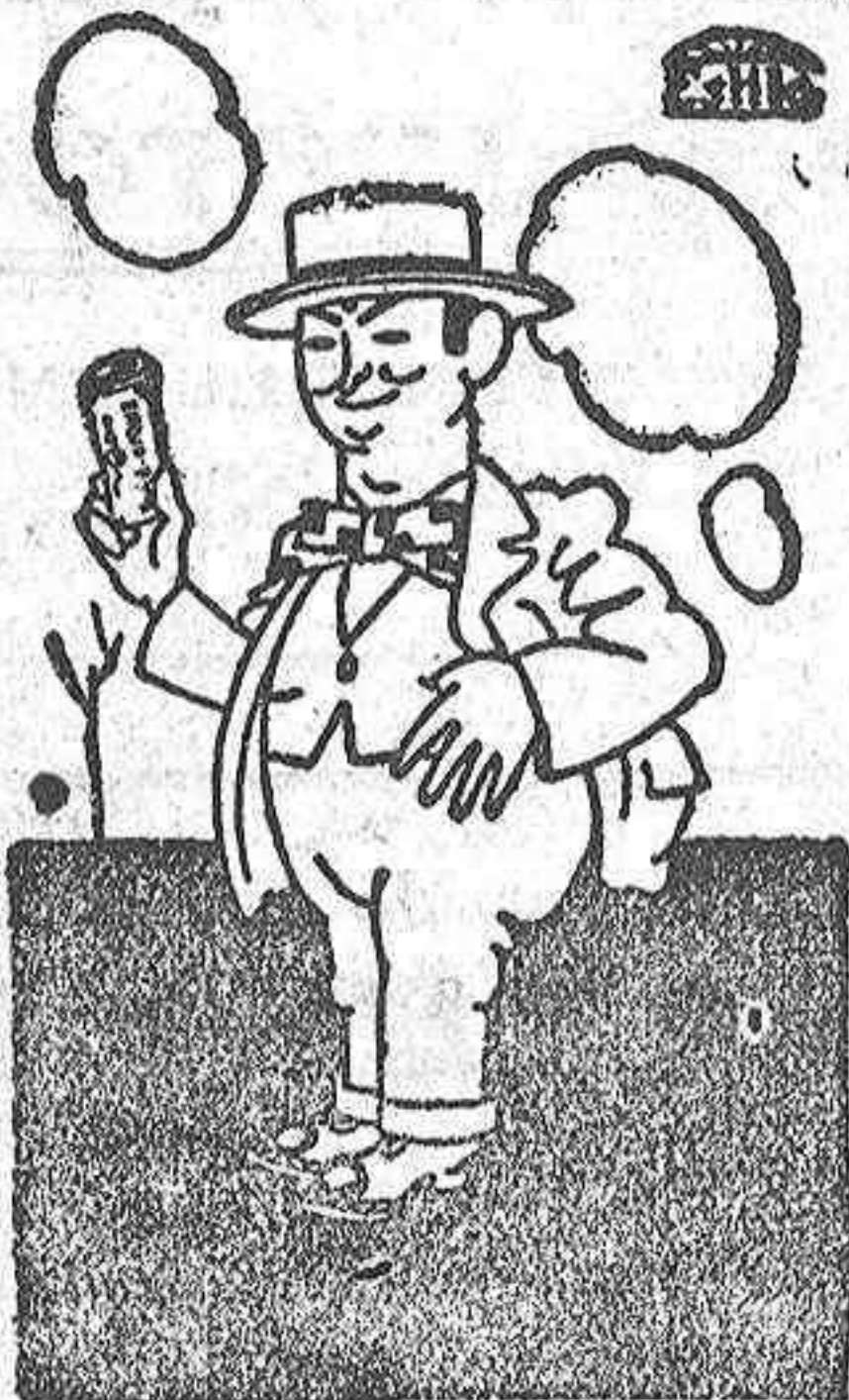
Ya es fama que el INDIO ROSA es hoy el mejor papel donde se halla un fumador va acompañado de él.

También en el magnífico salón se organizará un baile, que será amenizado por la orquesta que allí actúa con el beneplácito de la numerosa concurrencia.