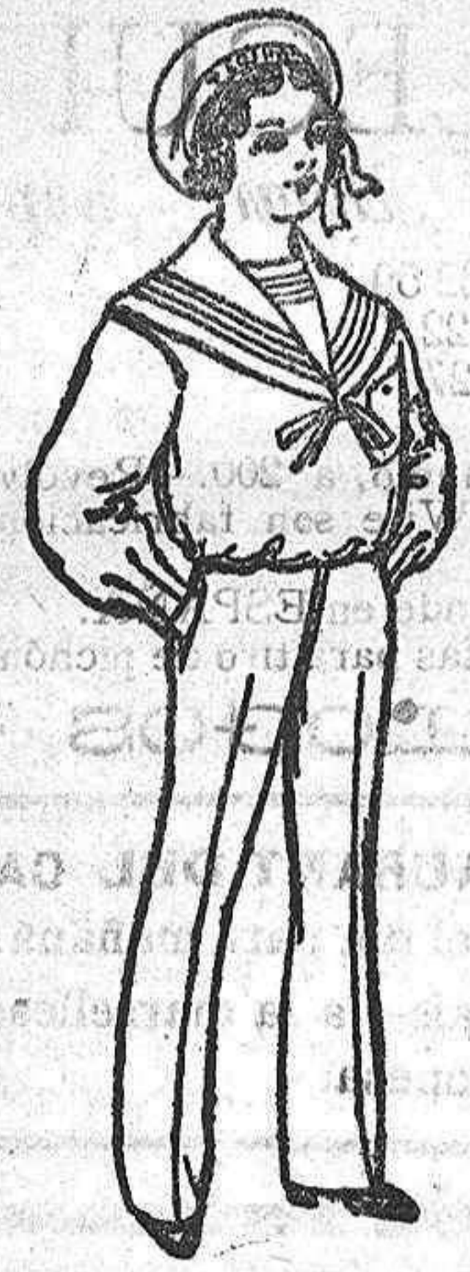
Traje dril blanco para niño de 4 a 10 años de pesetas 14 á 24