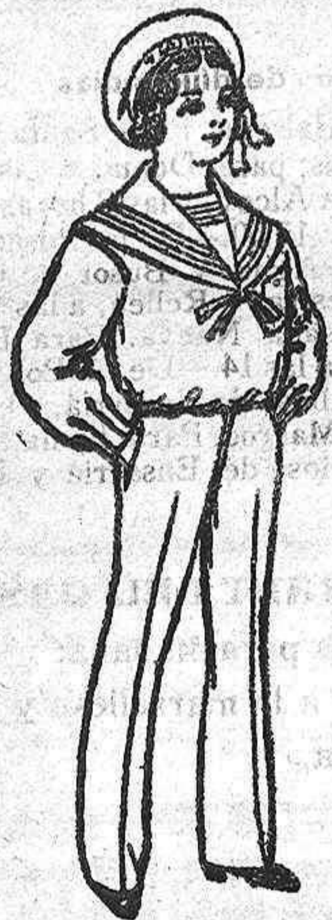
Traje dril blanco para niño de 4 a 10 años De Pesetas 14 á 24