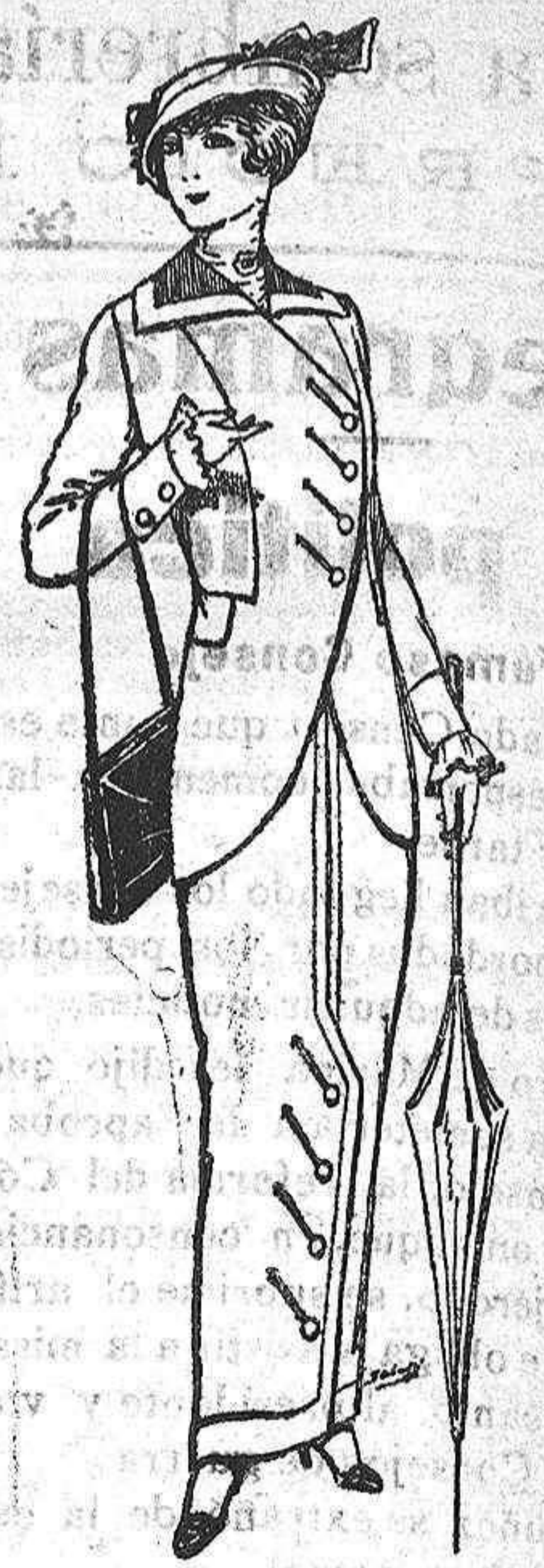
Traje jerga para Señora, á Ptas. 50 y 53