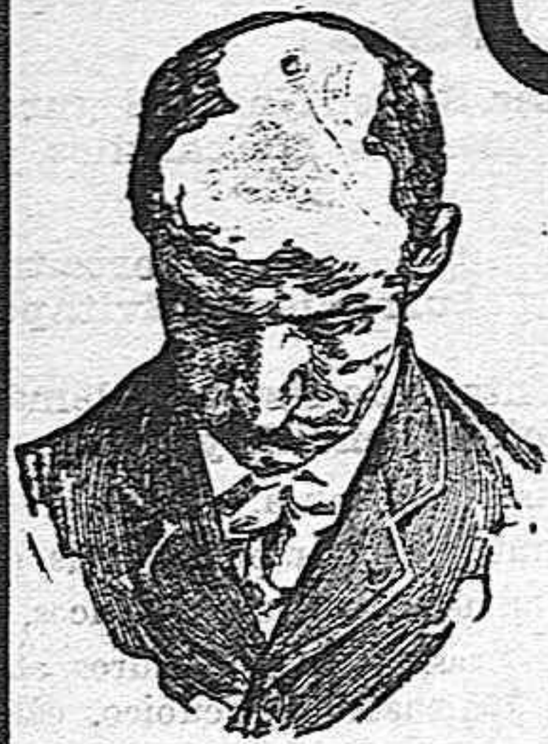
Antes de usar el Capilhol