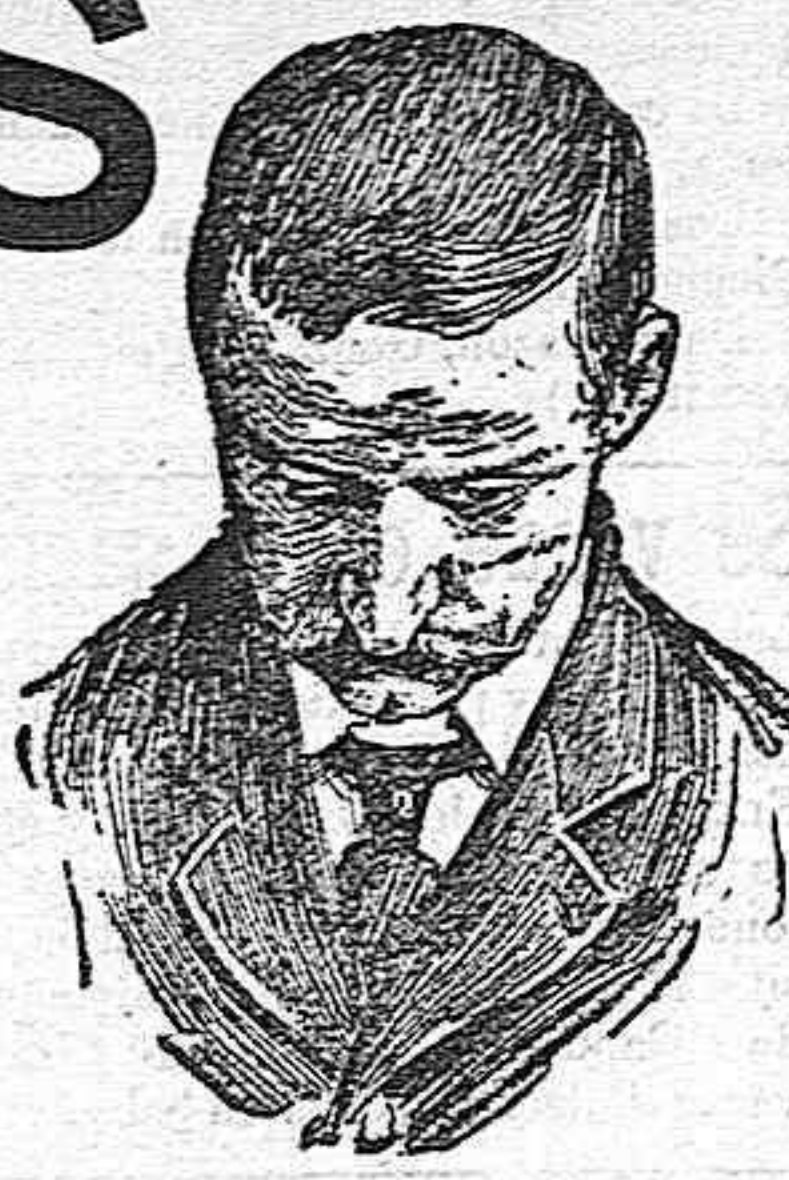
Después de usar el Capilhol

usando el Capilhol se obtiene la curación de toda clase de calvicies. Robustece el cabello y su raíz; limpia y perfuma la cabeza é impide la caída del cabello.