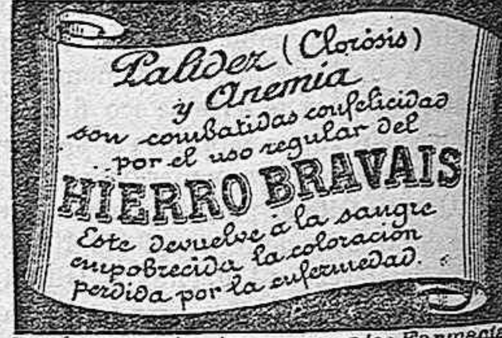
Depósito en todas las principales Farmacias

La gravedad es una invencion para esconder la falta del talento.