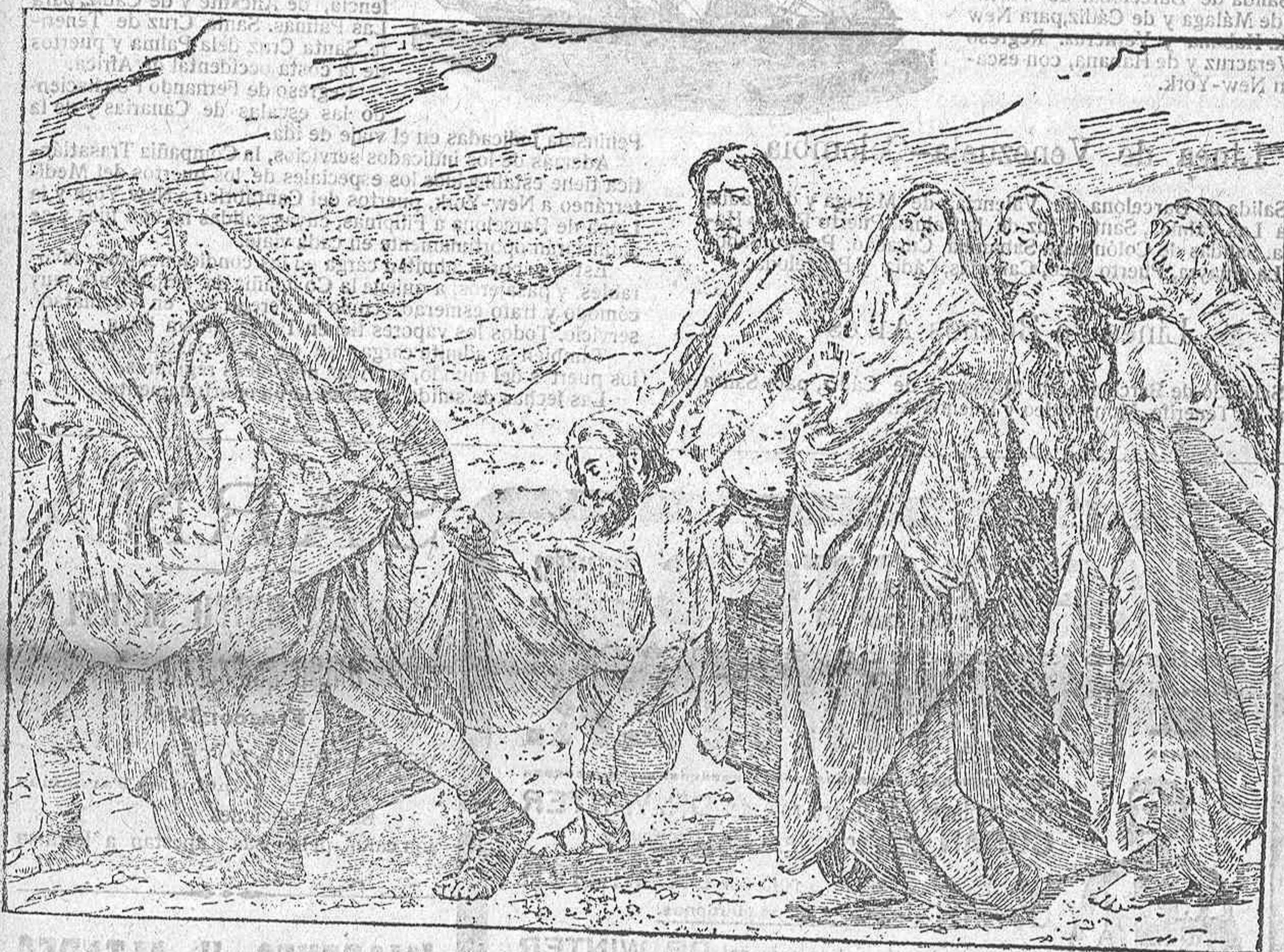
Entierro de Jesús

Redacción, Administración e Imprenta : "Artes Gráficas" : Plaza de Topete, 1 Teléfono 80 : No se devuelven originales.