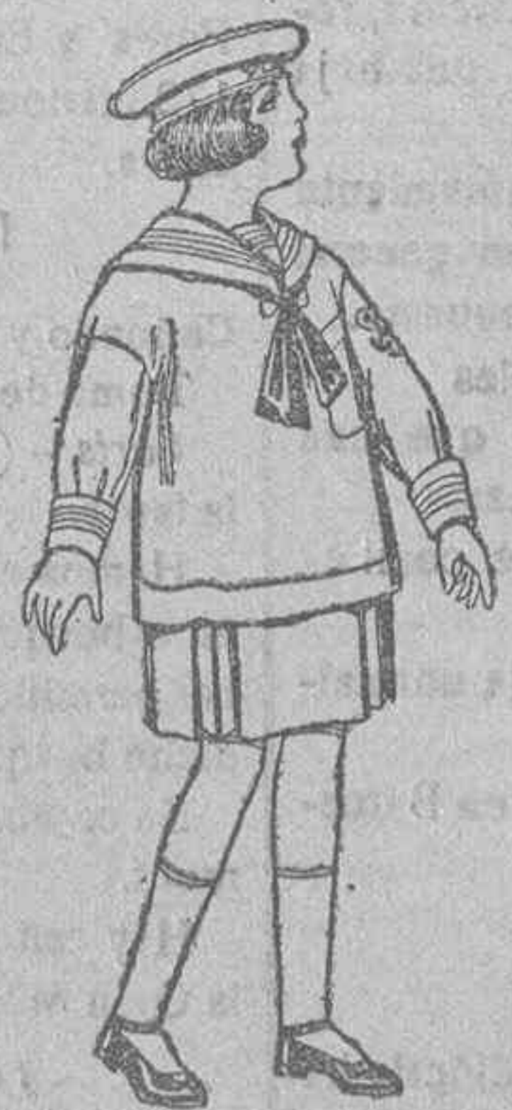
Trajes de marinera de sarga inglesa para niños de 4 a 9 años de ptas. 35 a 43