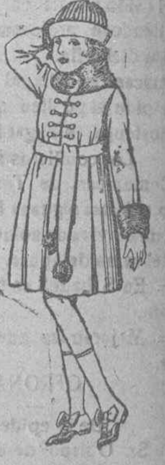
Abrigos de cheviot, pañete, etc., color, cuello y bocamangas piel, para niñas de 7 a 15 años de ptas. 46 a 49

Precio fijo.-Ventas al contado.-----Pídase el Catálogo general