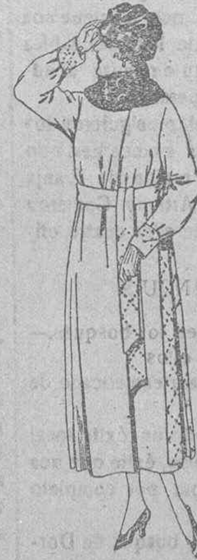
Abrigos de pañete, gamuza, etc., en negro, azul y color, cuello piel de ptas. 100 a 120

Camisería, Géneros de punto, Corbatería, Guantería, Sombrerería, Zapatería, Bastones y Artículos de Viaje.