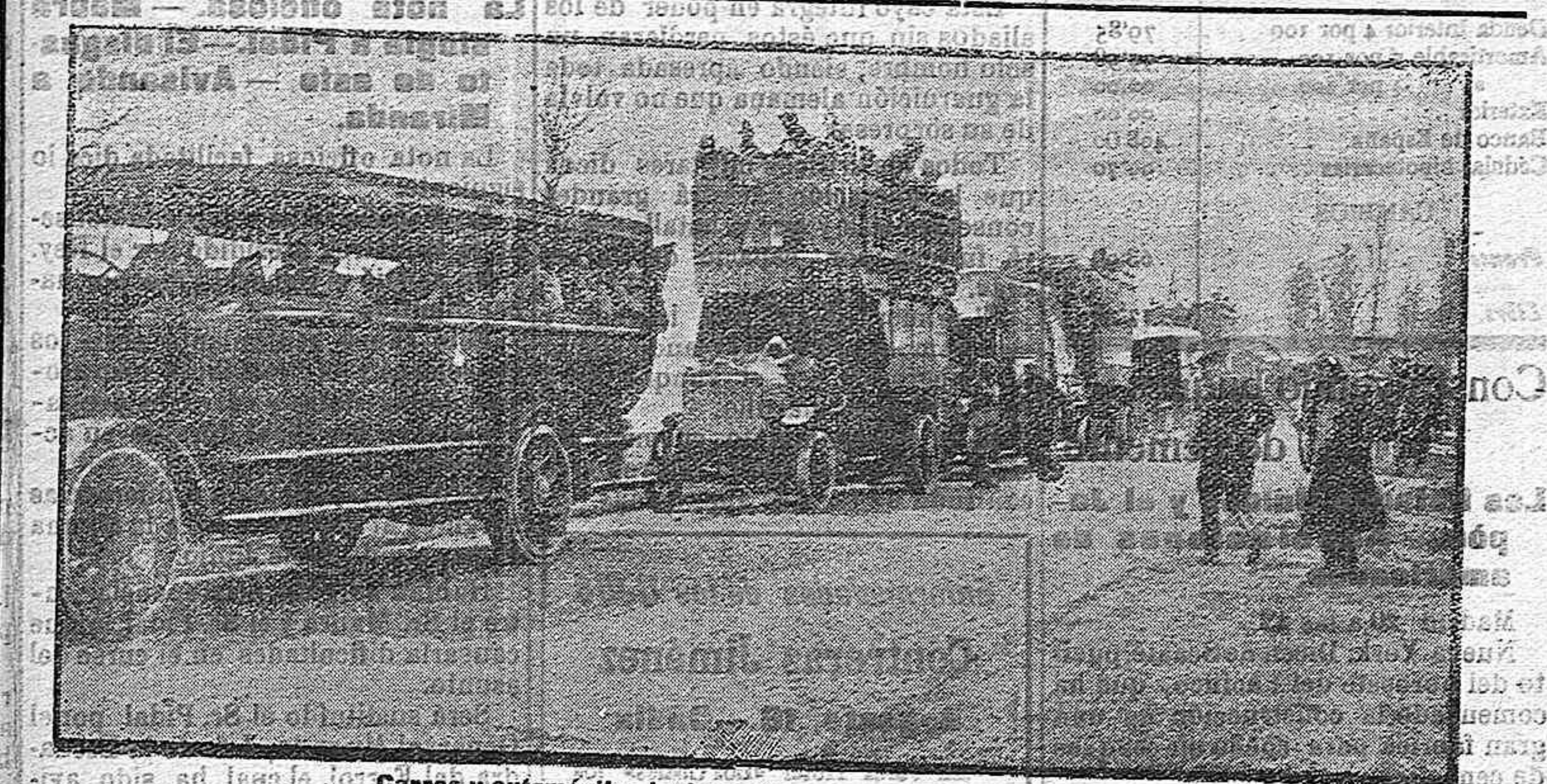
Carrés y automóviles ingleses transportando tropas francesas.