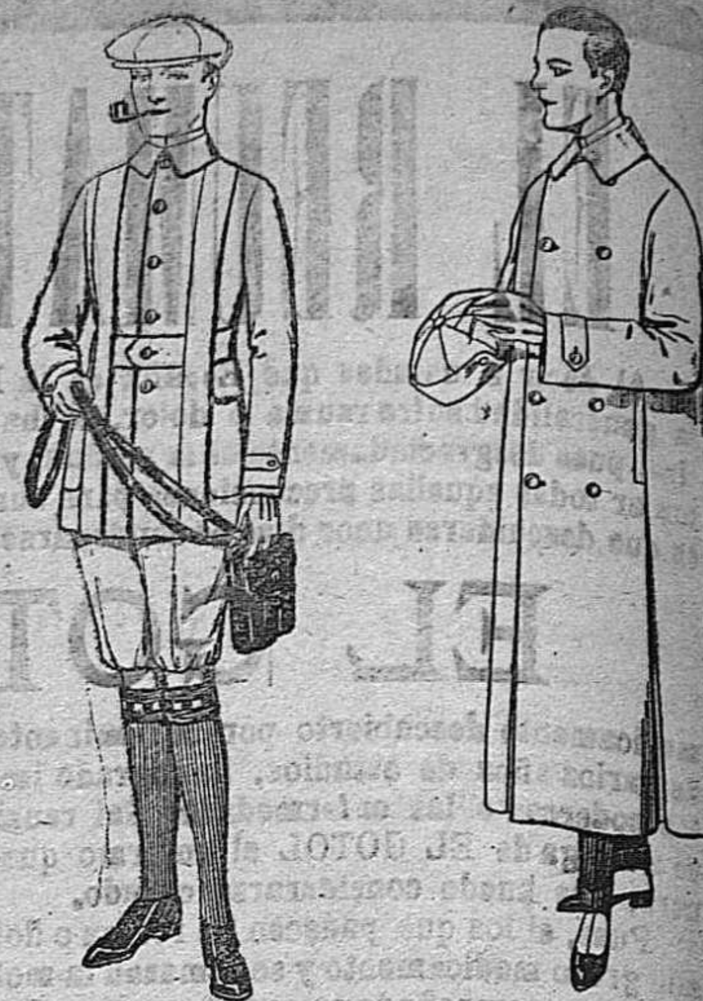
Cazadoras de dril crudo o kaki. De pts. 15 a 18. Pantalones cortos para excursionistas, en dril, beige o gris. De pts. 9 a 15.