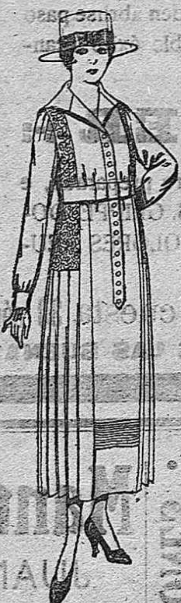
Vestidos de velo de algodón, blanco, bordados. De pts. 40 a 50.