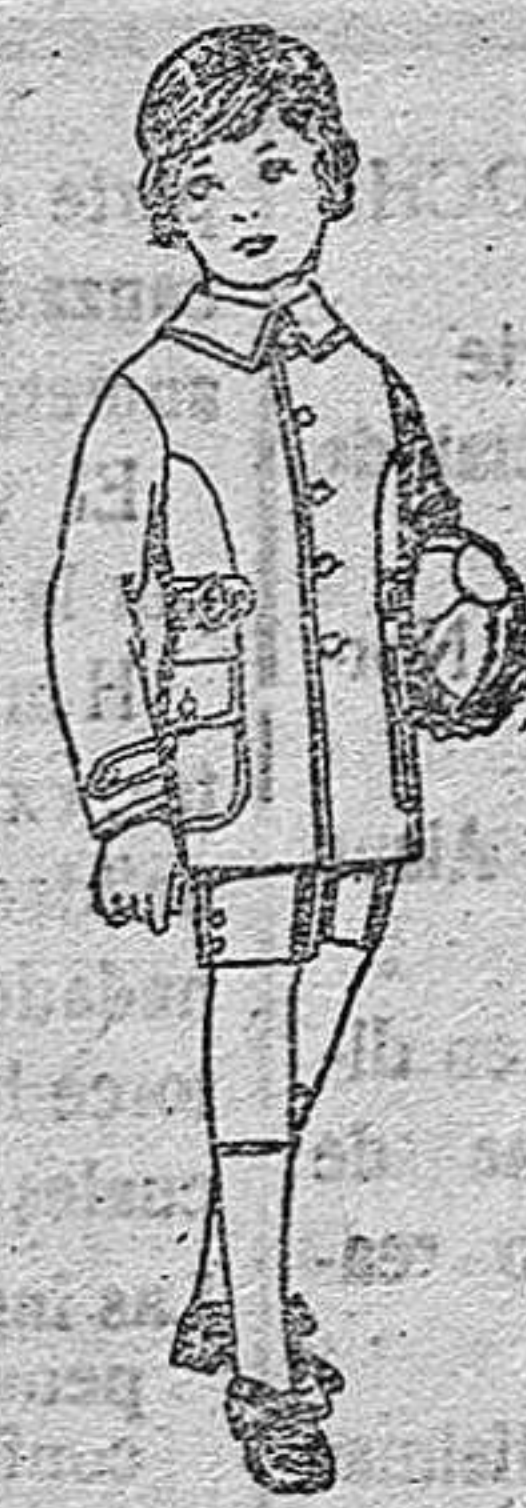
Trajes modelo sport, de lanilla, melton, etc., para niños de 4 a 9 años. De pts. 26 a 32.