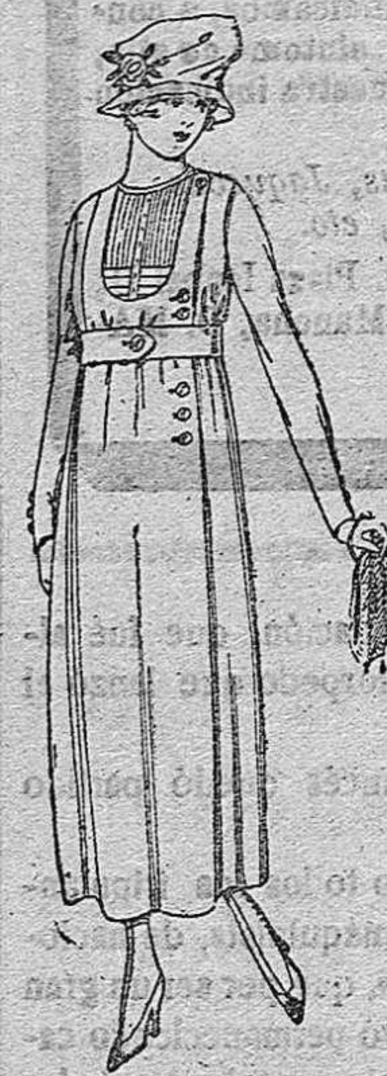
Vestidos de sarga inglesa, lanilla, etc., en negro, azul o color. De pts. 60 a 75.