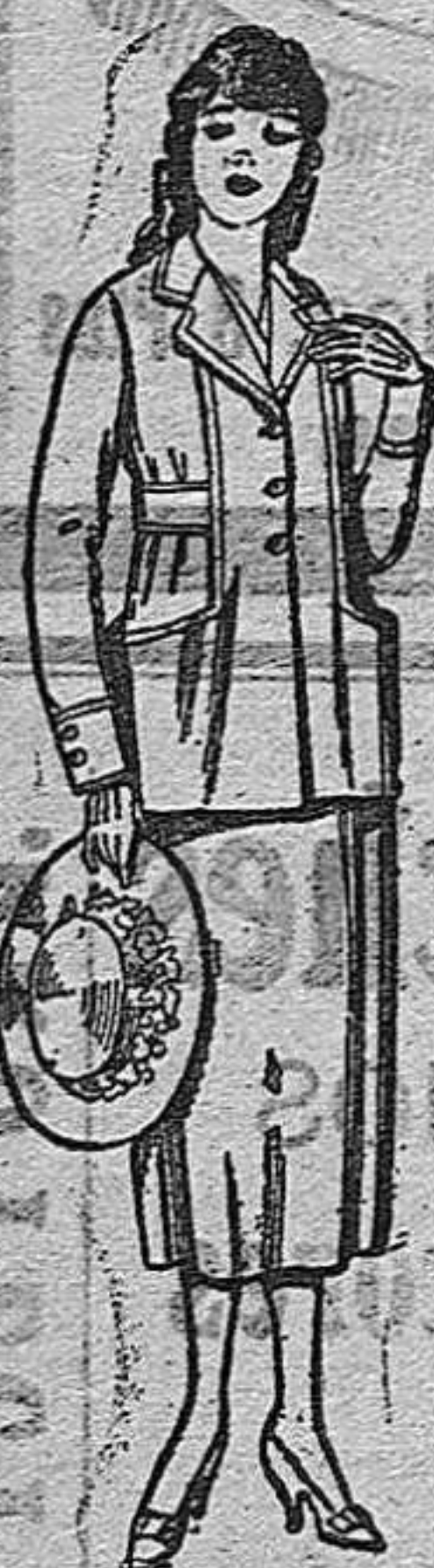
Trajes de estambre, gabardina, etc., en azul o color. De pts. 48 a 58.