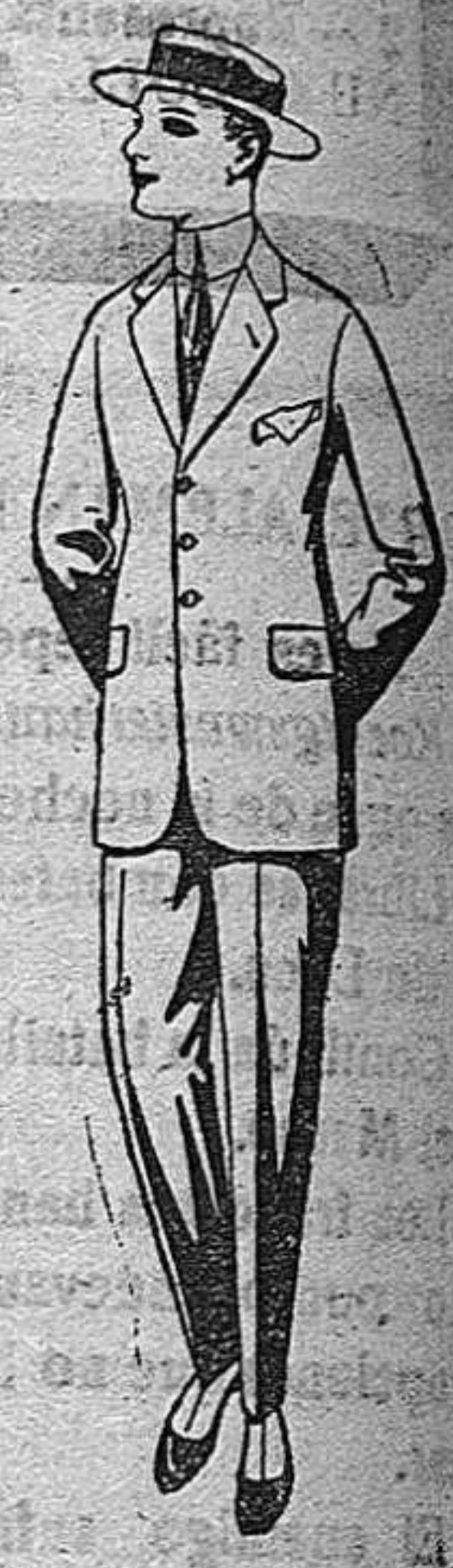
Trajes de lanilla, melton, vicuña, etc., para jóvenes de 10 a 15 años. De pts. 19 a 55.