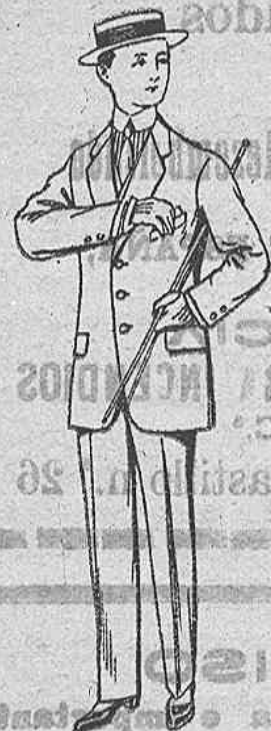
Trajes de lanilla, vicuña etc., para niños de 10 a 16 años. De Ptas. 14 a 48.