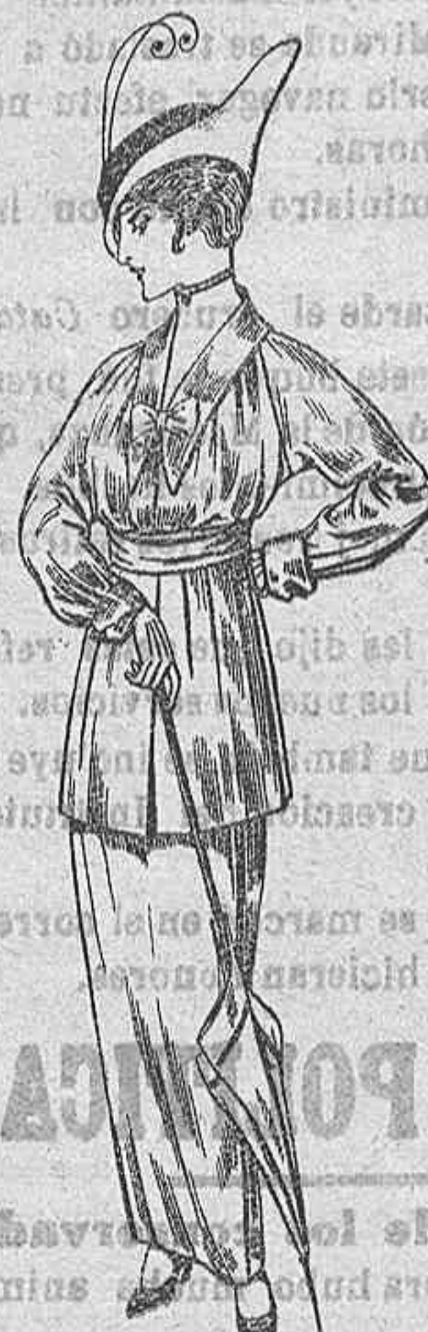
Vestido de lana negra o azul, para Señora. De Pesetas 35 a 40.

GORRAS, SOMBREROS DE PAJA, CINTURONES, CORBATAS, CALZETINES, FAJAS, LIGAS, TIRANTES, ETC., ETC.