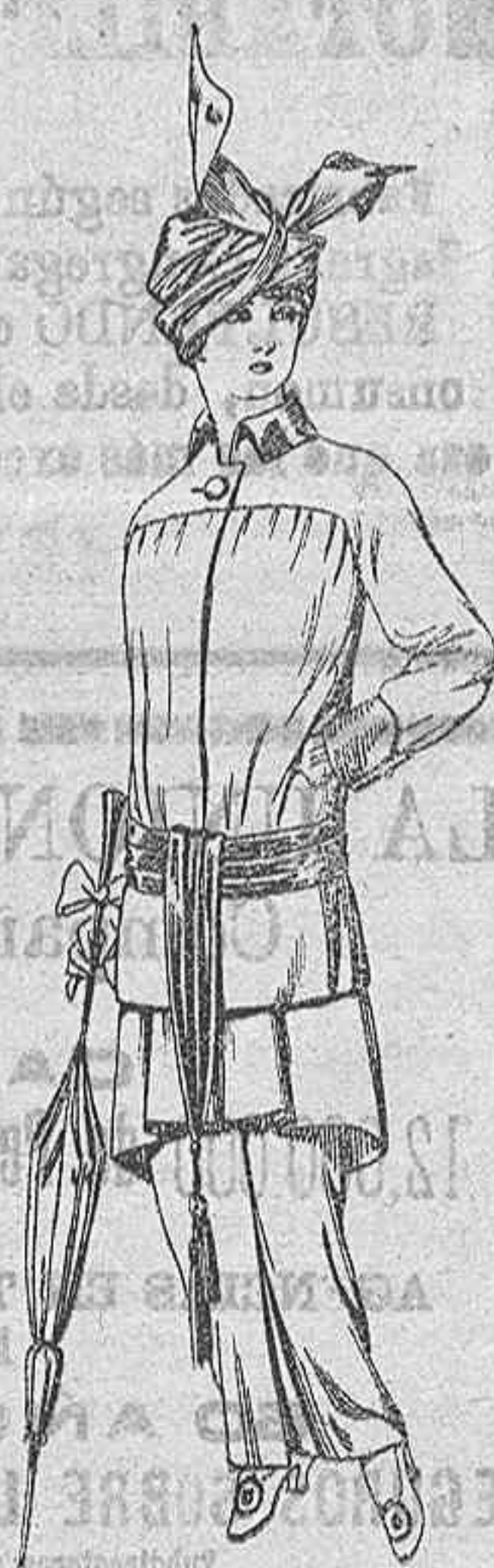
Traje de jerga azul o negra y géneros novedad, para Señora. De Pesetas 65 a 80.