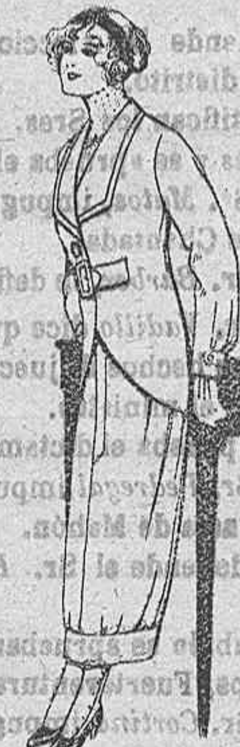
Trajes para jovencitas de 13 a 16 años. De Ptas. 27 a 30.