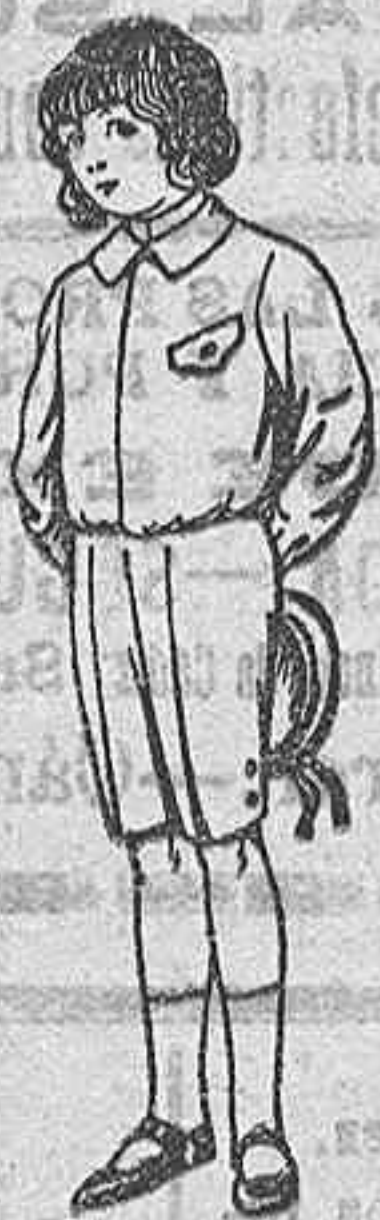
Trajes de lanilla, vicuña o jerga, para niños de 4 a 9 años. De Ptas. 5 a 10.