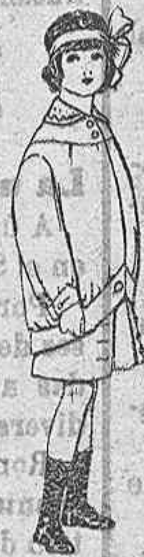
Trajes de lanilla para niñas de 4 a 12 años. De Ptas. 20 a 30.