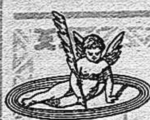
Marca de fábrica de posesión

está depositada con arreglo a lo que marca la ley y pertenece solamente a nuestra casa: no es, pues, la denominación de las máquinas parlantes ó fonógrafos, sino que se aplica especialmente a nuestro aparato, diferente de los otros en su estructura é invención.