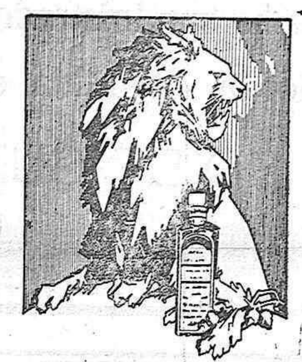
TETRADINAMO ENERGICO RECONSTITUYENTE EN SUS DOS FORMAS: ELIXIR E INYECTABLE. VIGORIZA A LOS DEBILES. REJUVENECE A LOS VIEJOS.

Consulta médico-quirúrgica de 3 a 4. Isabel la Católica, 2