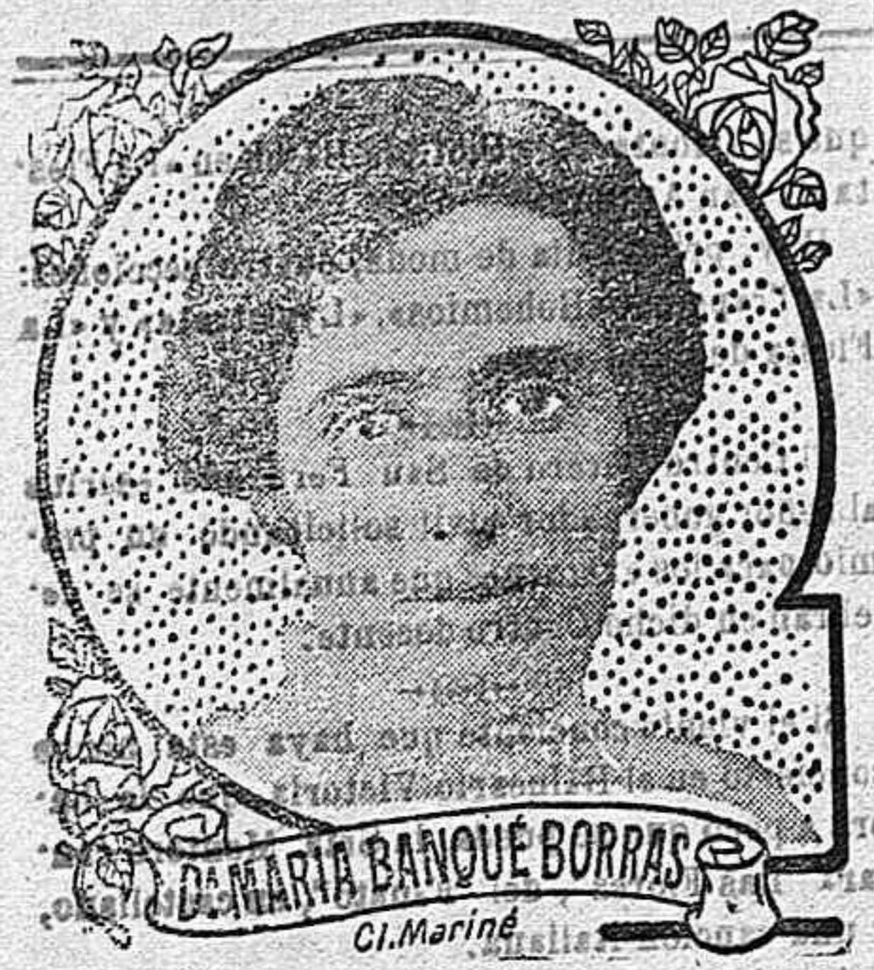
GRACIAS A LAS PILDORAS PINK VUELVO A VIVIR AL CABO DE DOCE AÑOS DE PADECIMIENTO...