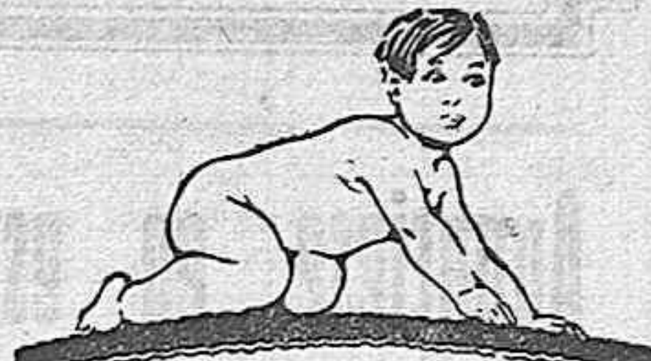
El más indicado para la piel y salud del niño, es el

Madrid.—La Reina Doña Victoria, estuvo esta mañana en la