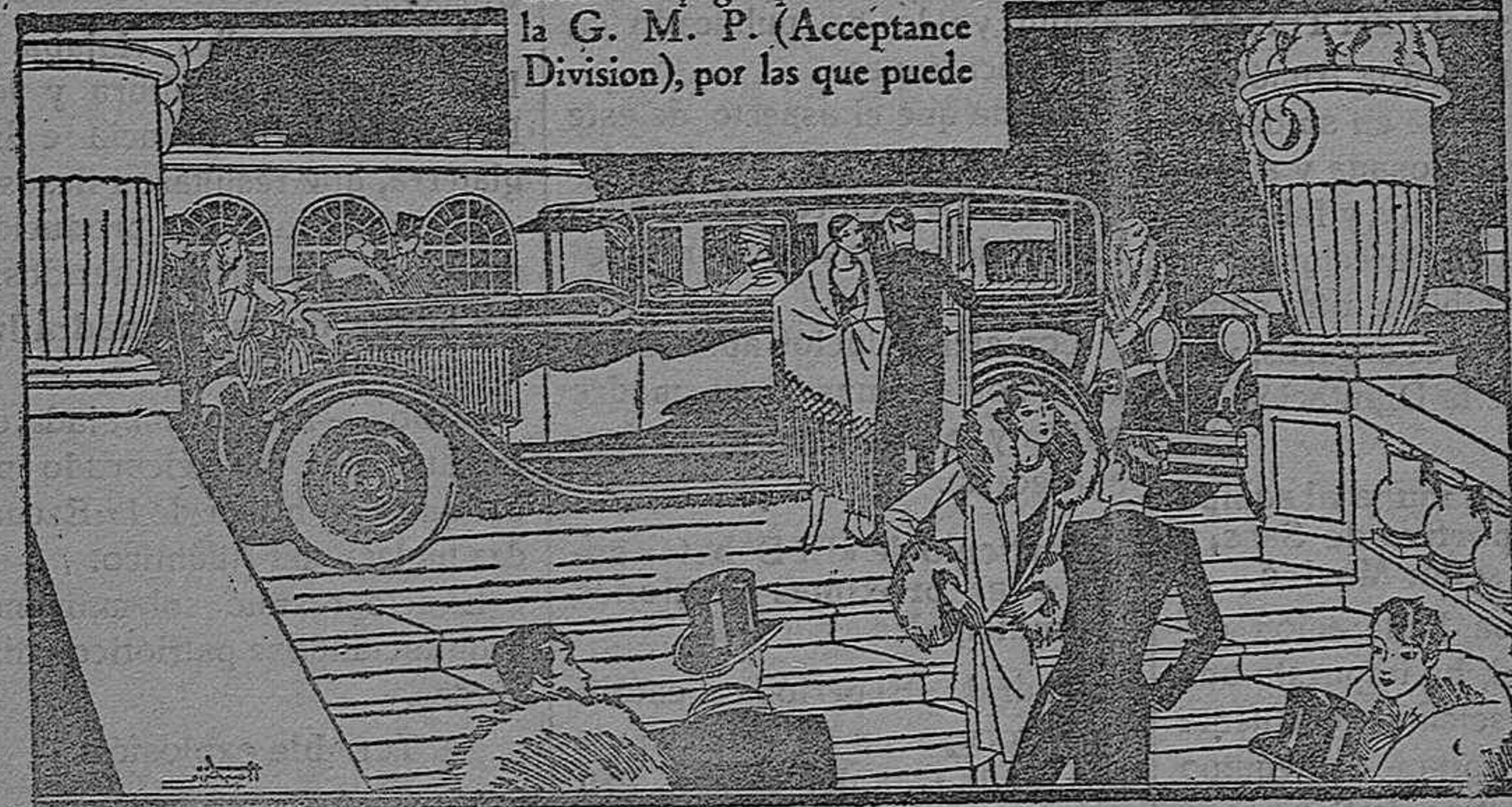
Compare el Oakland con otros coches y se admirará de lo económico de su entretenimiento