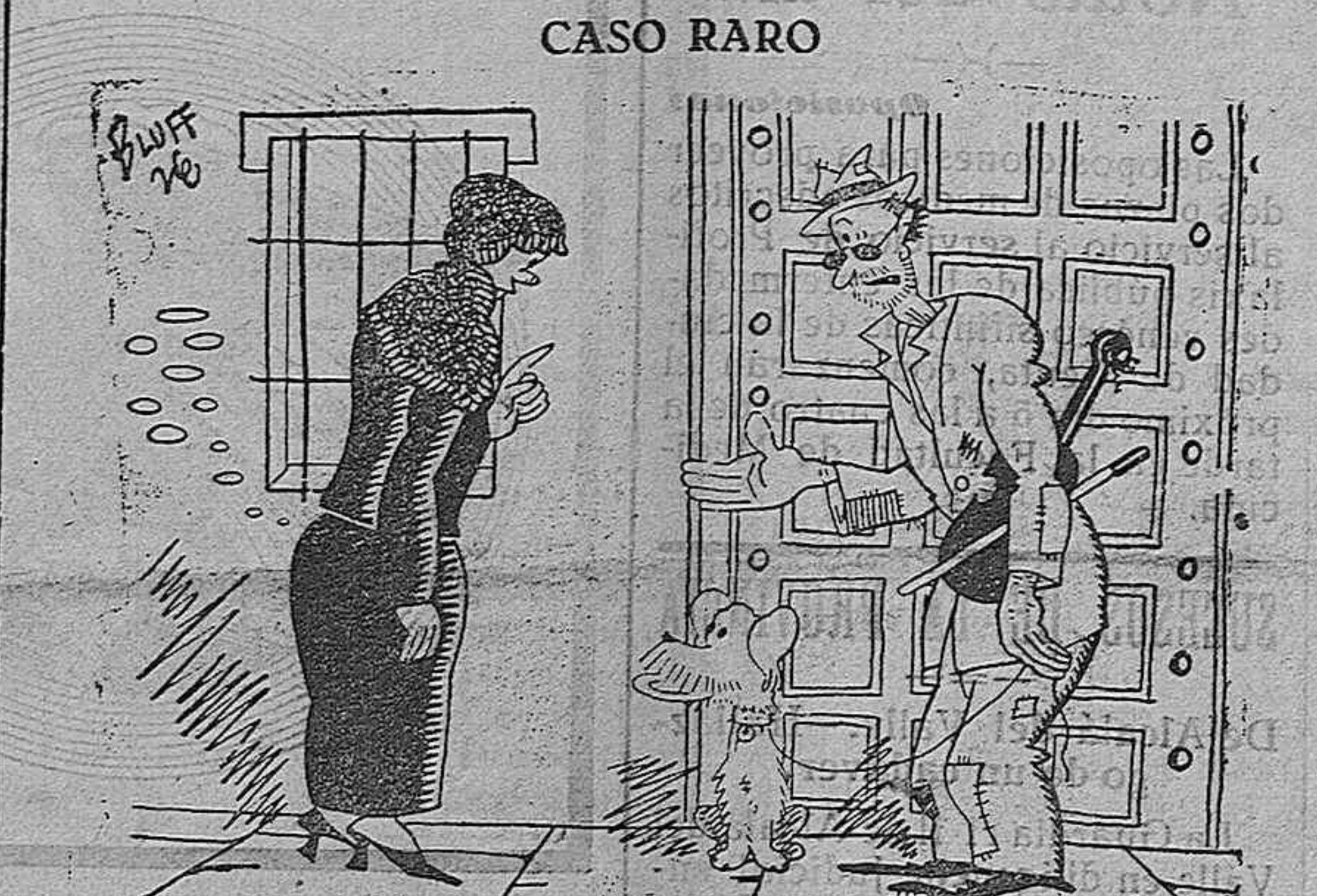
—Ya sabe Vd. que exijo que los que socorro, sean virtuosos. —Virtuosos! Señora, yo con el vidón hago horrores, y mi perro, no digamos; es el único que aun no le ha mordido a nadie en Cádiz.

En dicho informe se preconiza una traida de aguas desde Benamahoma a Cádiz con derivaciones de San Fernando a la Carraca y de San Fernando a Puerto Real, dando agua a Medina Sionia, Chiclana, San Fernando, la Ca-