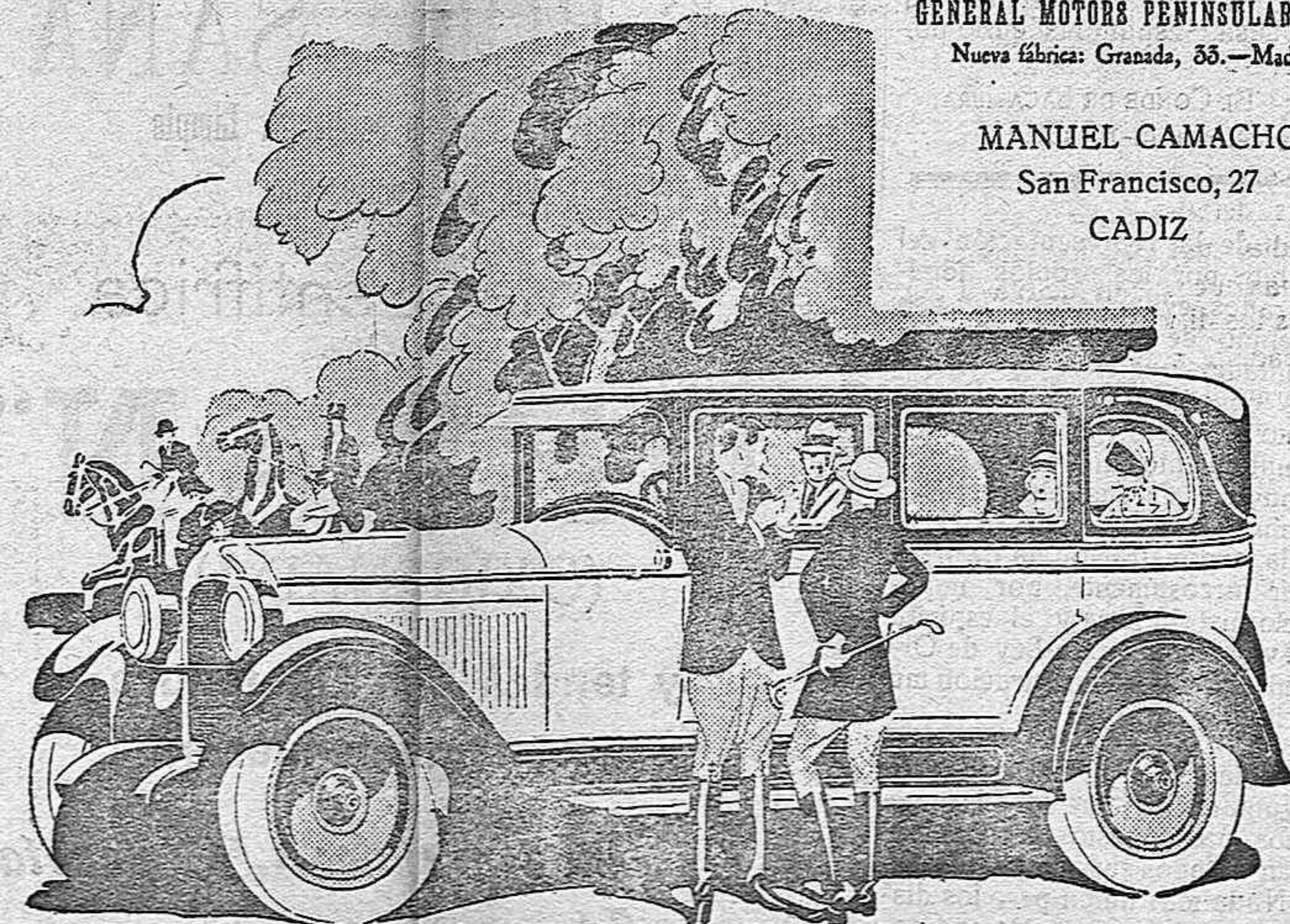
Fisher ha puesto en las carrocerías del Pontiac el sello de elegancia que siempre le caracteriza