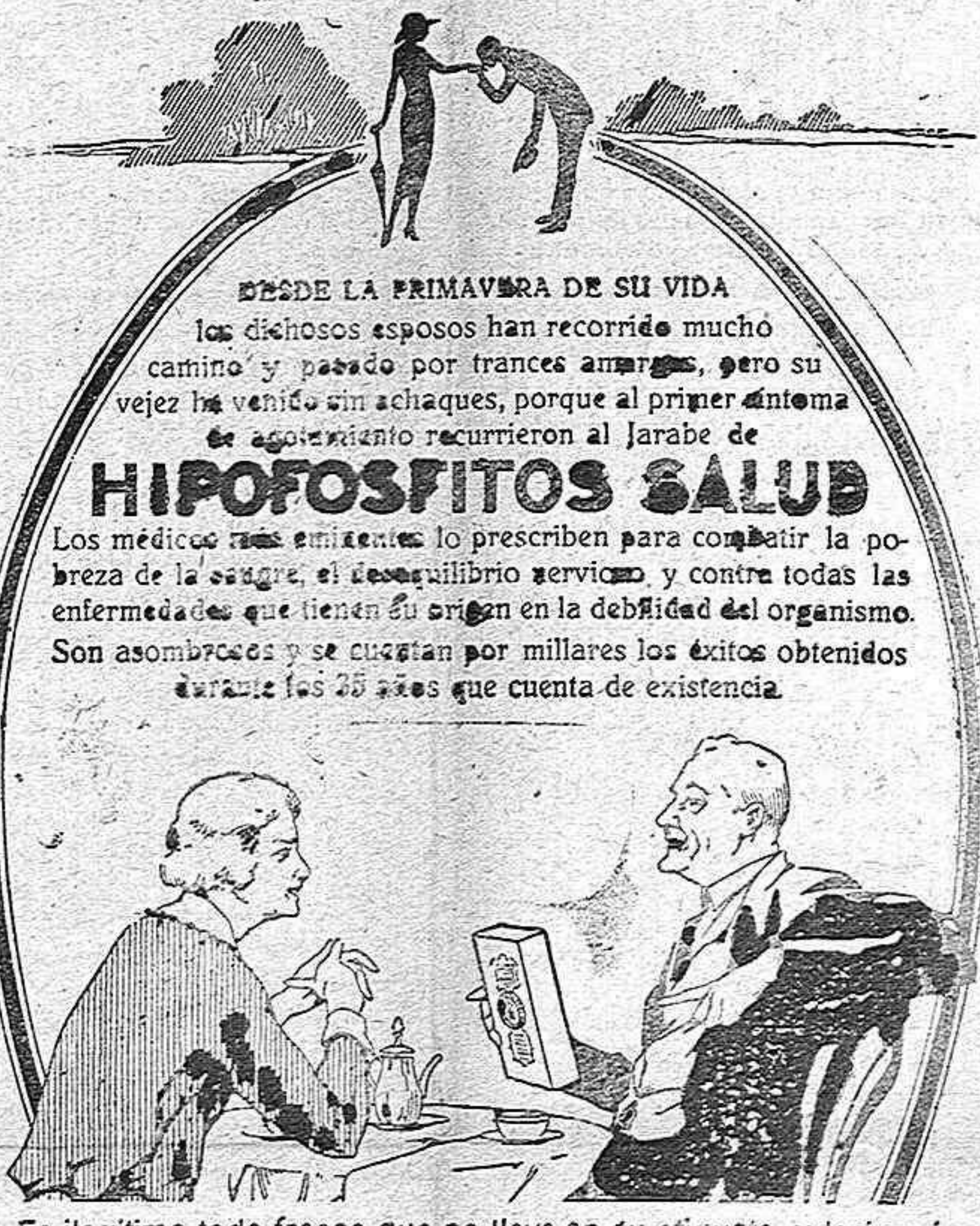
Es ilegítimo todo frasco que no lleve en su etiqueta exterior, e impresas en tinta roja, las palabras “HIPOFOSFITOS SALUD”

Tomás Istúriz.—Tel. 324.—Servicio a domicilio