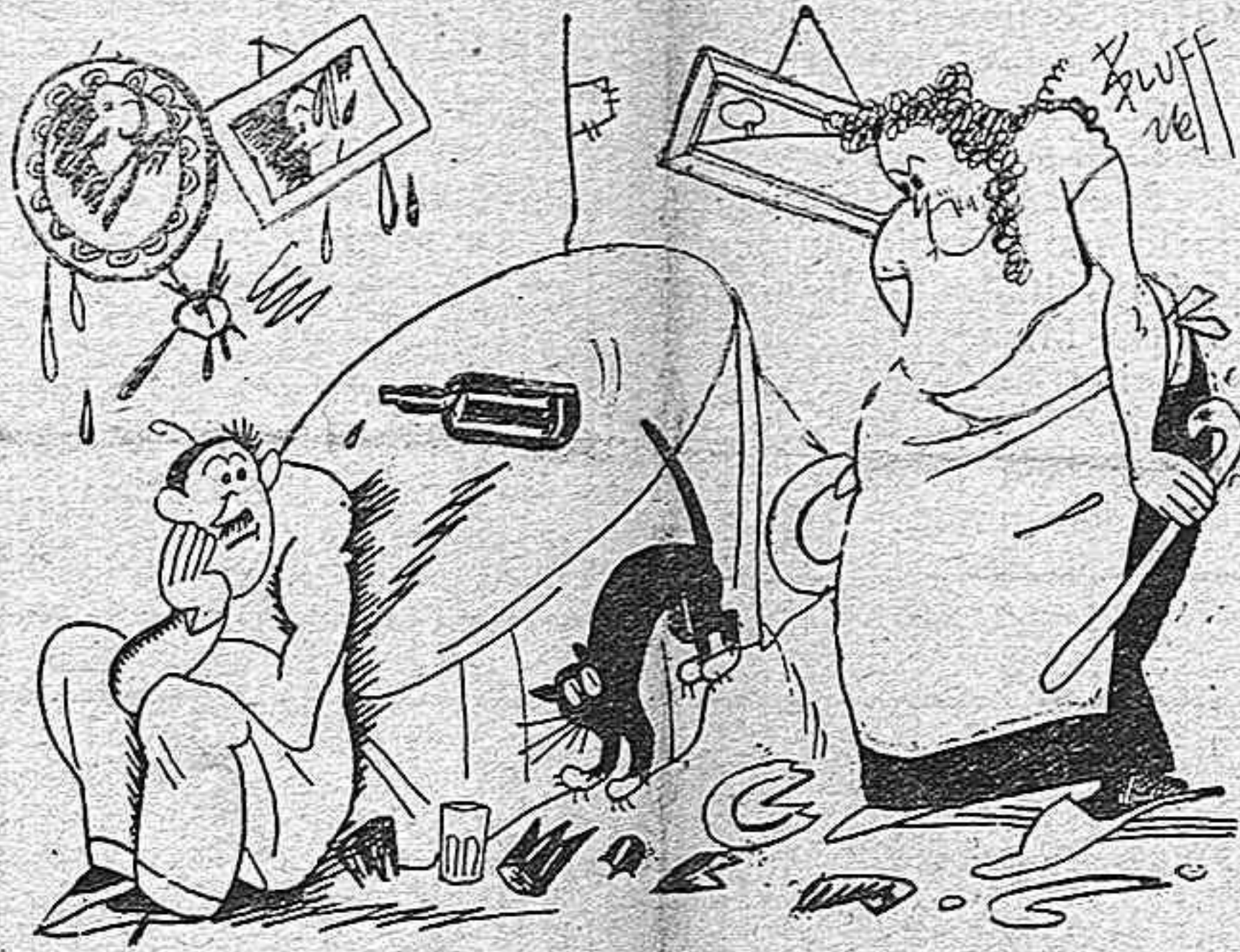
—Y me contento con esto, porque fué al carroussell donde subiste con las vecinitas, que si llega a ser a la Casa de los Locos o al Chicote, tienes tú locura y yo chicote pa una temporá