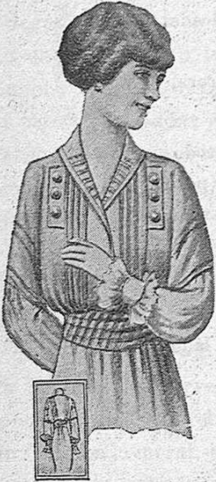
BLUSITA, de etamina color verge, á grupos de pliegucitos; mangas añadidas y puños diábolo; faja rayada, de tono algo subido.

Las mujeres que no tengan á su disposición un presupuesto importante para su toilette, las que tengan que recurrir á llevar á casa una costurera para la confección