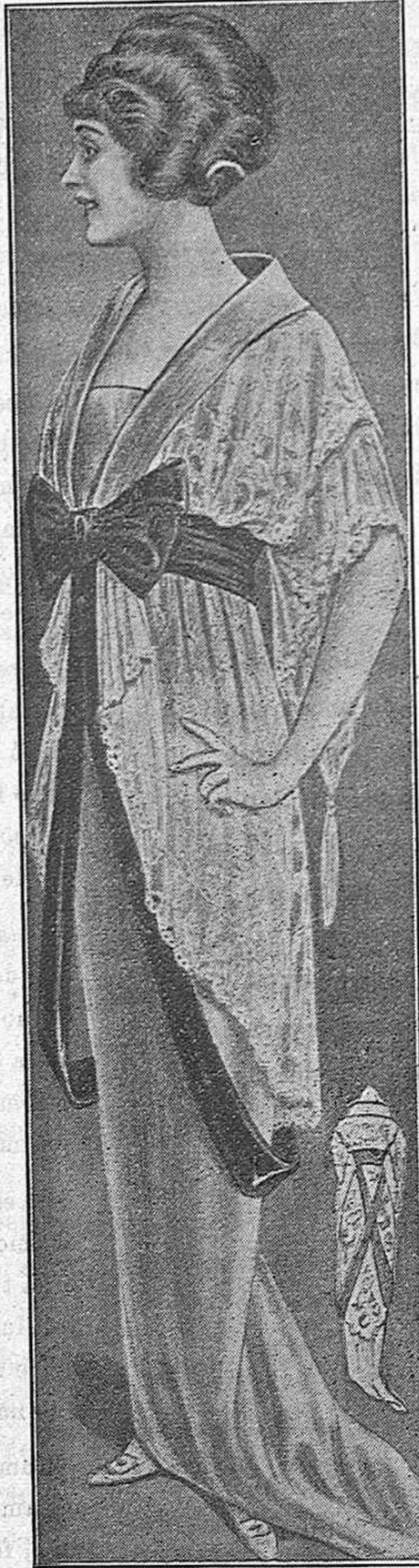
PARA CASA. - En terciopelo azul claro con una túnica blanca de encaje, y ancho lazo de terciopelo negro, del cual parten unas bridas recogidas por detrás.

Los cinturones desempeñan importante cometido