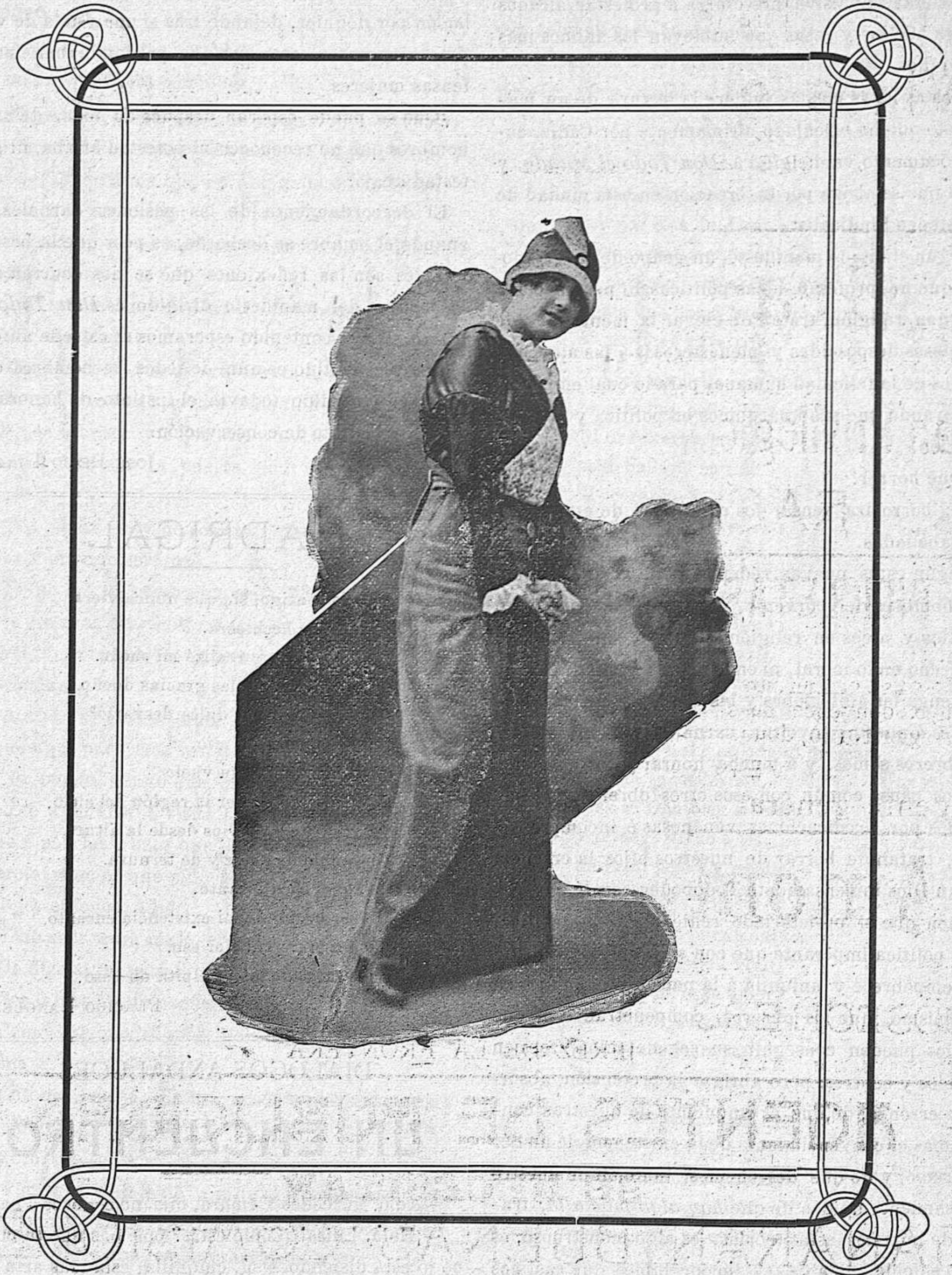
AFRICA , aplaudidísima canzonetista