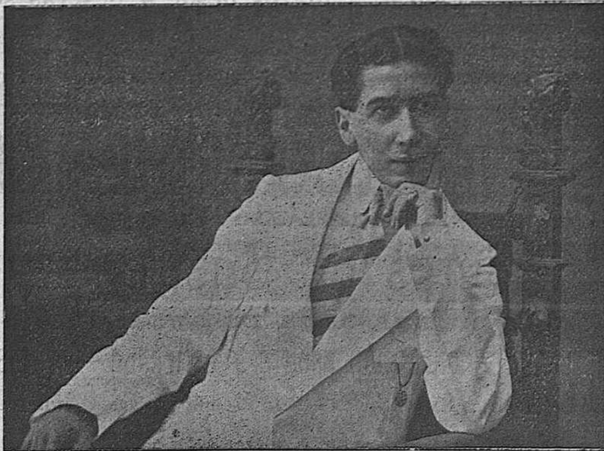
El distinguido primer actor MANUEL CEBALLOS