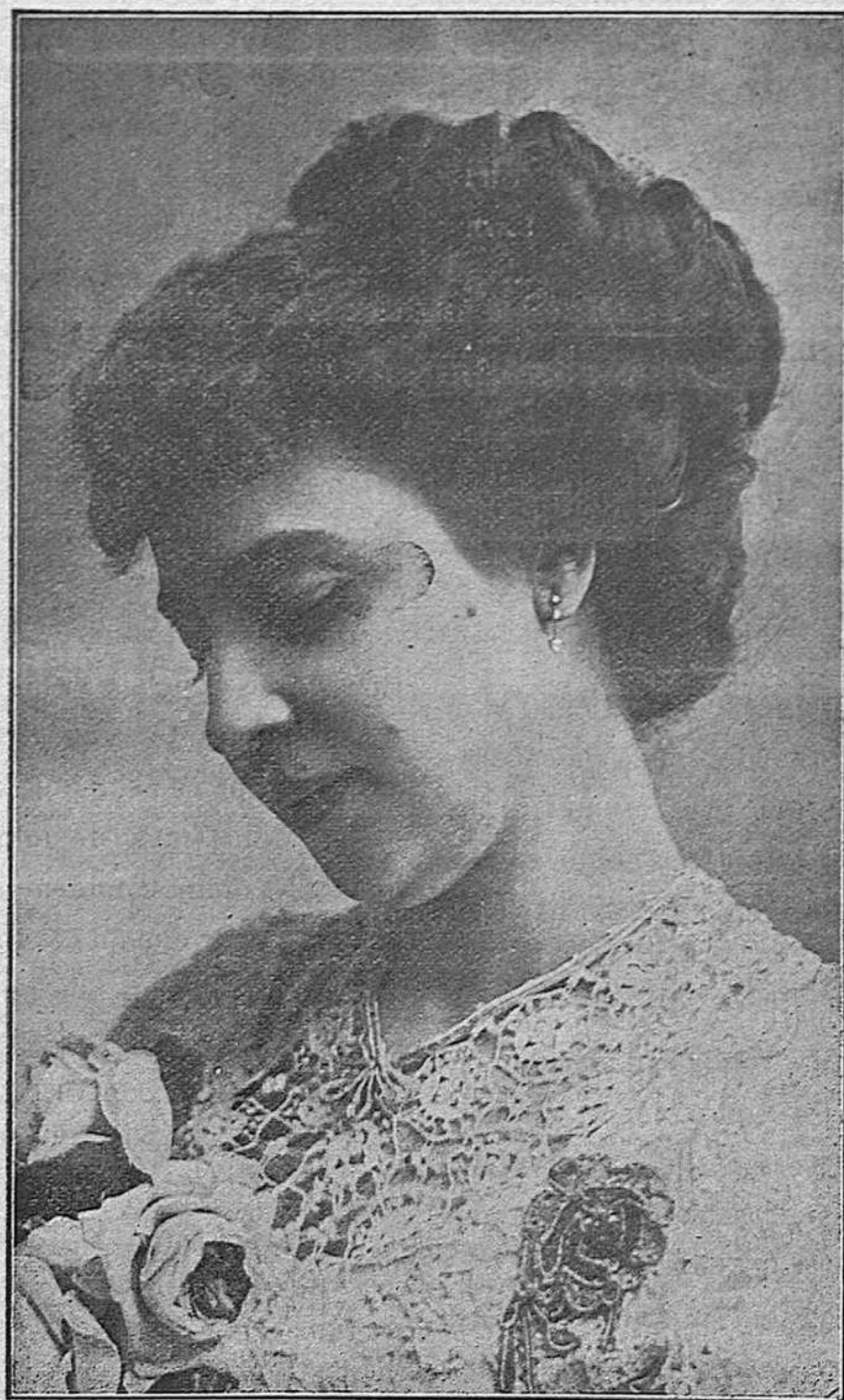
La aplaudida primera actriz CARLOTA PLÁ