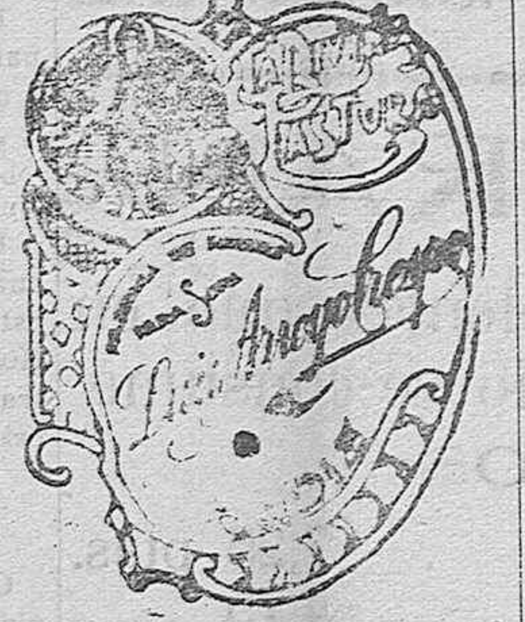
Los Amigos del Aite