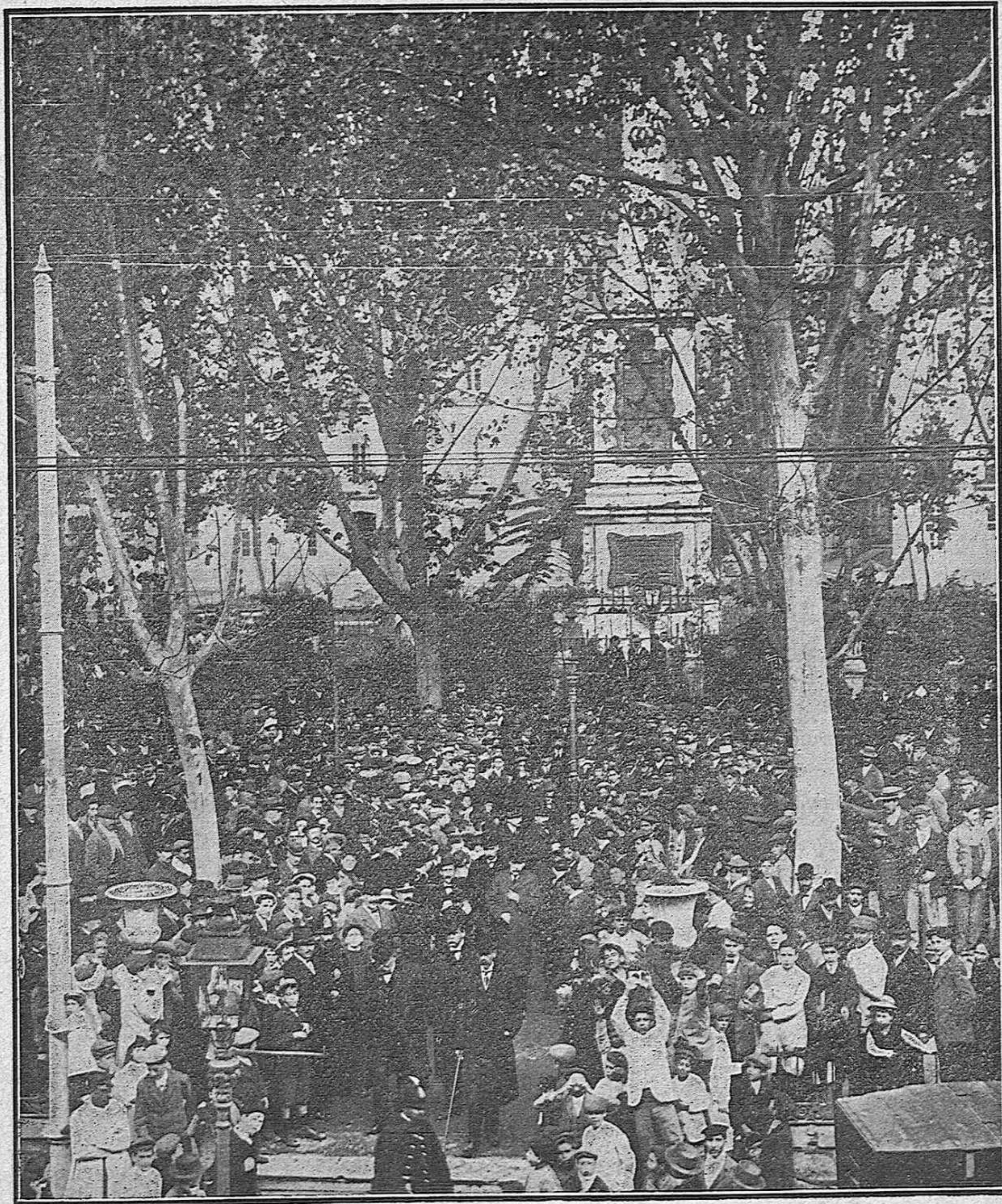
Málaga: La Presidencia de la Procesión Cívica á su regreso de depositar coronas en el monumento á Torrijos y sus compañeros, en la tarde del día 11, aniversario de los fusilamientos.