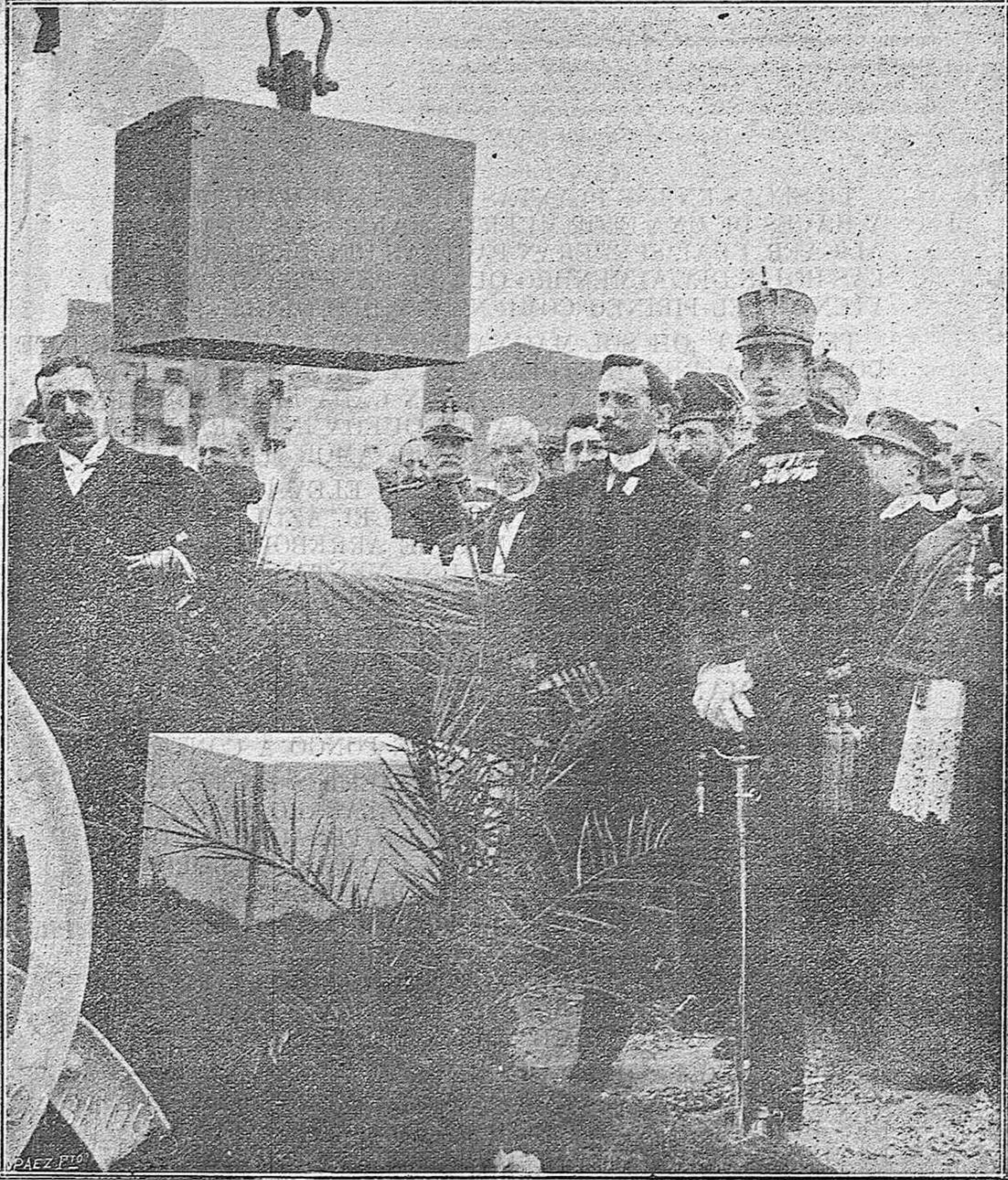
VALENCIA: S. M. EL REY D. ALFONSO XIII EN LA CEREMONIA DE LA COLOCACIÓN DE LA PRIMERA PIEDRA DEL MONUMENTO QUE SE ERIGIRÁ EN MEMORIA DEL HEROICO CABO NOVAL