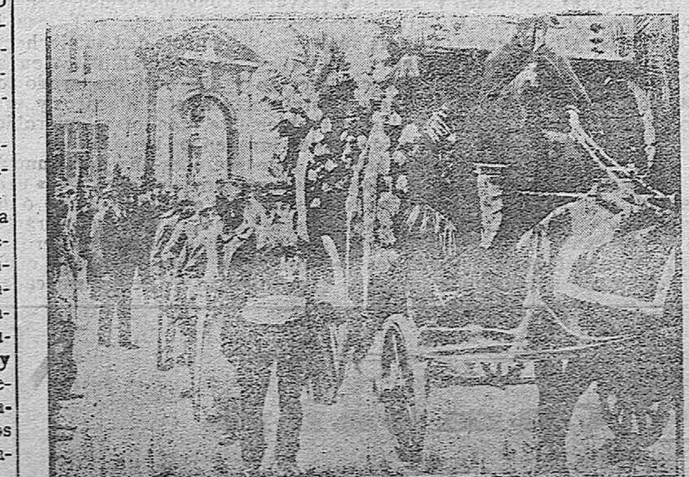
DE LA GUERRA.—Entierro de un soldado francés muerto heroicamente

En el ganado equino (caballar y asnal) dada la diversidad de tipos y caracteres que se aprecian en el ganado caballar de nuestra provincia, hay que empezar por hacer un detenido estudio de la cuestión en el sentido de dirigir, de orientar la