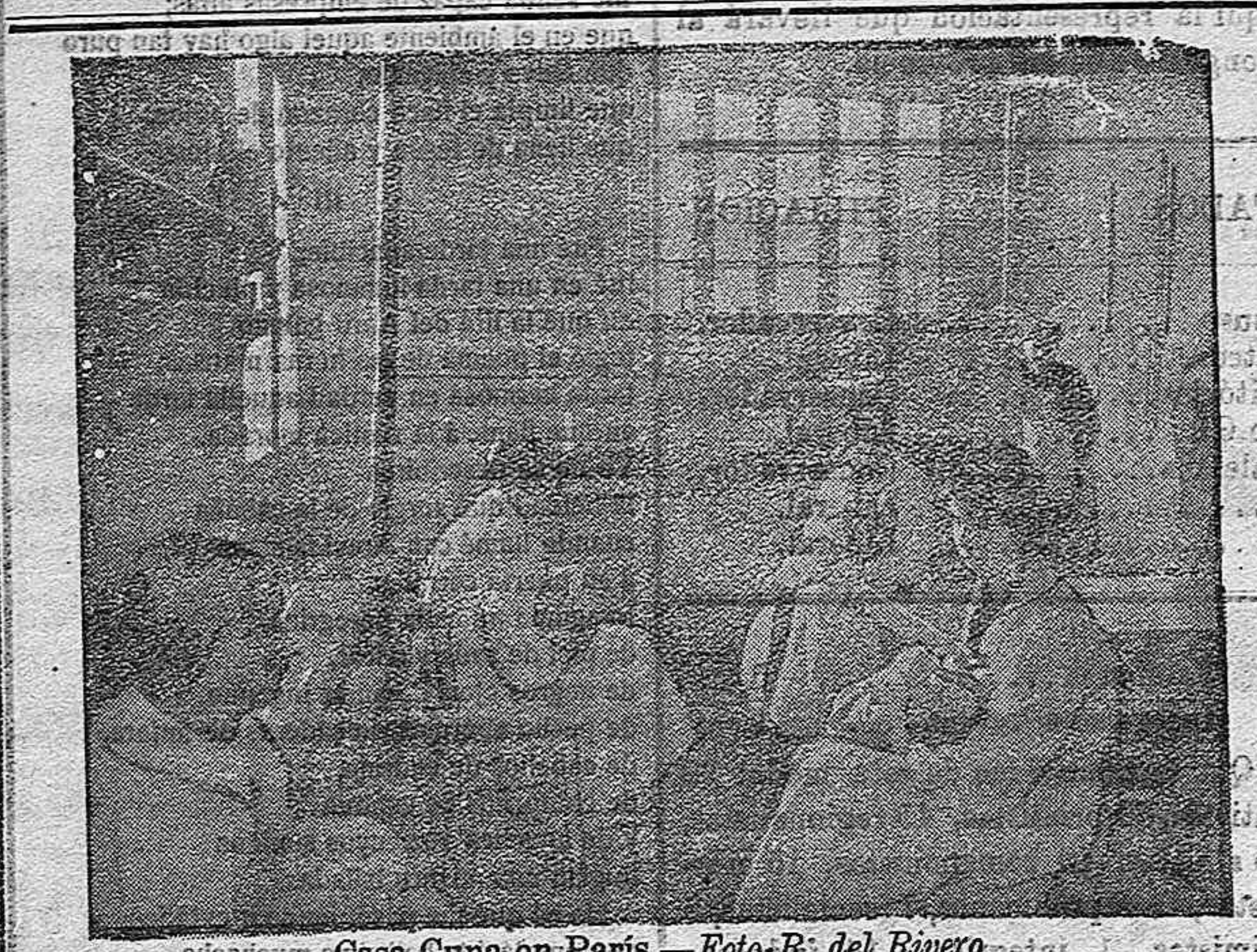
Casa-Cuna en París.