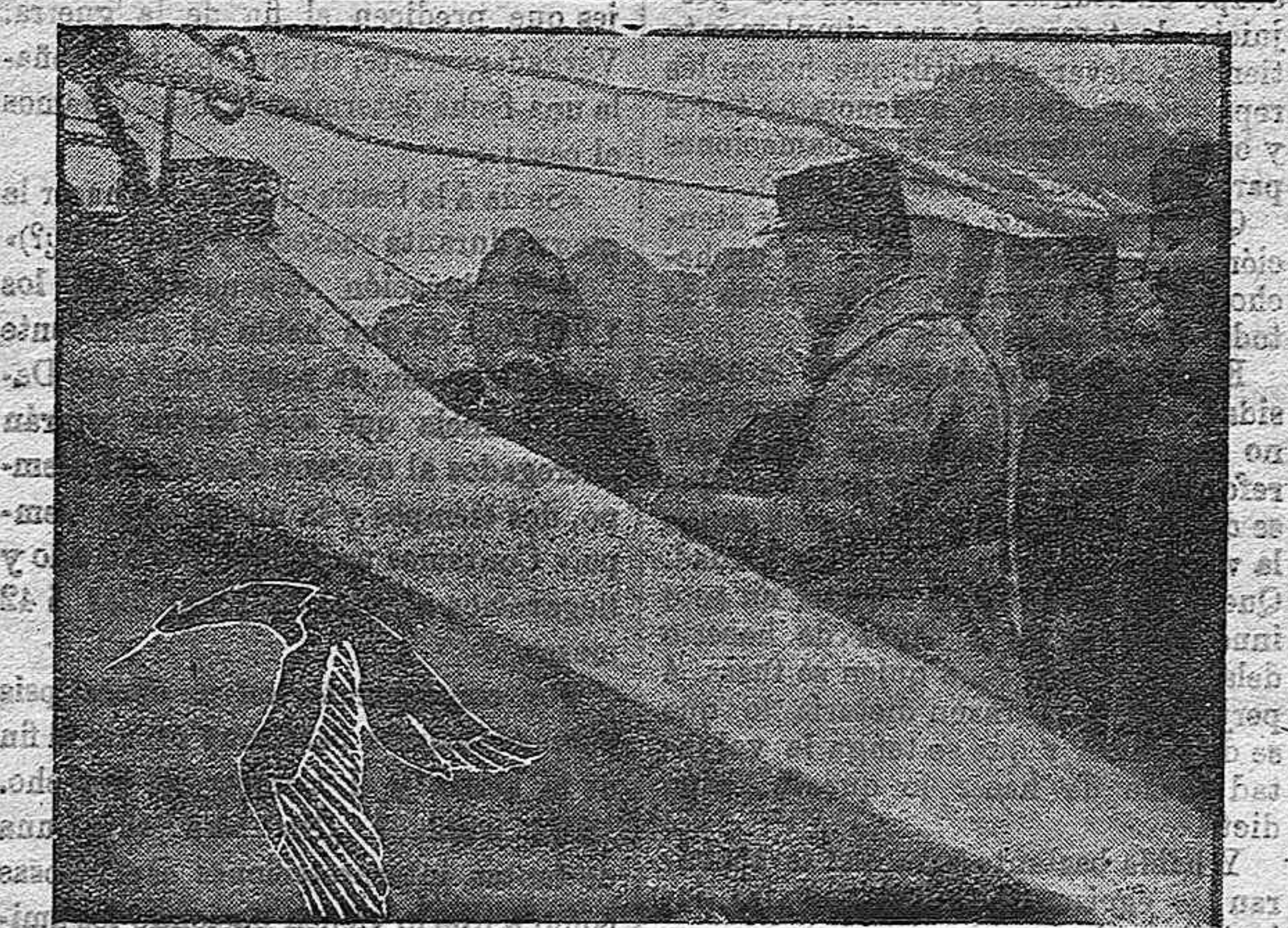
Visita de Mr. Clemenceau á un campo de aviación.

Aunque no tanto como en los distritos de Hoyos y Plasencia, también en el de Trujillo ha sido ruda la lucha