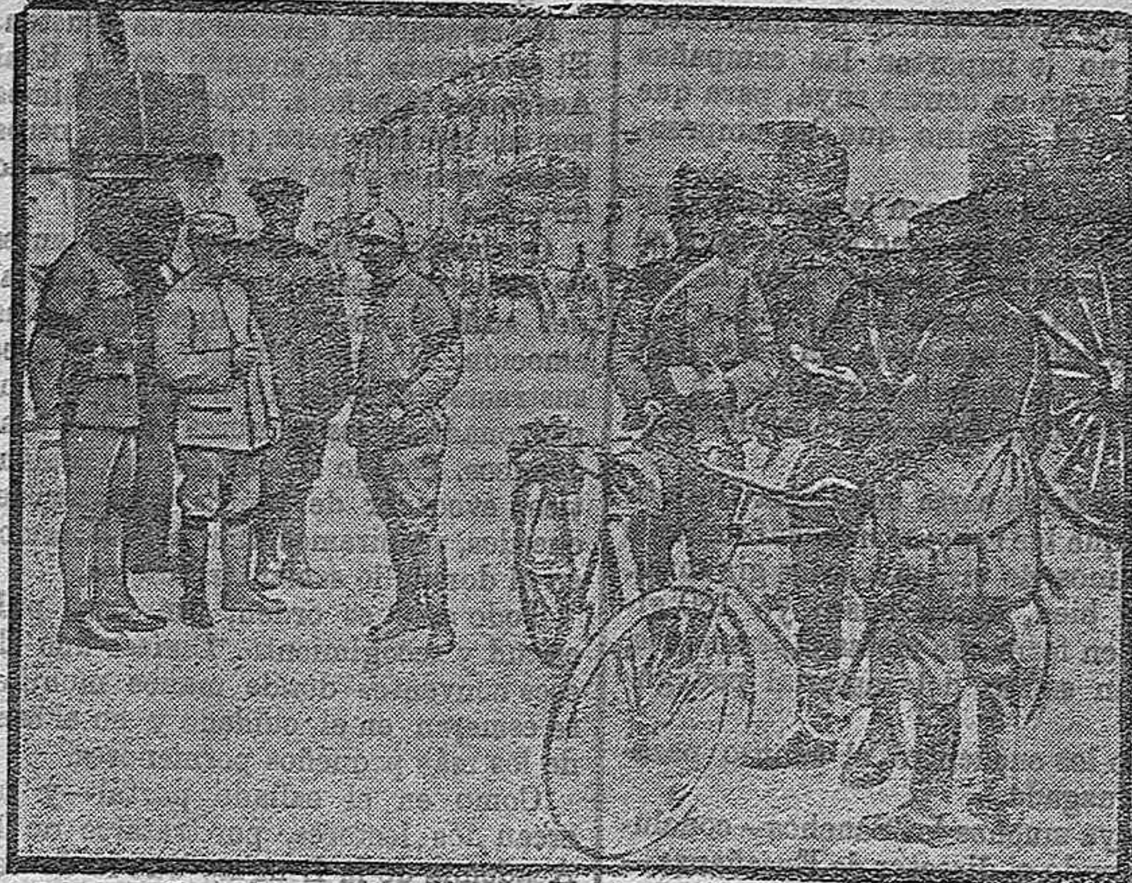
La colaboración franco-belga.