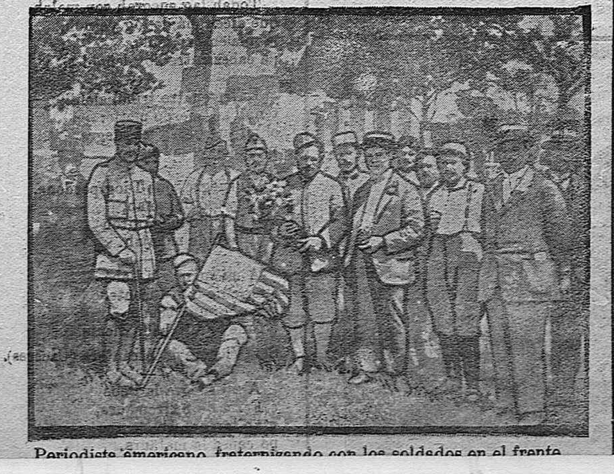
Periodista americano tratándose con los soldados en el frente