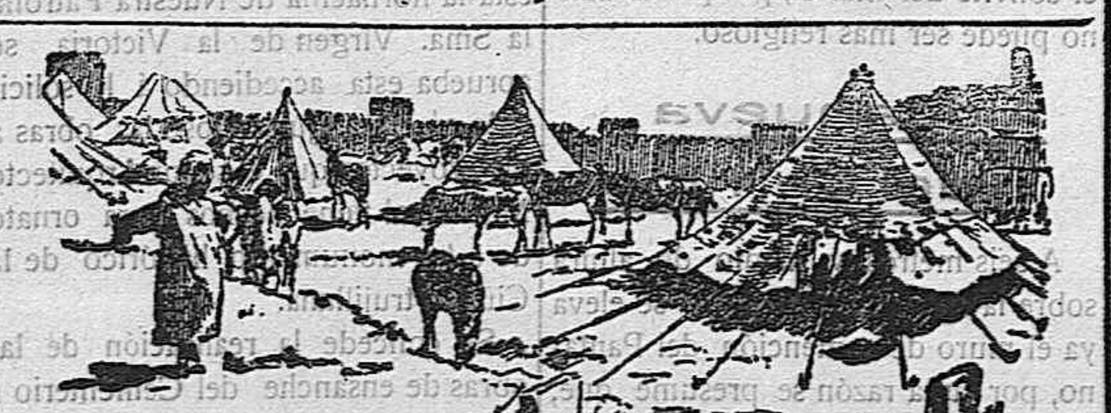
Campamento de una mehalla sherifiana en las afueras de Féz.