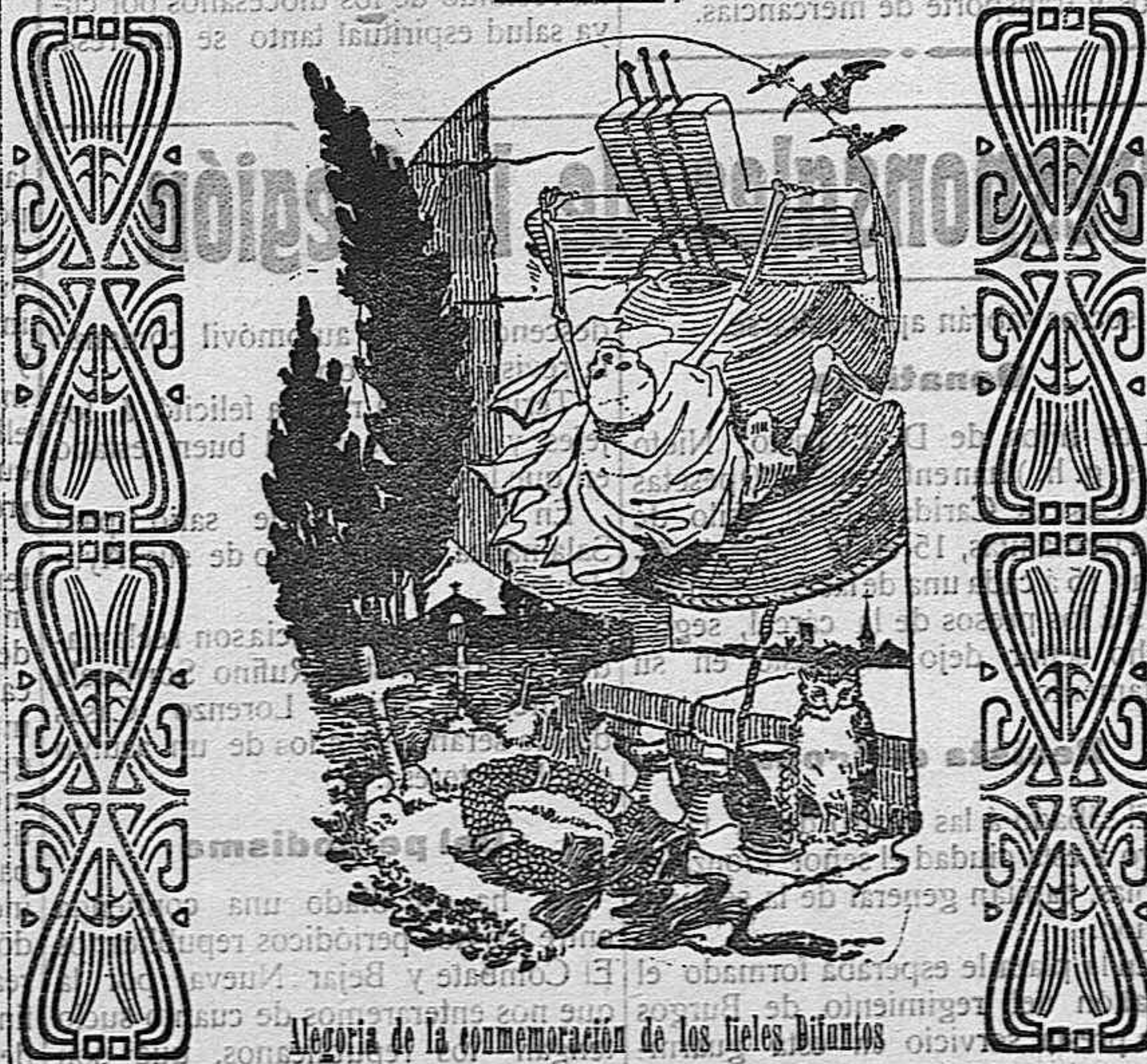
Allegoría de la conmemoración de los Hechos Dignos