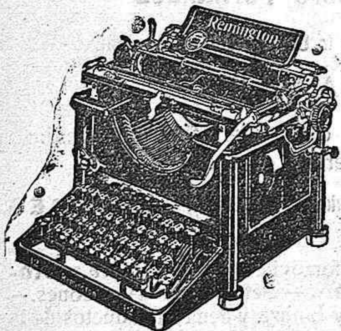
Máquina de funcionamiento silencioso

EN LOS 52 AÑOS QUE LLEVA DE PRÓSPERA EXISTENCIA LA CASA HA LOGRADO QUE SUS ÚLTIMOS MODELOS HAYAN SIDO ACLAMADOS UNIVERSALMENTE COMO LOS MÁS COMPLETOS, PRÁCTICOS Y SÓLIDOS: PIDA V. HOY MISMO CATALOGOS EXCLUSIVA DE VENTAS PARA EXTREMADURA Y SALAMANCA