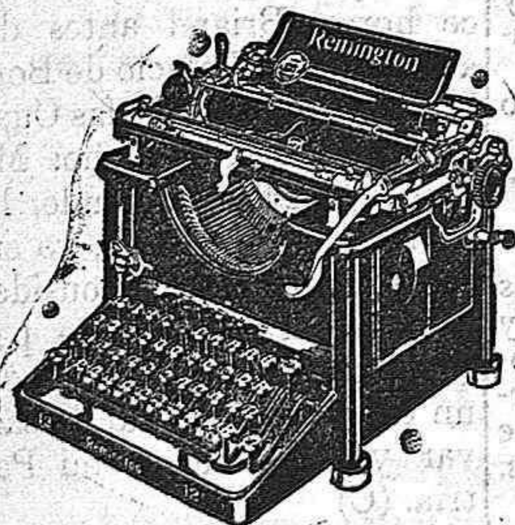
Máquina de funcionamiento silencioso