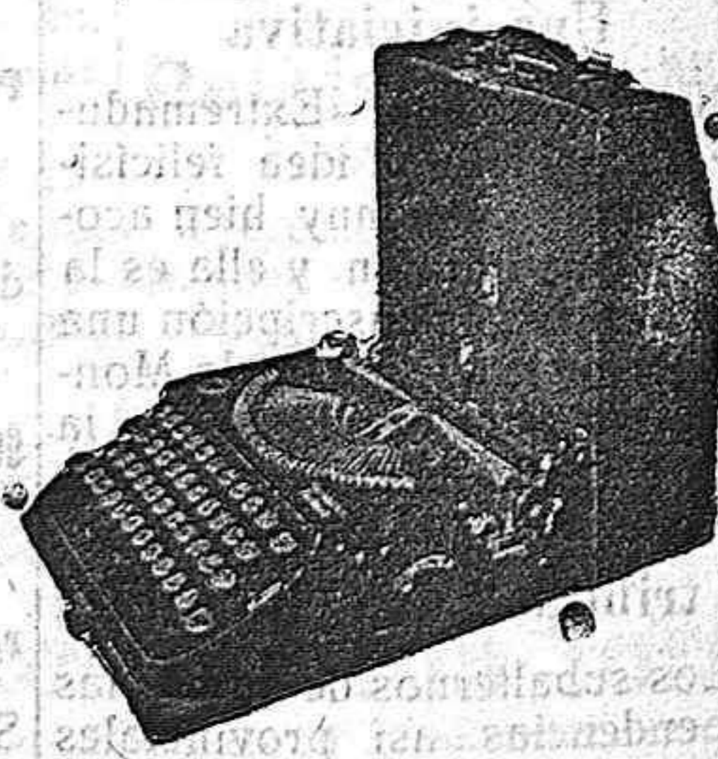
La primera máquina de escribir Portátil con teclado universal