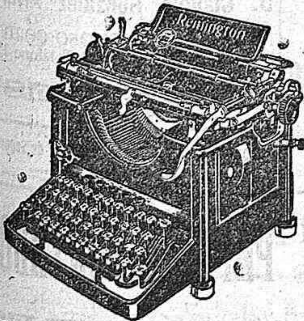
Máquina de funcionamiento silencioso