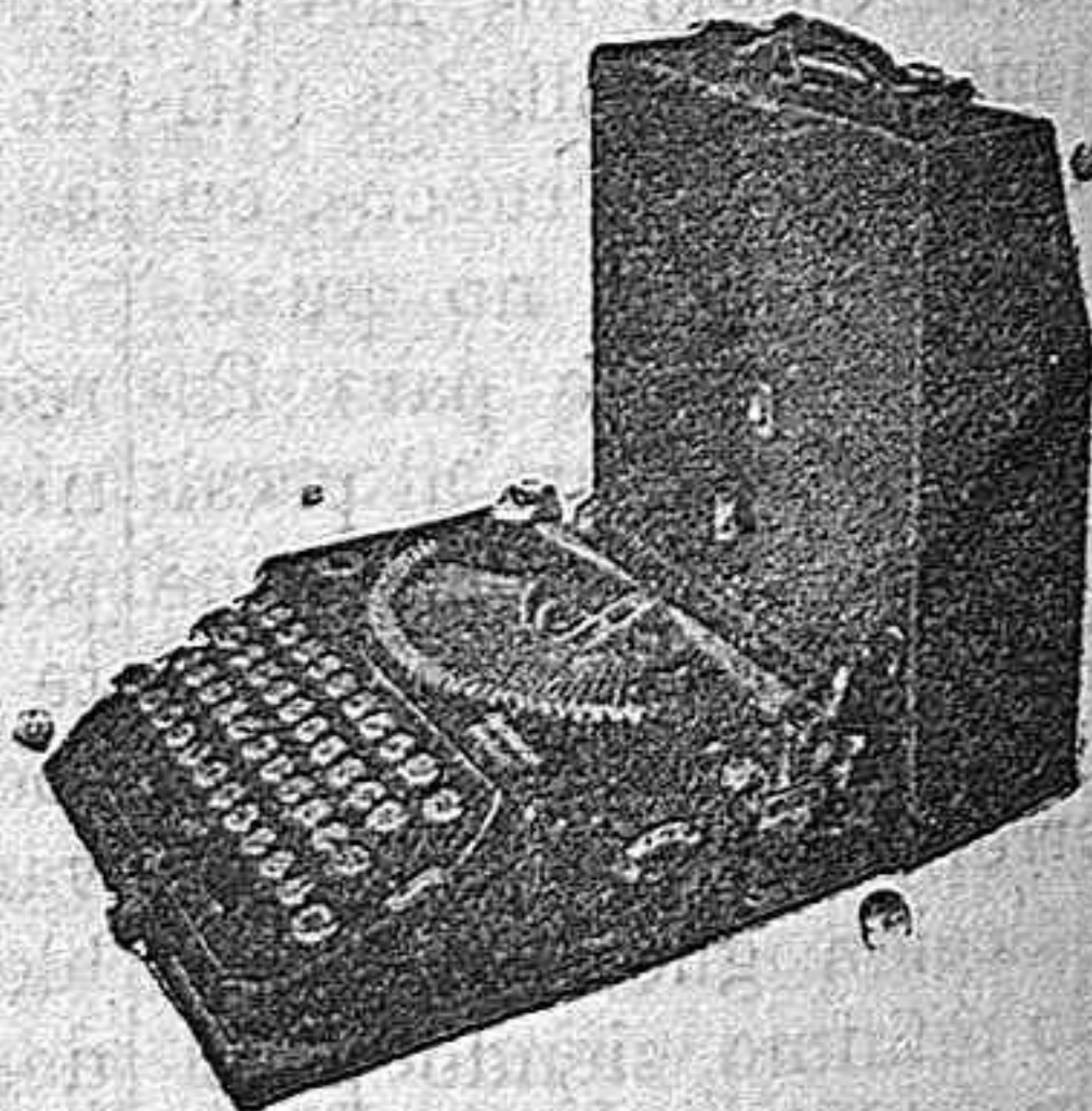
La primera máquina de escribir Portátil con teclado universal