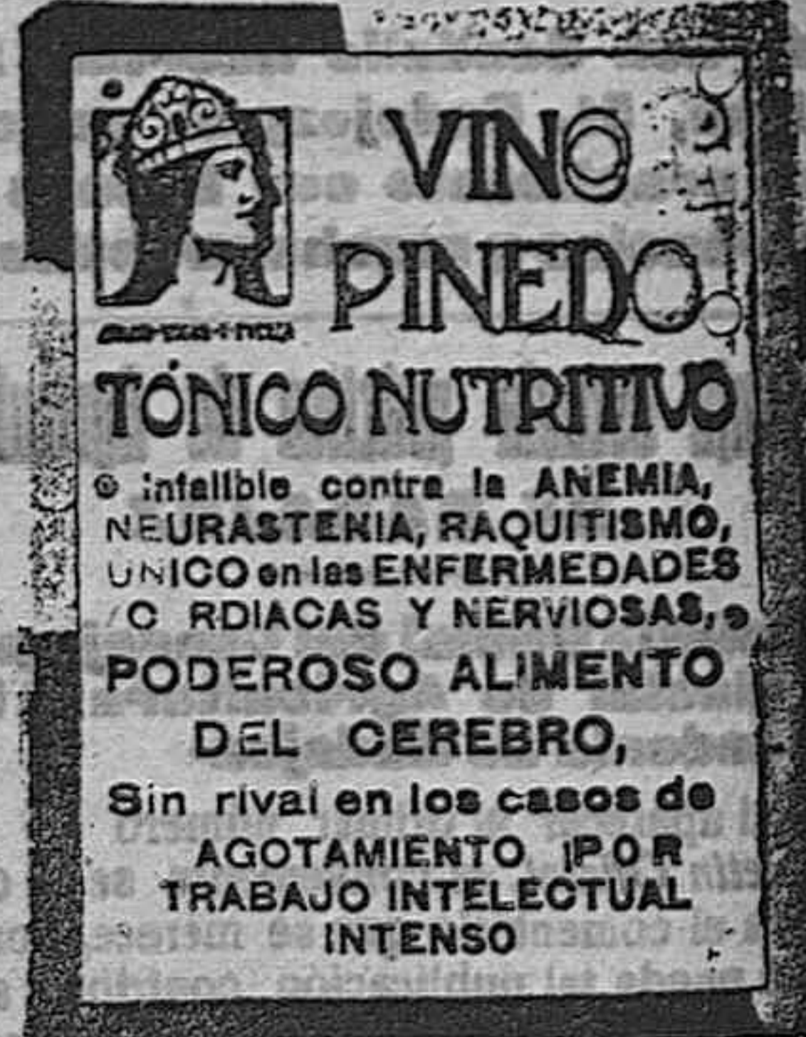
Badajoz.—Imprenta «Correo de la Mañana».

La preferida por el público, por ser la que más barato vende. DROGUERIA EXTREMEÑA SAN JUAN, 34